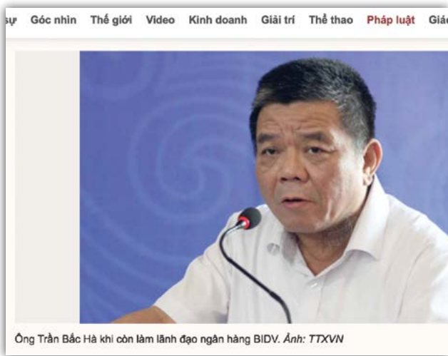
Ông Trần Bắc Hà khi còn làm lãnh đạo ngân hàng BIDV.

Giả như không mất đi mấy trăm triệu USD này thì có thể làm được mấy trăm cây cầu cho miền núi xa xôi, giúp các học sinh không phải lội sông để đi học trong nguy hiểm.