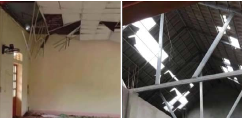
Một số ngôi nhà đã bị hư hại sau các trận động đất ở Sơn La. (Ảnh chụp từ màn hình video)

tỉnh Sơn La, độ sâu chấn tiêu khoảng 14 km.