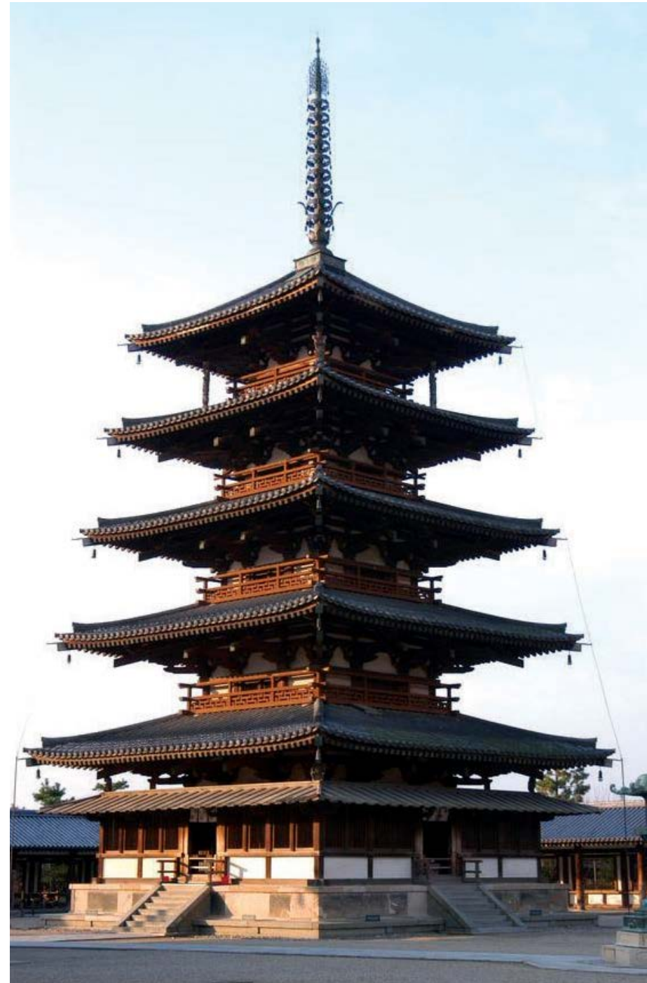
Chùa Horyu-ji là ngôi chùa được xây dựng bằng gỗ lâu đời nhất thế giới.

của Thái Tử Shotoku, bên cạnh việc khuyến khích Phật Giáo, hiến pháp cũng khích lệ các giá trị của Nho Giáo, như sự hài hòa, trung thành, và phép tắc. Hầu hết những điều trong hiến pháp đều đưa ra các hướng dẫn về mặt đạo đức rõ ràng, đơn giản, và mạnh mẽ cho người dân: "Lấy hòa làm quý và tránh tranh đấu", "nghiêm cấm chấp hành lệnh bề trên", và "không được tạt dùi!"