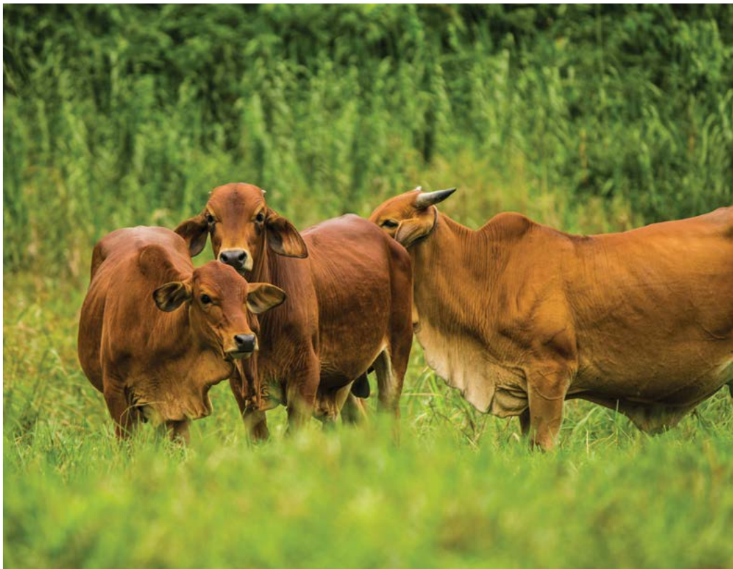
Ngân hàng BIDV đã cho Công ty Bình Hà vay trái quy định trong dự án chăn nuôi bò tại Hà Tĩnh, gây thất hàng chục triệu USD tiền ngân sách.