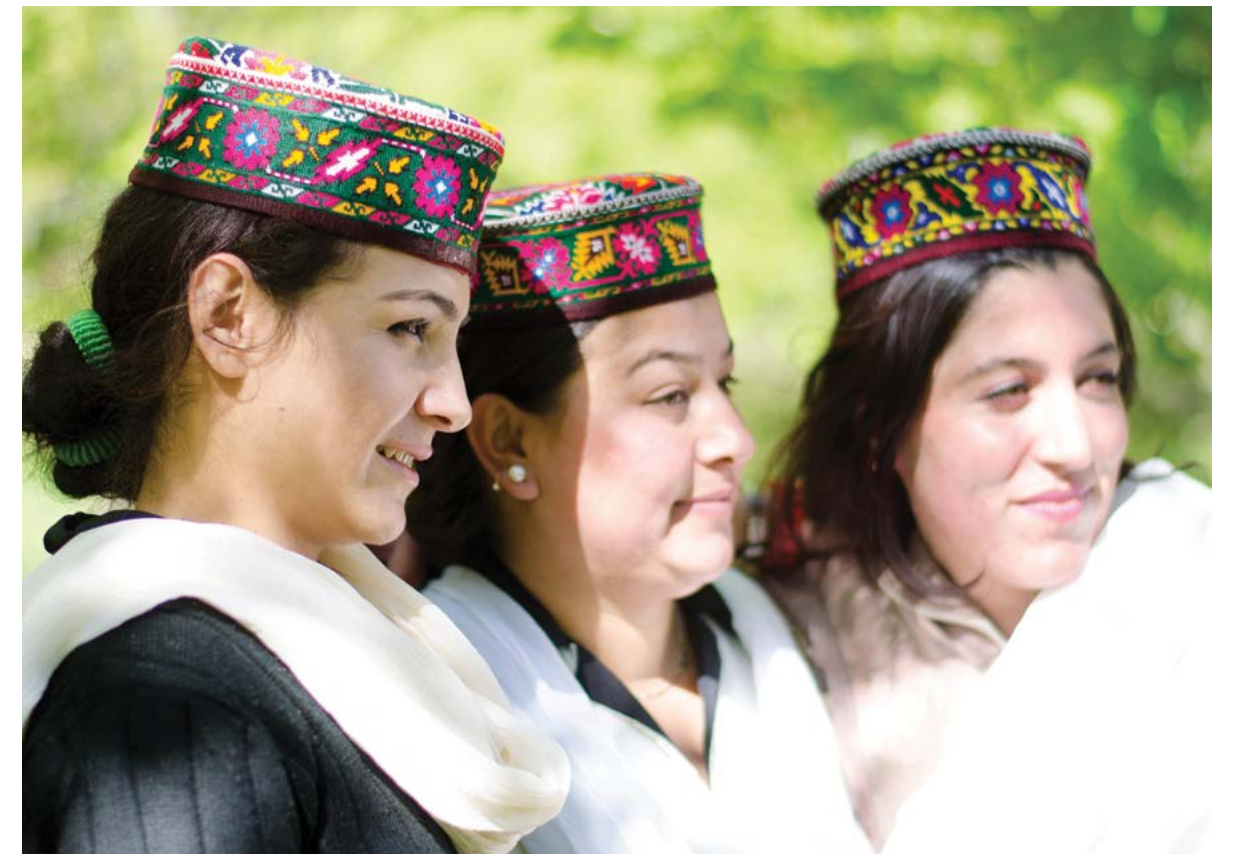
Nhiều phụ nữ Hunza 60 tuổi, nhưng nhìn thì chỉ giống như 40 tuổi...

Allen E. Banik, bác sĩ nhân khoa, cũng tiến hành kiểm tra thị lực của người Hunza, và ông chọn những người già nhất trong bộ tộc này. Kết quả đã làm ông vô cùng ngạc nhiên: đôi mắt của họ thật hoàn hảo. Điều này đã được ông đăng trong cuốn Hunza Land (Nhà xuất bản Whitehorn, 1960).