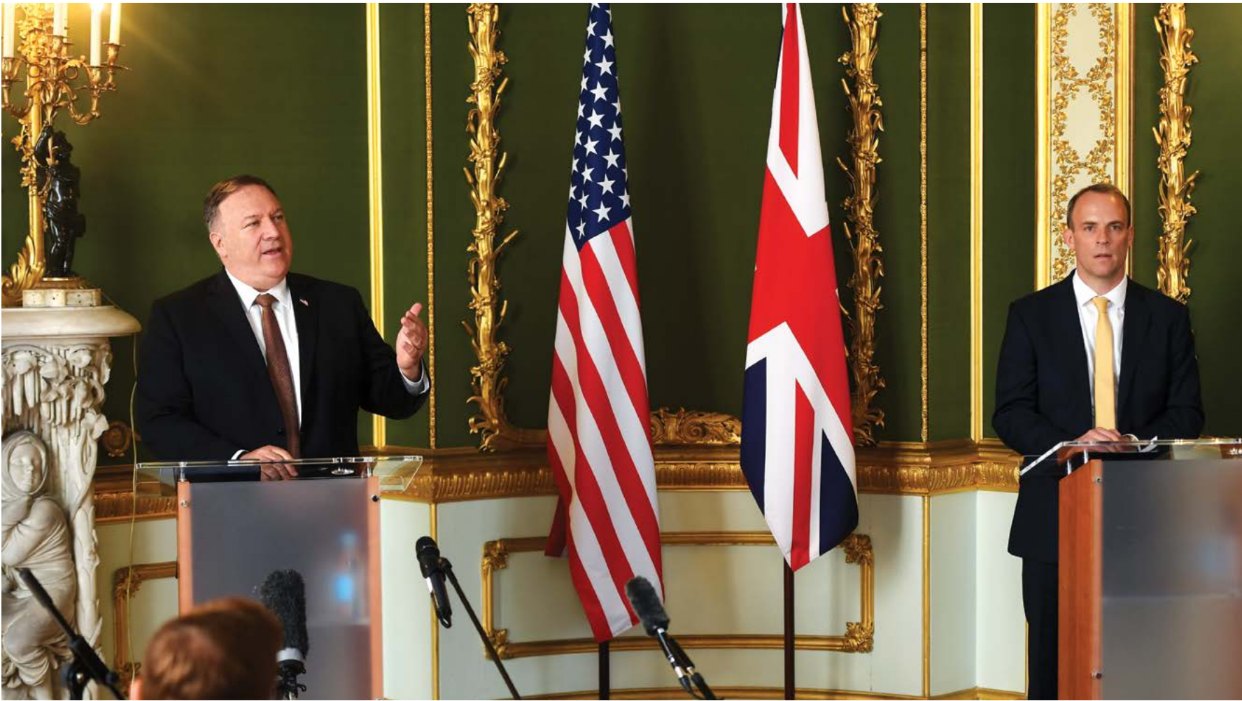
Ngoại trưởng Hoa Kỳ Mike Pompeo phát biểu trong cuộc họp báo chung với Ngoại trưởng Anh Dominic Raab tại Tòa nhà Lancaster, London, ngày 21/7/2020.