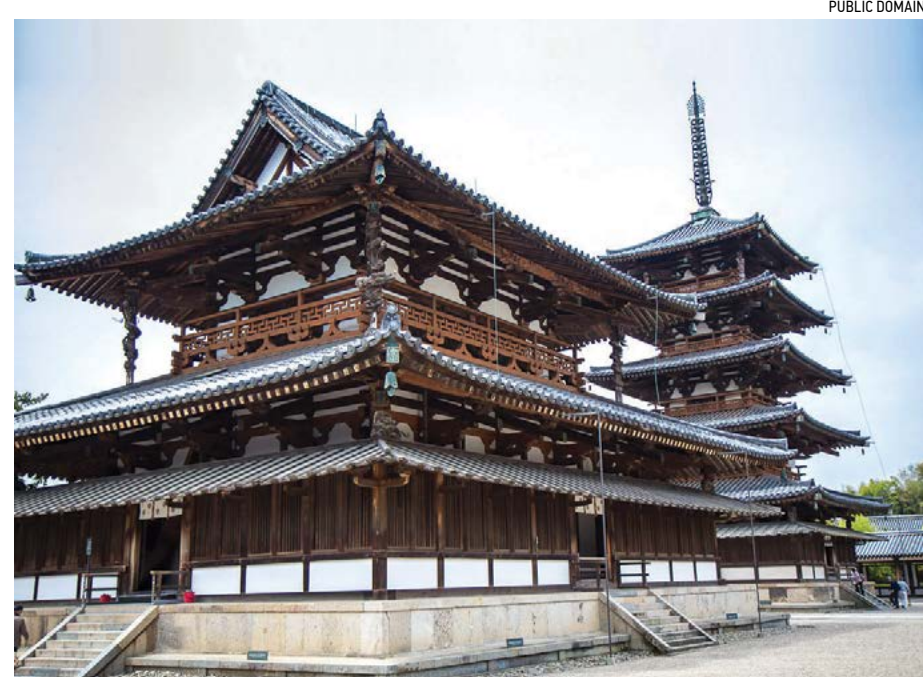
Đền Horyu-ji (trái) và chùa Horyu-ji (phải).