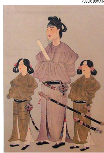
Thái tử Shotoku (574 - 622 SCN), nhiếp chính vương thế kỷ thứ bảy và hai người con trai của ông. Bản sao mộc bản từ một bức tranh thế kỷ thứ tám. Tranh mực và màu trên giấy. Bộ Sưu Tập Hoàng Gia.

cho phép phát triển văn hóa Nhật Bản. Việc gia nhập các tư tưởng Phật gia, nghệ thuật, và kiến trúc Trung Quốc cổ đại, tất cả được thể hiện rõ nét và hoàn hảo trong kiến trúc ngôi chùa Horyu-ji. Chính hoàng tử Shotoku, với tư cách là người trị vì đầu tiên của Nhật Bản khuyến khích phát triển Phật giáo, đã đặt làm ngôi chùa, và được biết đến như cha đẻ của Phật giáo Nhật Bản.