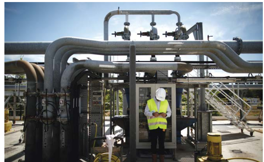
Nhà máy xử lý nước thải Marne Aval, được điều hành bởi Tổ chức vệ sinh liên ngành cho khu vực đô thị lớn hơn Paris (SIAAP), tại Noisy-le-Grand, gần Paris, Pháp, vào ngày 22 tháng 7 năm 2020.