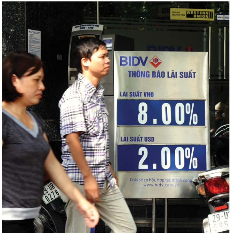
Người dân đi qua một bảng thông báo lãi suất của ngân hàng BIDV tại Hà Nội.

Có chuyên gia tài chính cho rằng, cứ nhìn qua các con số đưa ra như trên trong cáo trạng thì đây là các con số tự “ché biếm”. Có ai đó coi đây như là tiền không phải của nhân dân nên thích đưa ra con số nào cũng được.