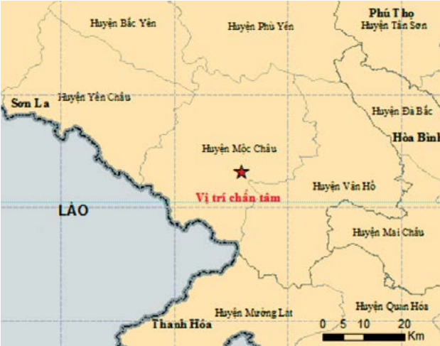
Vị trí xảy ra trận động đất 5,3 độ Richter trưa ngày 27/7 ở Sơn La.

Viện trường Vật lý địa cầu cho biết, tâm chấn ở xã Đông Sang, huyện Mộc Châu,