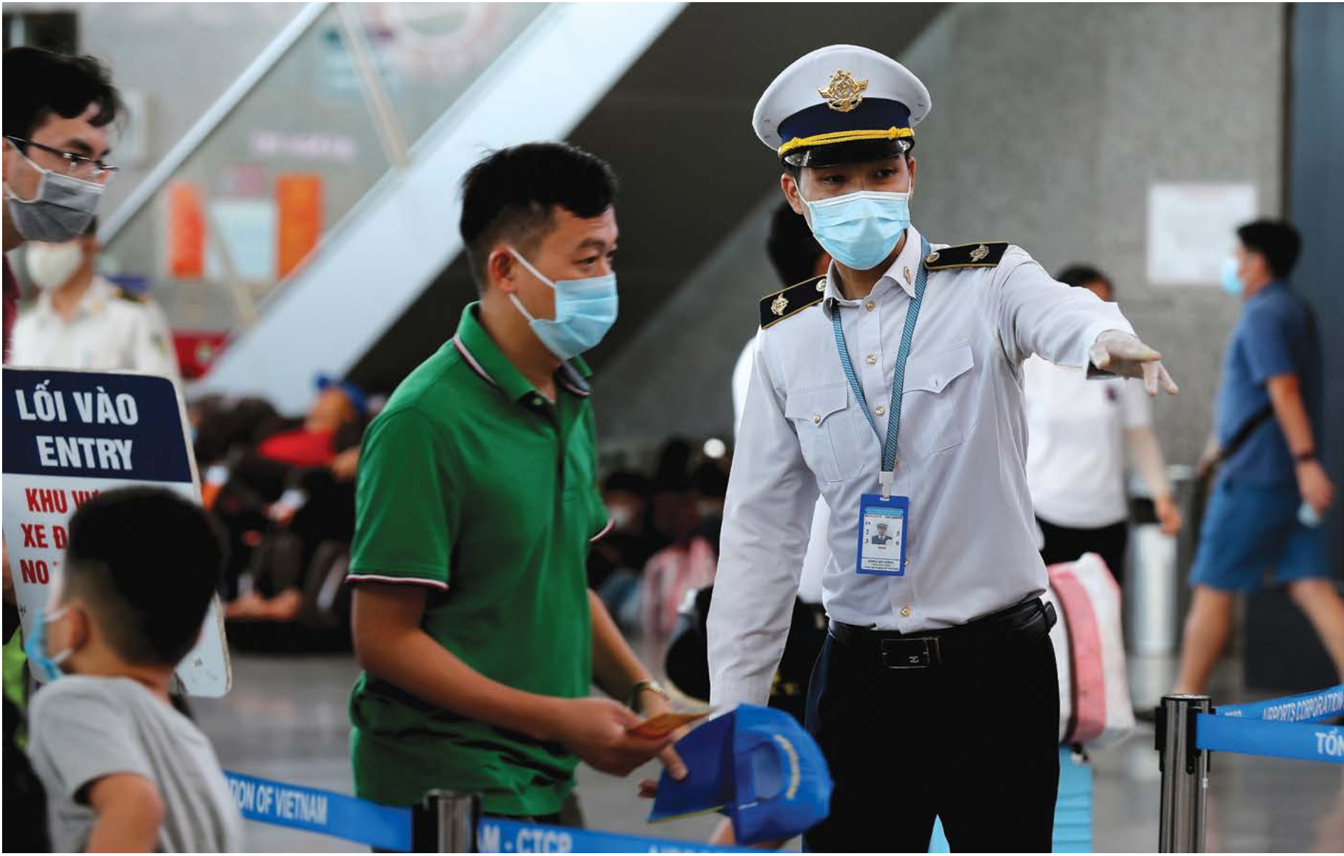
Nhân viên từ Trung tâm kiểm soát dịch bệnh của Việt Nam hỗ trợ hành khách đeo khẩu trang khi họ xếp hàng để kiểm tra nhiệt độ tại sân bay quốc tế Đà Nẵng vào ngày 27/7/2020.