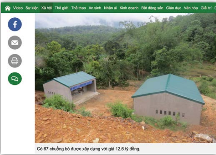
Truyền thông trong nước đưa tin về dự án “Biệt thự cho bò”. (Ảnh chụp màn hình báo Dân Trí)

Nhưng điều kỳ lạ hơn nữa bây giờ mới phát hiện ra, là 231 người được hưởng dự án “biệt thự cho bò” ở Bản Đưa, xã Lương Minh, Huyện Tương Dương, Nghệ A không có người dân tộc Ô Đu nào!!