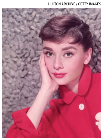
Chân dung Audrey Hepburn năm 1955.

Nữ diễn viên gốc Bỉ Audrey Hepburn năm 1954, trong bức hình quảng cáo cho bộ phim của đạo diễn Billy Wilder, Sabrina .