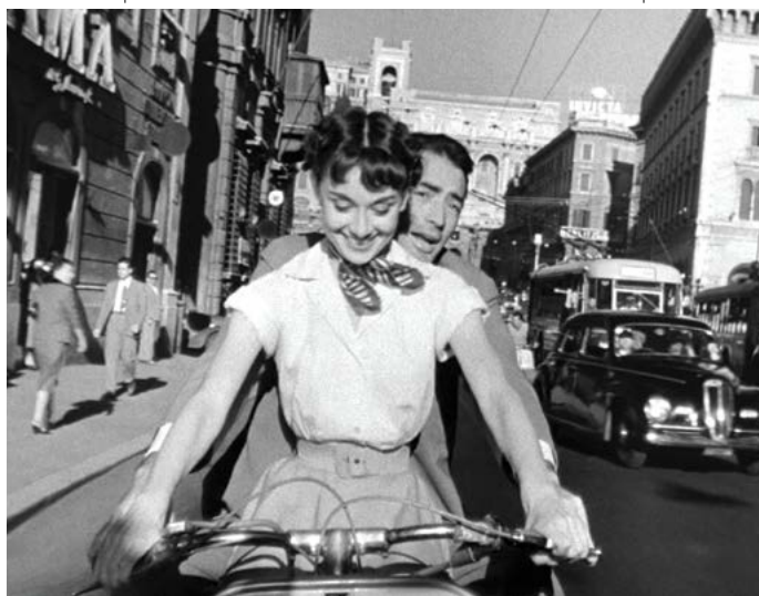
Audrey Hepburn cùng Gregory Peck trong một cảnh quay của bộ phim Roman Holiday (1953)