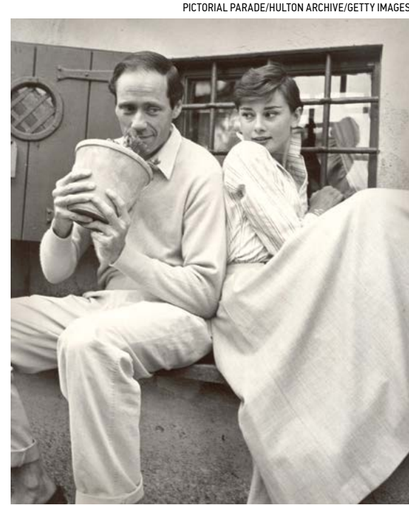
Audrey Hepburn và người chồng đầu tiên Mel Ferrer tại Ý, 1956.

Một thời gian ngắn sau khi bà Audrey hoàn thành rất nhiều chuyến