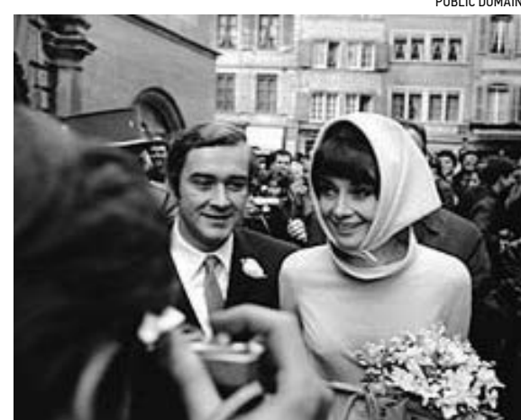
Audrey Hepburn và người chồng thứ hai Andrea Dottì trong đám cưới năm 1969 của họ.