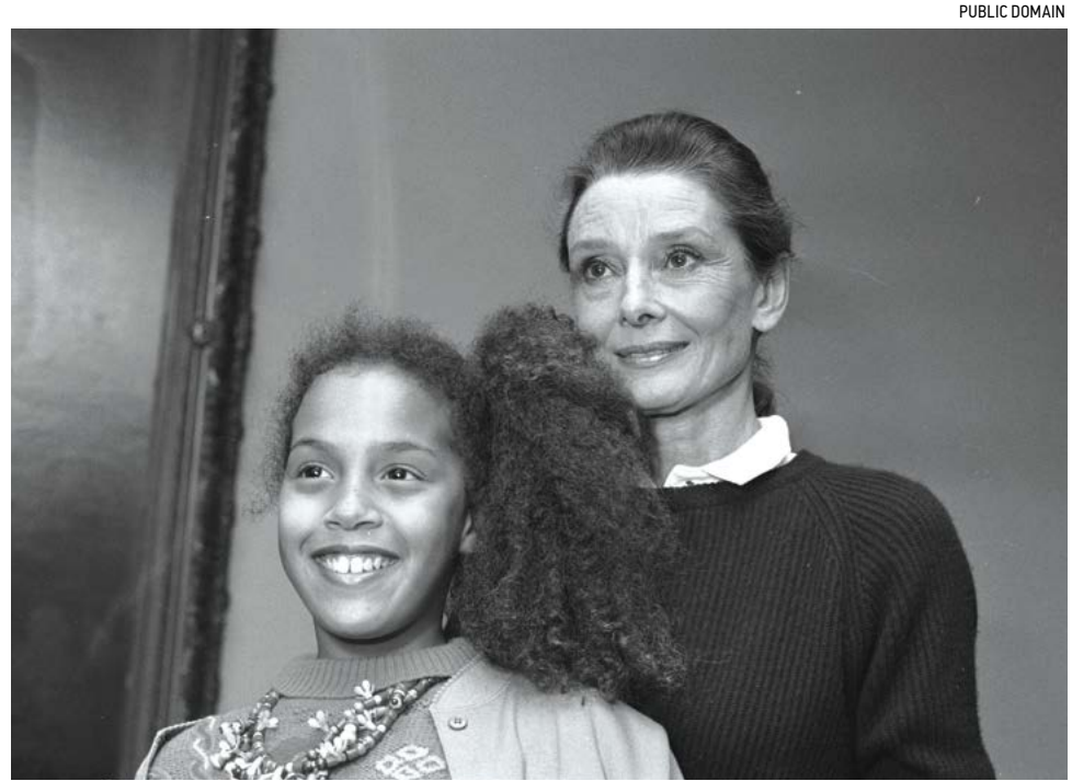
Audrey Hepburn nhận giải Danny Kaye quốc tế dành cho trẻ em của UNICEF năm 1989.

công du vào năm 1992, với cơ thể ngày càng yếu ớt, nhưng Audrey vẫn quyết thực hiện một chuyến công du cuối cùng... Bà gặp một cô bé xinh đẹp khoảng 5 đến 6 tuổi đang xếp hàng trong số 600 trẻ mồ côi. Bà Audrey ngồi xuống để vừa với tầm nhìn của cô bé. Cô bé với ánh mắt toát lên vẻ rụt rè, bước một bước về phía trước, rồi lùi lại, do dự. Đột nhiên, cô bé lao mình vào vòng tay của bà Audrey và ôm bà. Cái ôm này khiến tất cả sự xót thương trong tim bà với thảm kịch ở Somalia trôi dạt, một cách sâu sắc, và cả sự trân trọng về số phận của chính bà.