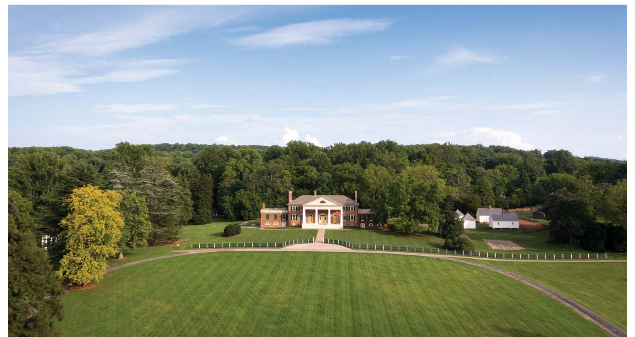
Đất đai trù phú của Montpelier.