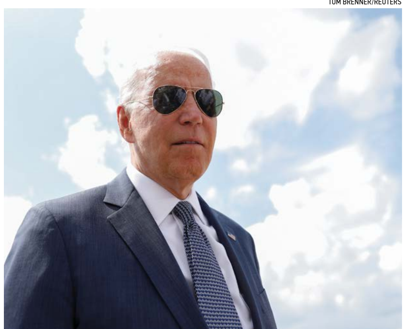
TT Joe Biden bước lên chuyên cơ Air Force One tại Căn cứ Liên hợp Andrews ở Maryland, hôm 09/07/2021.

được sử dụng cho “các chương trình can thiệp bạo lực cộng đồng dựa trên các bằng chứng, vấn đề công an việc làm vào mùa hè và các cơ hội giáo dục, cùng các khoản đầu tư khác mà chúng tôi biết là sẽ giảm thiểu tội phạm và làm cho các khu vực lân cận của chúng ta an toàn hơn,” bản ghi nhớ viết.