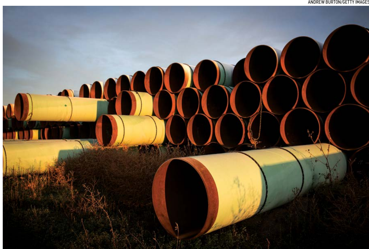
Hàng dặm dài ống chừa sử dụng, được chuẩn bị cho dự án đường ống Keystone XL ở bên ngoài Gascayne, North Dakota, ngày 14/10/2014.