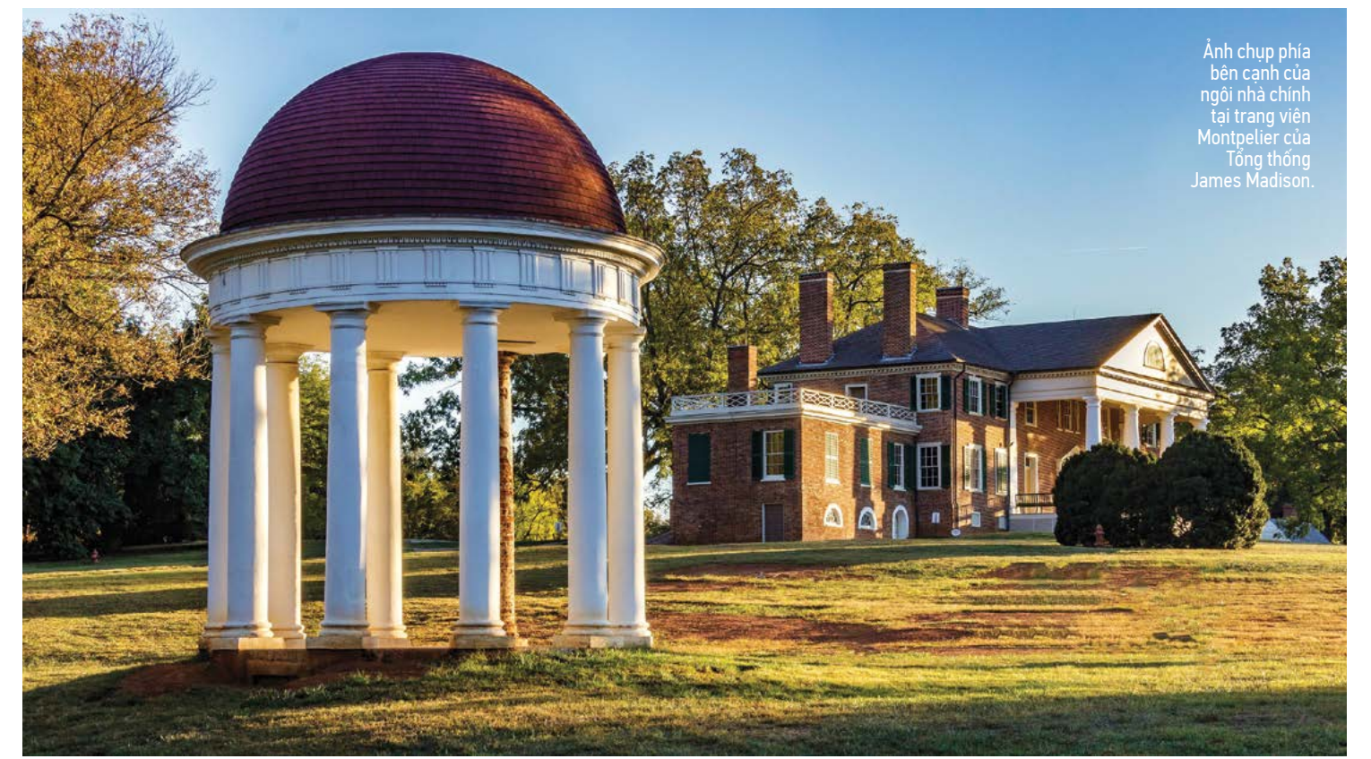
Ảnh chụp phía bên cạnh của ngôi nhà chính tại trang viên Montpelier của Tổng thống James Madison.

Triển lãm này được đặt tên theo một câu nói nổi tiếng năm 1787 của Tổng thống Madison trong Đại hội Liên bang (Federal Convention) vốn đã phác thảo nên Hiến pháp Hoa Kỳ và cho thấy hoàn cảnh trở trêu của một chủ nô, người đã tranh luận chống lại chế độ nô lệ: “Chúng ta đã chứng kiến sự biệt đãi đơn thuần của màu da được thực hiện trong thời kỳ khai sáng nhất, là cơ sở cho một nền thống trị áp bức nhất từng được thực hiện bởi con người lên con người.”