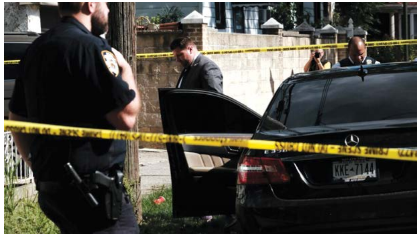
Cảnh sát điều tra hiện trường một vụ xả súng ở Brooklyn, thành phố New York hôm 23/04/2021.

Bà viết trong một email, “Các đối tượng phạm tội là khi họ có ý muốn, có mục tiêu, và nơi đó vắng mặt người canh gác. Sau những lời lẽ chống cảnh sát tràn lan khắp đất nước trong năm qua, nhiều sĩ quan đã về hưu hoặc từ bỏ chức vụ và nhiều người ở lại bị làm cho nản lòng bởi những hành động chống cảnh sát khác nhau, như hành động loại bỏ quyền miễn trừ dù tiêu chuẩn, hoặc các ràng buộc nghiêm trọng về khả năng sử dụng vũ lực có lý do chính đáng của họ.”