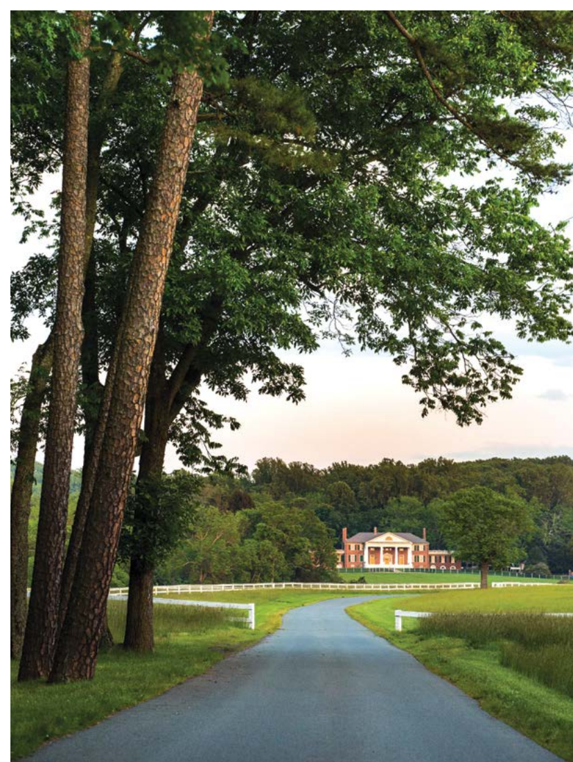
Con đường dẫn vào khuôn viên khu lịch sử Montpelier.