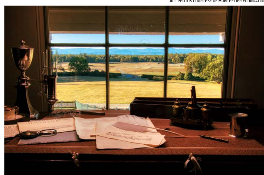
Quang cảnh thôn dã từ bàn làm việc trong gian nhà chính tại Montpelier, trang viên của Tổng thống James Madison.