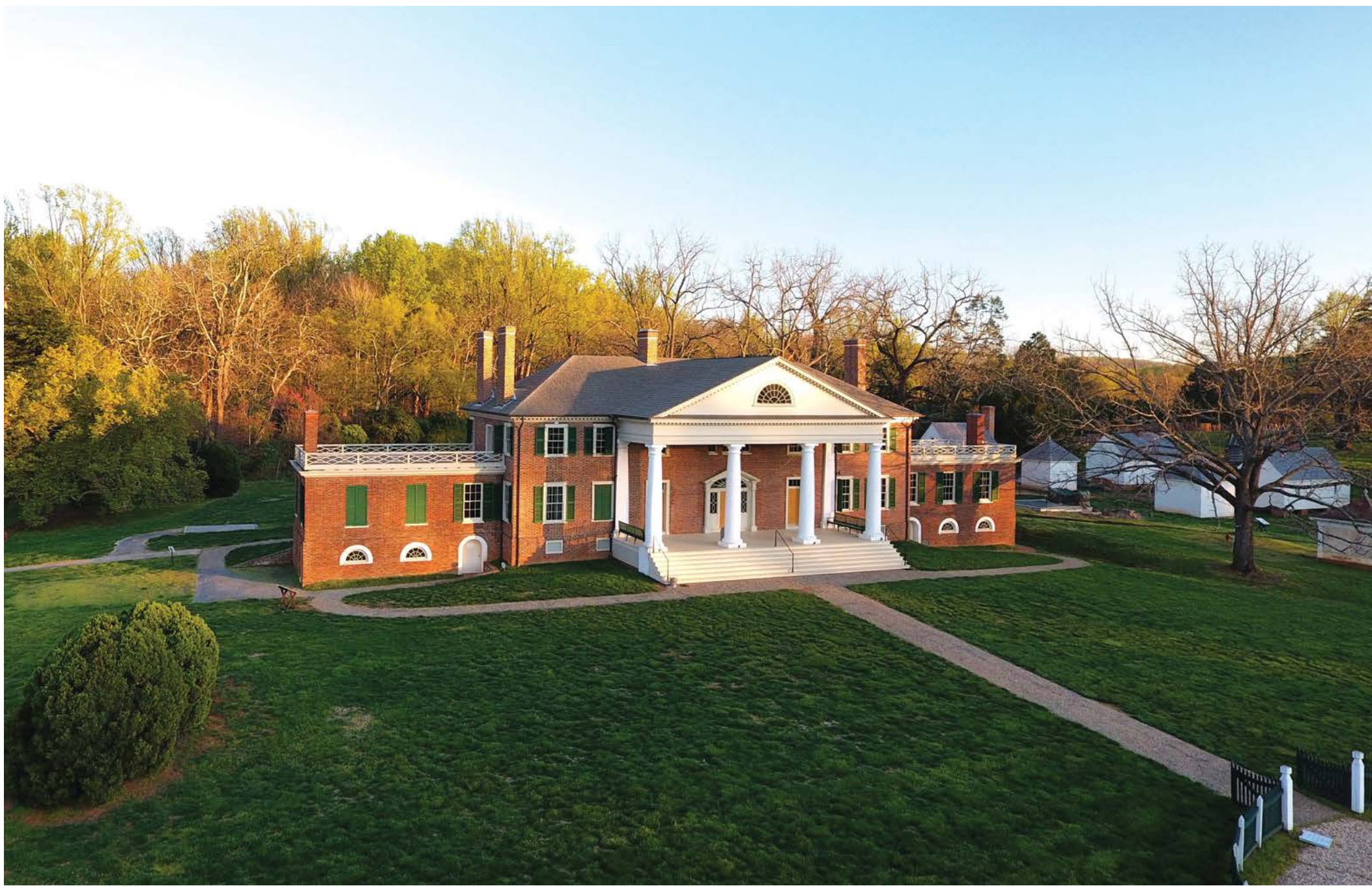
Quang cảnh nhìn từ trên cao của gian nhà chính tại trang viên Montpelier của ngài James Madison, một vị Tổ phụ Lập quốc, tác giả chính của Hiến pháp Hoa Kỳ và là Tổng thống thứ tư của Hoa Kỳ.