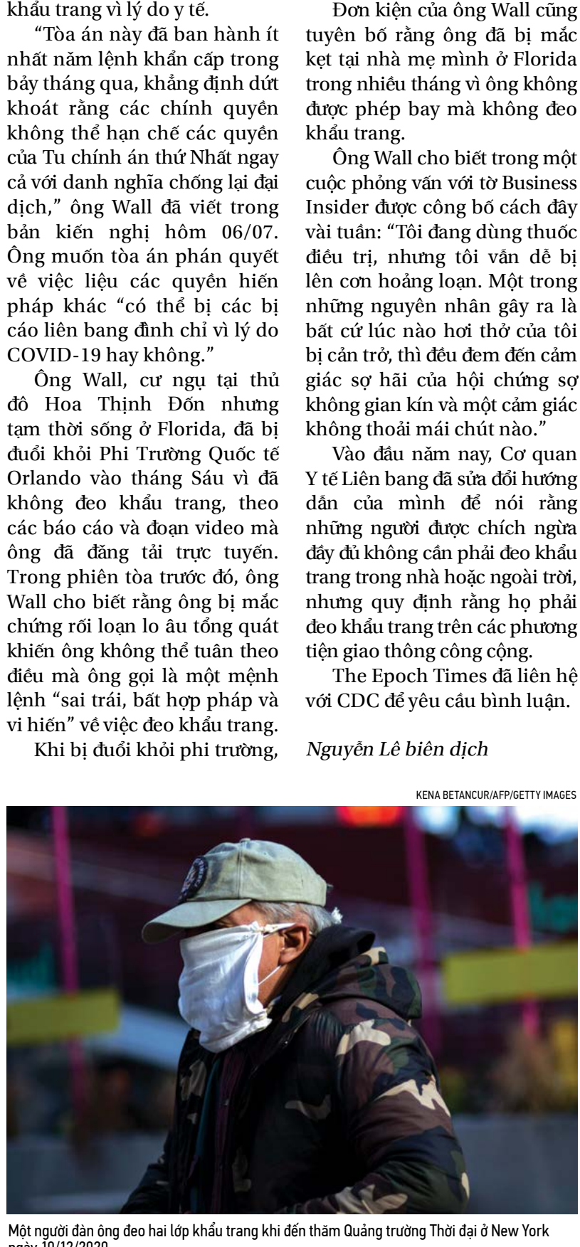
Một người đàn ông đeo hai lớp khẩu trang khi đến thăm Quảng trường Thời đại ở New York ngày 10/12/2020.

ông Wall nói với các nhân viên Cục An ninh Văn tài rằng, “Tôi từ chối tuân thủ điều này,” từ Washington Examiner đưa tin, trích dẫn video của ông.