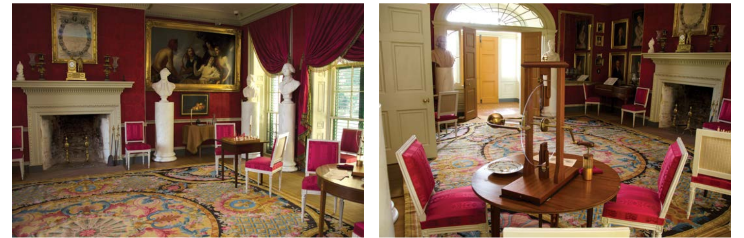
Nội thất xa hoa tại Montpelier.