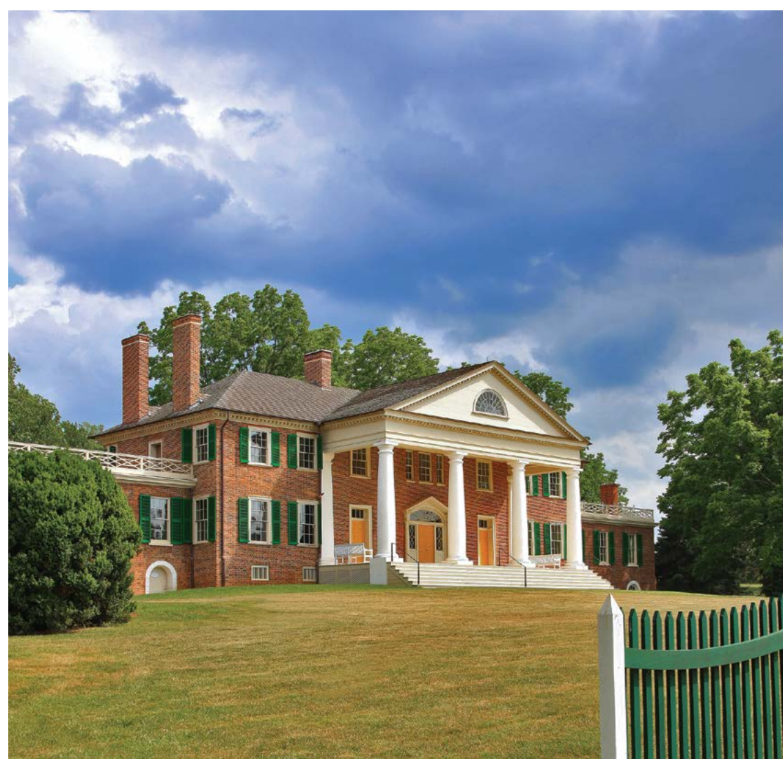
Ngôi nhà chính ở Montpelier.