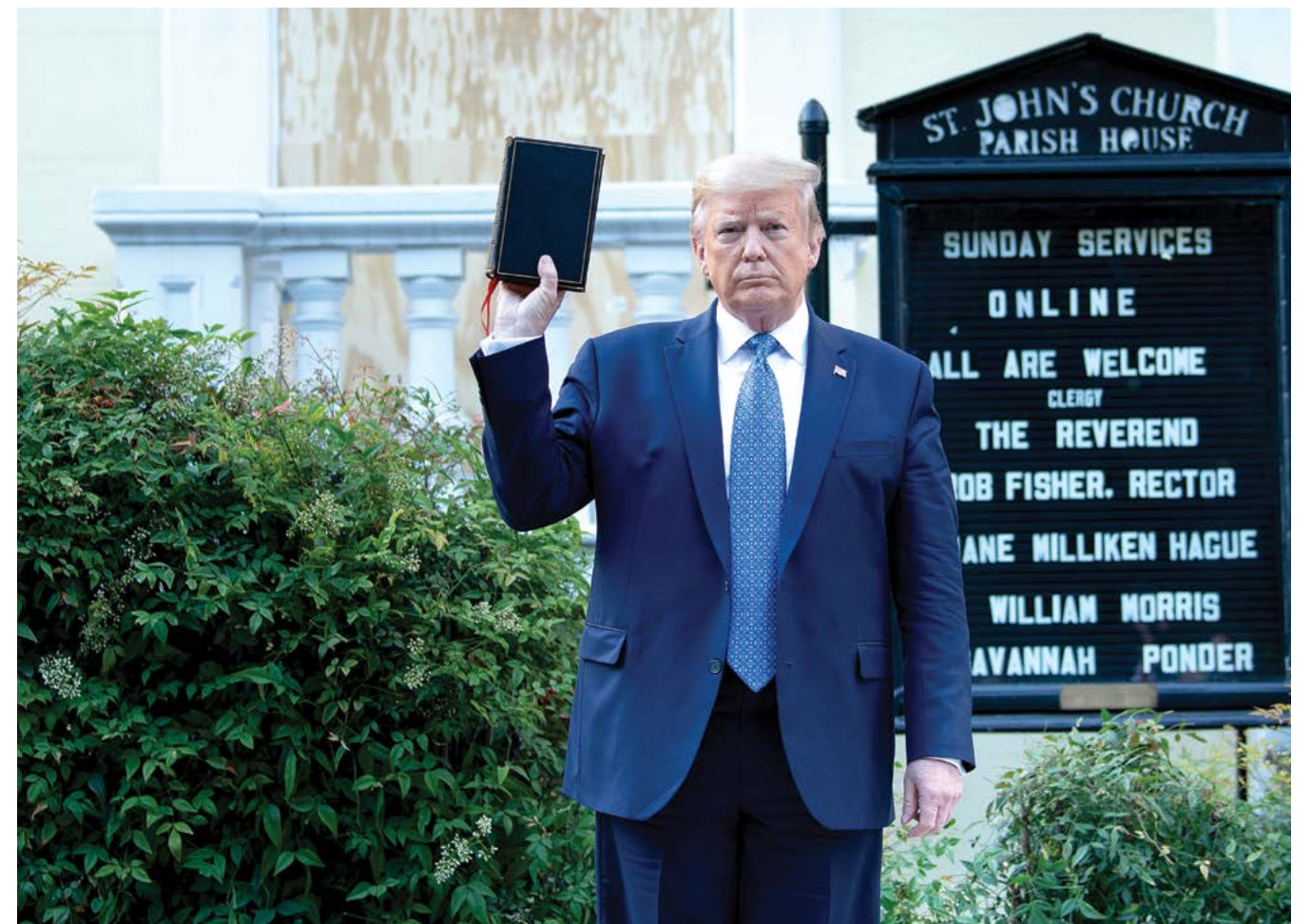
Tổng thống Donald Trump cầm trên tay cuốn Kinh Thánh khi đến thăm Nhà thờ St. John, đối diện Tòa Bạch Ốc ở Washington D.C. vào ngày 1/6/2020.

Chúng ta cũng sẽ phát hiện ra những kẻ bạo loạn trong những ngày gần đây do ai xúi giục, họ thấy rằng virus chắc chắn sẽ mờ nhạt và những cảnh báo xã hội về đại dịch sẽ lắng