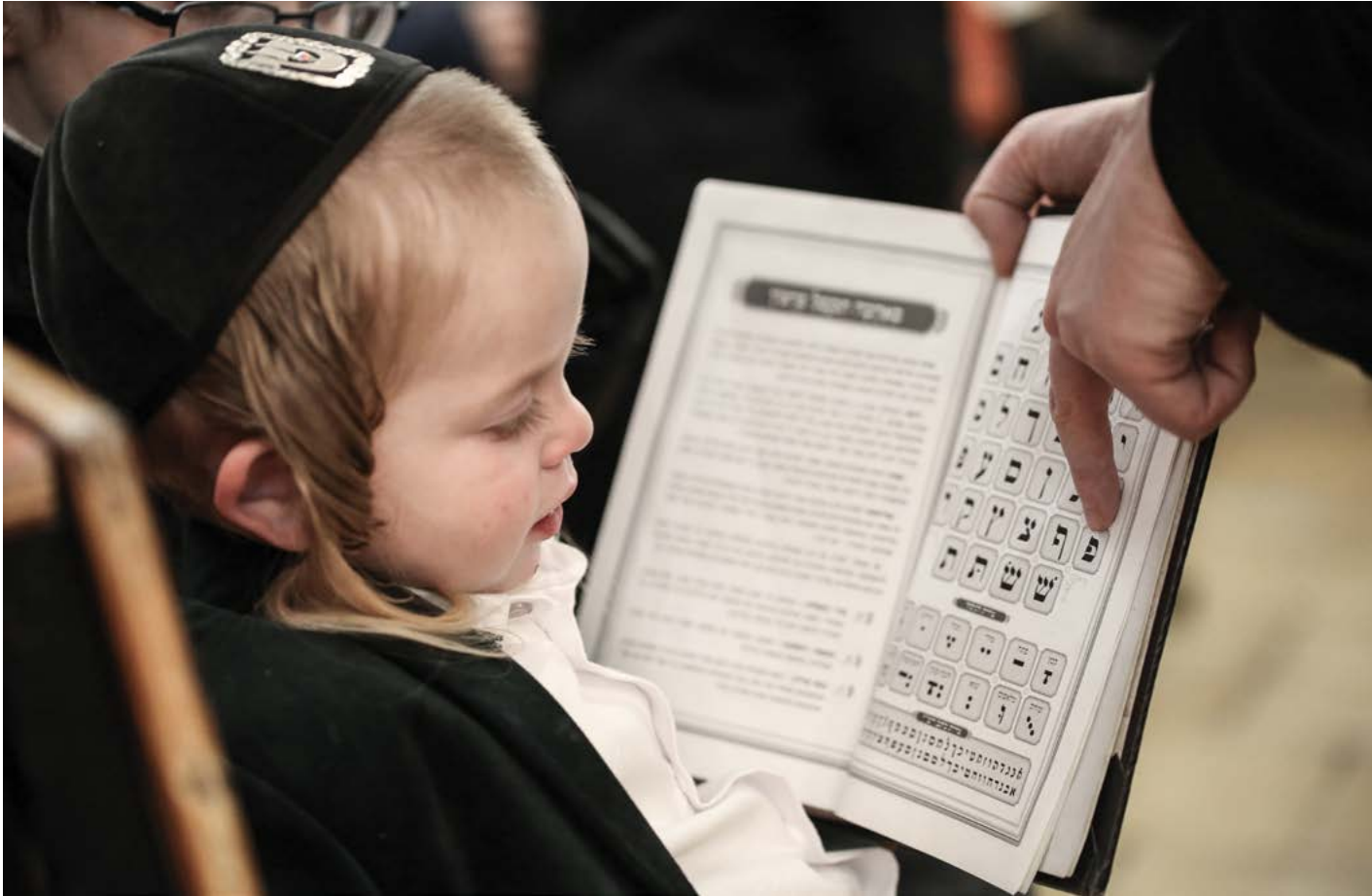
Một trẻ em người Do Thái đang học chữ cái.