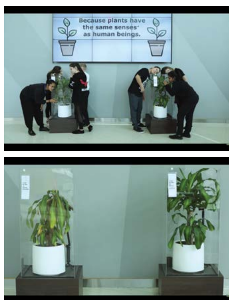
Thí nghiệm kỳ lạ cho thấy sự tác động của ngôn ngữ lên hai cái cây.

Họ kêu gọi học sinh, sinh viên của ngôi trường này tới đọ nạt,