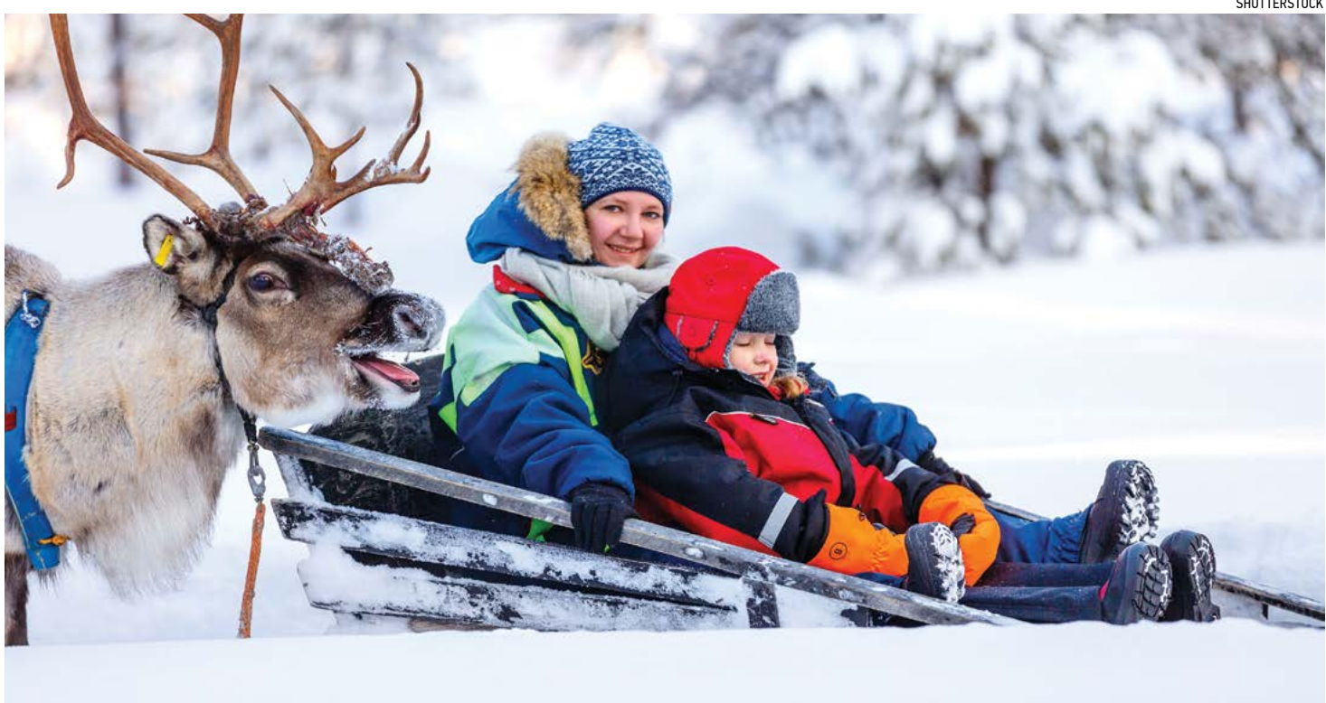
Lapland, Phần Lan, nơi được mệnh danh là "quê hương của ông già Noel".