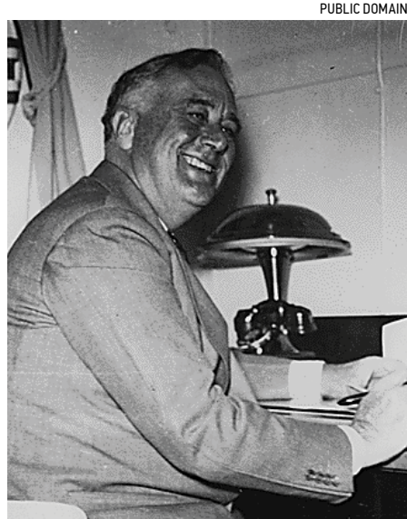
Franklin D. Roosevelt.

Có một lần, nhà soạn kịch người Anh gốc Ireland (người đã đạt giải Nobel Văn học năm 1925) - ông George Bernard Shaw đang đi dạo trên phố bị một chiếc xe đụng phải ngã xuống đất, may là không có gì đáng ngại. Người gây tai nạn vội vàng đỡ ông dậy và liên tục xin lỗi. Ông phũ phũ bực và hài hước nói: "Anh bạn không vội rồi, nếu anh đụng chết tôi thì có thể nổi tiếng khắp