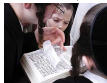
Trong các gia đình Do Thái, trẻ ngay từ lúc còn nhỏ đã bắt đầu đọc thuộc lòng Kinh Do Thái như "Kinh Moses", "Kinh Cựu Ước", v.v..