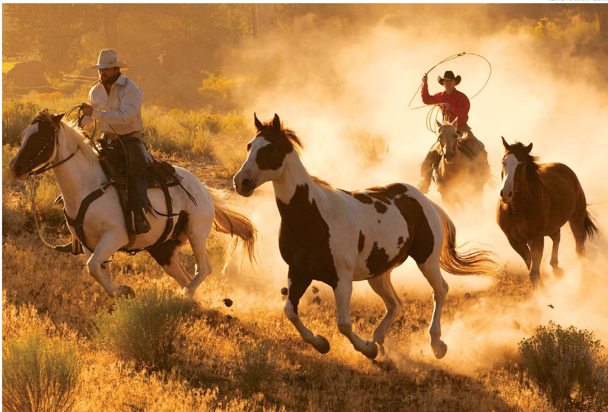
Jim Owen, tác giả của cuốn "Đạo đức cao bồi" đã chỉ ra những điều cơ bản làm nền tảng cho quy tắc cư xử ở phương Tây cổ. Họ chỉ đơn giản là làm việc chăm chỉ, biết đúng sai và tuân theo Quy tắc Vàng.