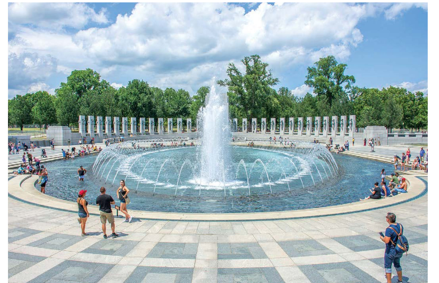
MUSIKANMAL CC BY-SA 4.0