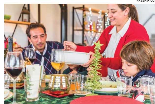
Người Pháp không nấu thức ăn riêng cho trẻ con cả ở nhà, ở ngoài, cũng như ở các trường học. Mọi thành viên trong gia đình bao gồm cả các em nhỏ đều ăn cùng một loại thức ăn.

Khi cùng cha mẹ dùng bữa bên ngoài hay tại gia đình người thân, các em đều rất thanh lịch, ứng xử lễ phép, biết cách sử dụng mọi đồ dùng trên bàn thuần thục.