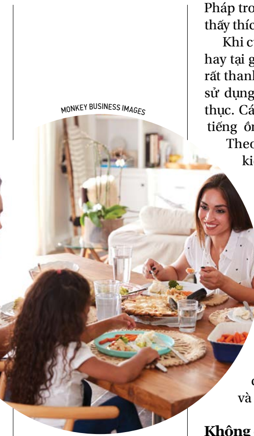
Người Pháp không nấu thức ăn riêng cho trẻ con cả ở nhà, ở ngoài, cũng như ở các trường học. Mọi thành viên trong gia đình bao gồm cả các em nhỏ đều ăn cùng một loại thức ăn. (Minh họa)

Bàn ăn của người Pháp luôn được trải khăn và trang trí như những bữa tiệc thịnh soạn. Mọi đồ dùng trên bàn có thể không cùng bộ nhưng luôn được bày trí theo những nguyên tắc nhất định. Sự cầu kỳ và tinh tế vốn có của người Pháp trong bữa ăn đã tạo cho các em ý thức nghiêm trang trong bữa ăn, và cảm giác mình cũng là một thành viên được coi trọng như những người lớn khác. Karen chia sẻ, hai con của cô rất thích thú với những bữa ăn được bày biện kiểu Pháp. Trên bàn ăn có những chiếc đĩa xinh xắn, khăn ăn, hoa và nến. Sự cầu kỳ và tinh tế của người