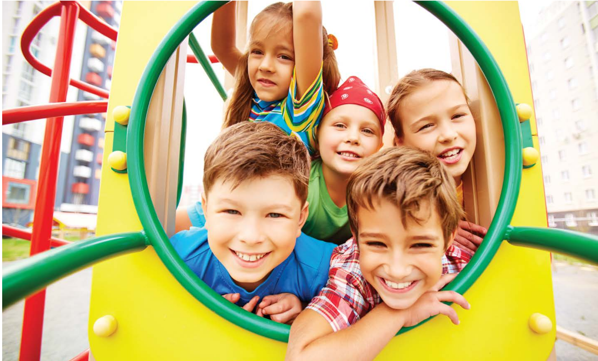
Trẻ em học được nhiều từ các hoạt động hơn là từ các khoảng thời gian trống vui chơi xen kẽ?