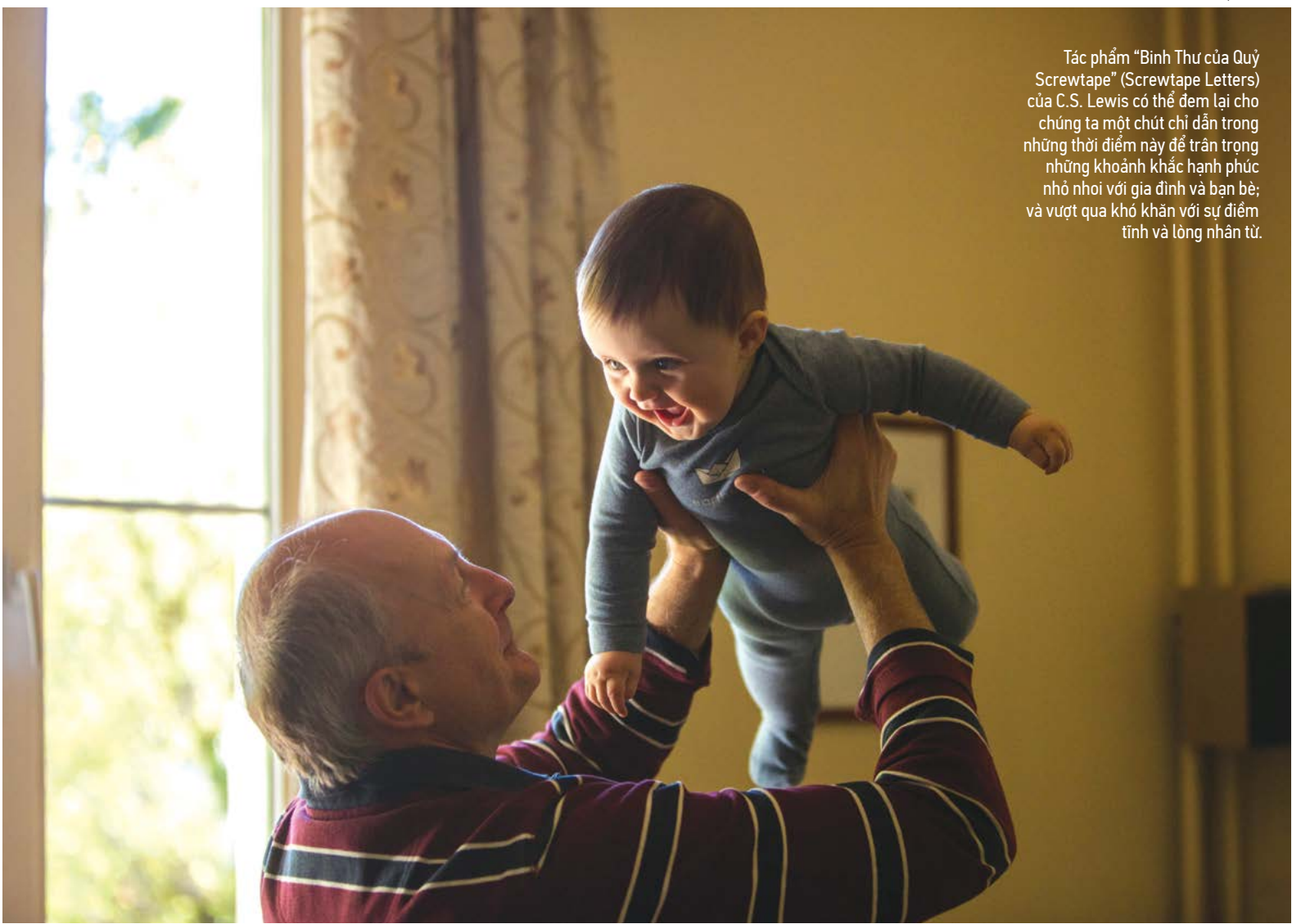
Tác phẩm "Bình Thư của Quý Screwtape" (Screwtape Letters) của C.S. Lewis có thể đem lại cho chúng ta một chút chỉ dẫn trong những thời điểm này để tránh trong những khoảnh khắc hạnh phúc như nhồi với gia đình và bạn bè, và vượt qua khó khăn với sự điềm tĩnh và lòng nhân từ.