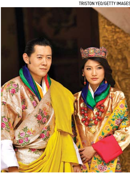
Quốc vương Jigme Khesar Namgyel Wangchuck và Hoàng hậu Jetsun Pema của Vương quốc Bhutan.

“Khi chúng tôi hiểu rằng tiền bạc và tài sản vật chất không thể chuyển hóa thành những gì bạn thực sự muốn trong cuộc đời... như sự bình yên trong tâm trí và hạnh phúc... Vậy thì tại sao chúng tôi phải đặt nó làm mục tiêu sống của mình?”