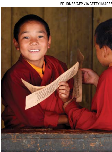
Hơn 2/3 người dân Bhutan theo đạo Phật. Người dân nơi đây vẫn giữ gìn được nét văn hóa Phật giáo Himalaya truyền thống còn sót lại trên thế giới.