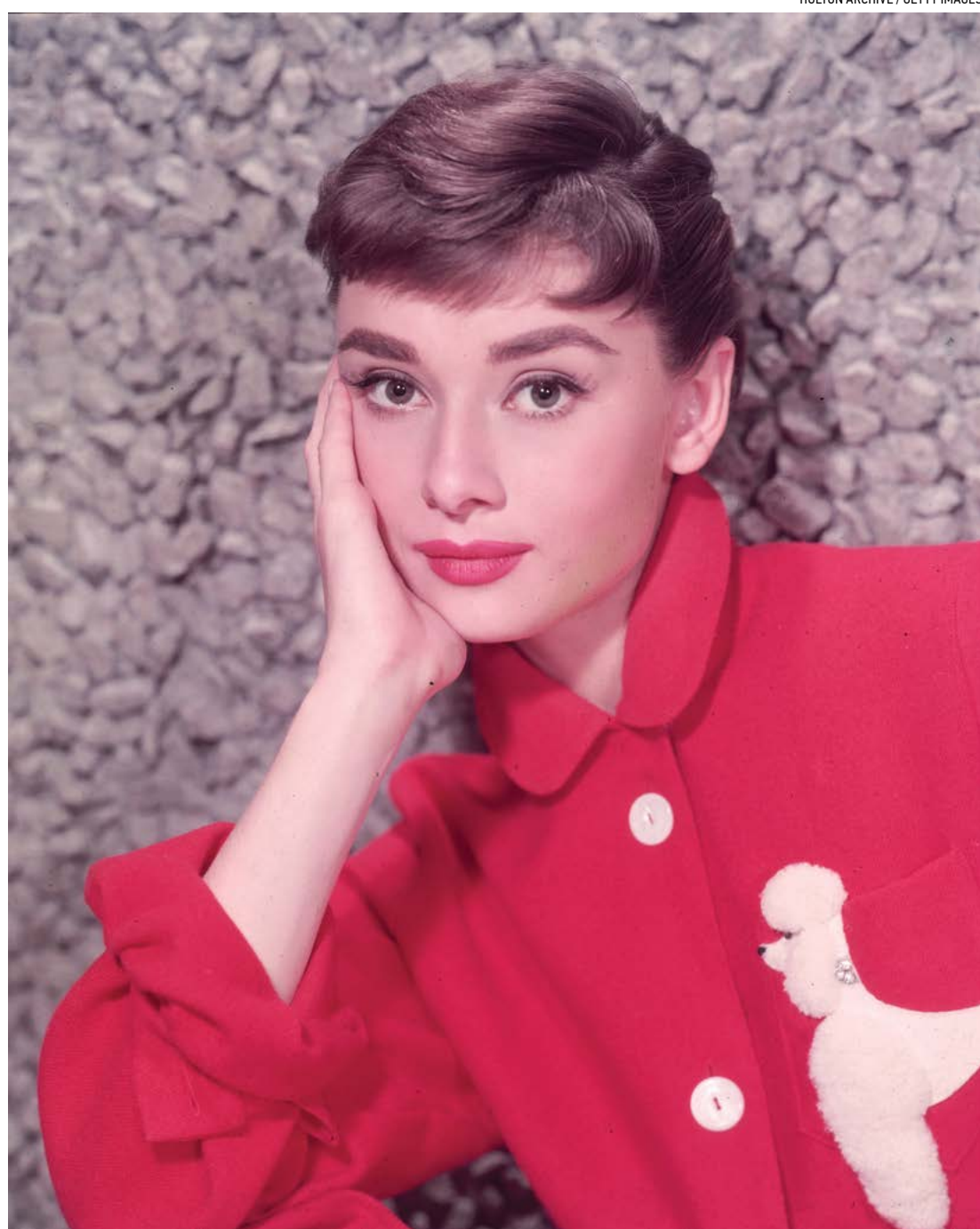
Chân dung Audrey Hepburn năm 1955.