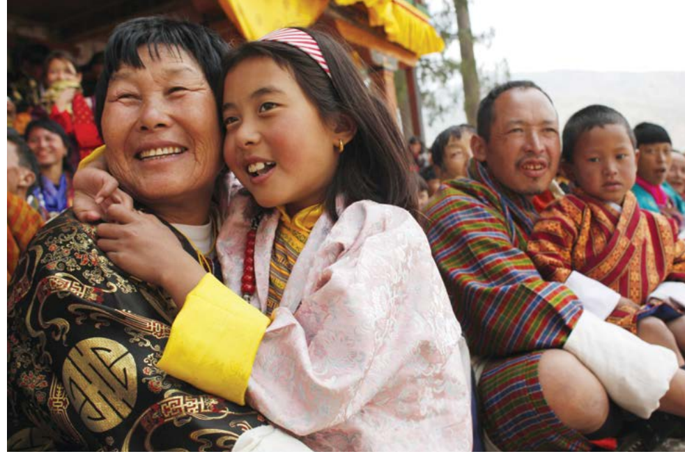
Khoảng cách giữa các tầng lớp trong xã hội không quá cách biệt. Người dân Bhutan rất thân thiện; một hoàng tử có thể chơi bóng với trẻ em mà không có sự phân biệt.