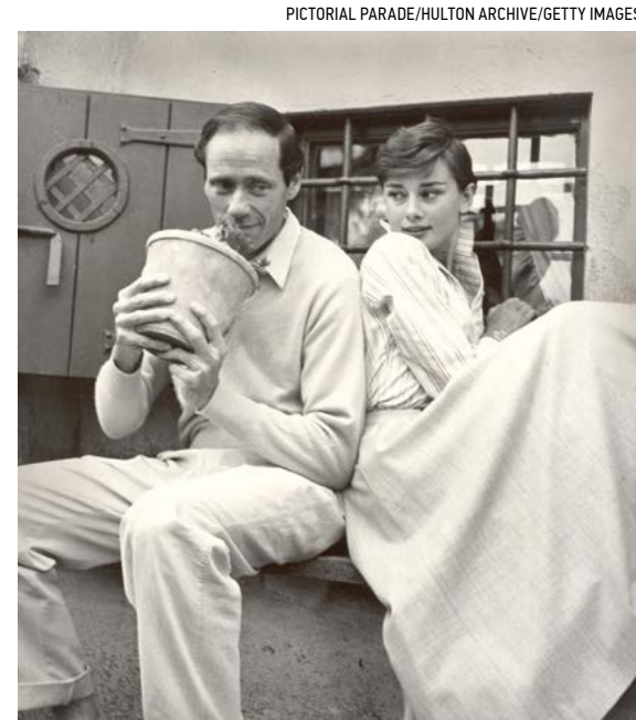
Audrey Hepburn và người chồng đầu tiên Mel Ferrer tại Ý, 1956.

Một thời gian ngắn sau khi bà Audrey hoàn thành rất nhiều chuyến công du vào năm 1992, với cơ thể ngày càng yếu ớt, nhưng Audrey vẫn quyết thực hiện một chuyến công du cuối cùng... Bà gặp một cô bé xinh đẹp khoảng 5 đến 6 tuổi đang xếp hàng trong số 600 trẻ mồ côi. Bà