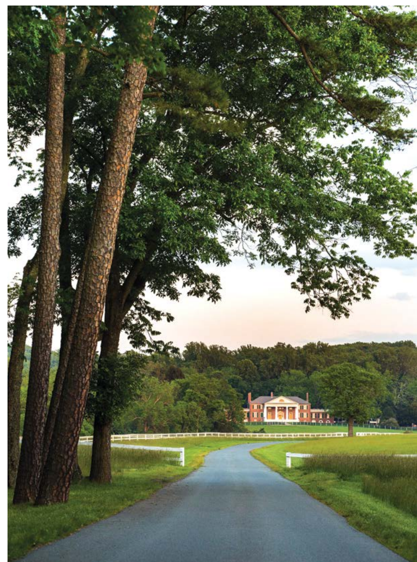
Con đường dẫn vào khuôn viên khu lịch sử Montpelier.