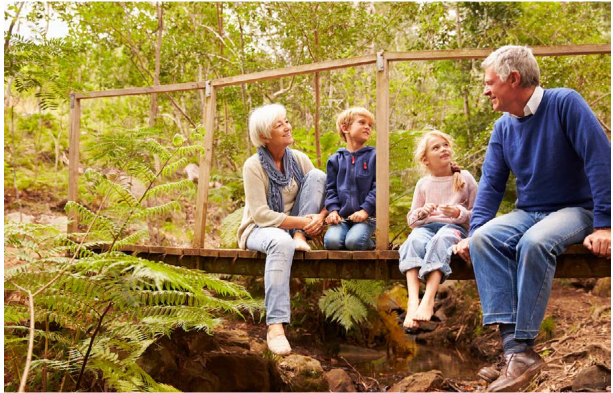
Làm thế nào chúng ta có thể khắc ghi những dấu ấn của bản thân trong người khác để truyền cảm hứng và dẫn dắt họ?

Theo tôi, có ba yếu tố quan trọng: thái độ, sự hiện diện, và nỗ lực là đáp án cho