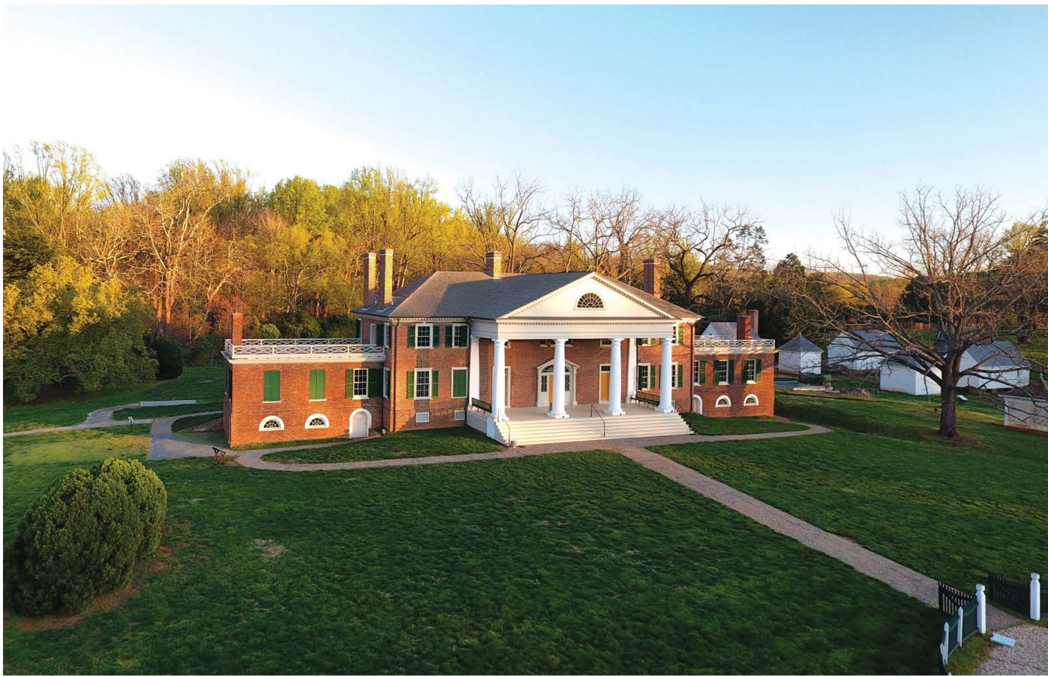
Quang cảnh nhìn từ trên cao của gian nhà chính tại trang viên Montpelier của ngài James Madison, một vị Tổ phụ Lập quốc, tác giả chính của Hiến pháp Hoa Kỳ và là Tổng thống thứ tư của Hoa Kỳ.