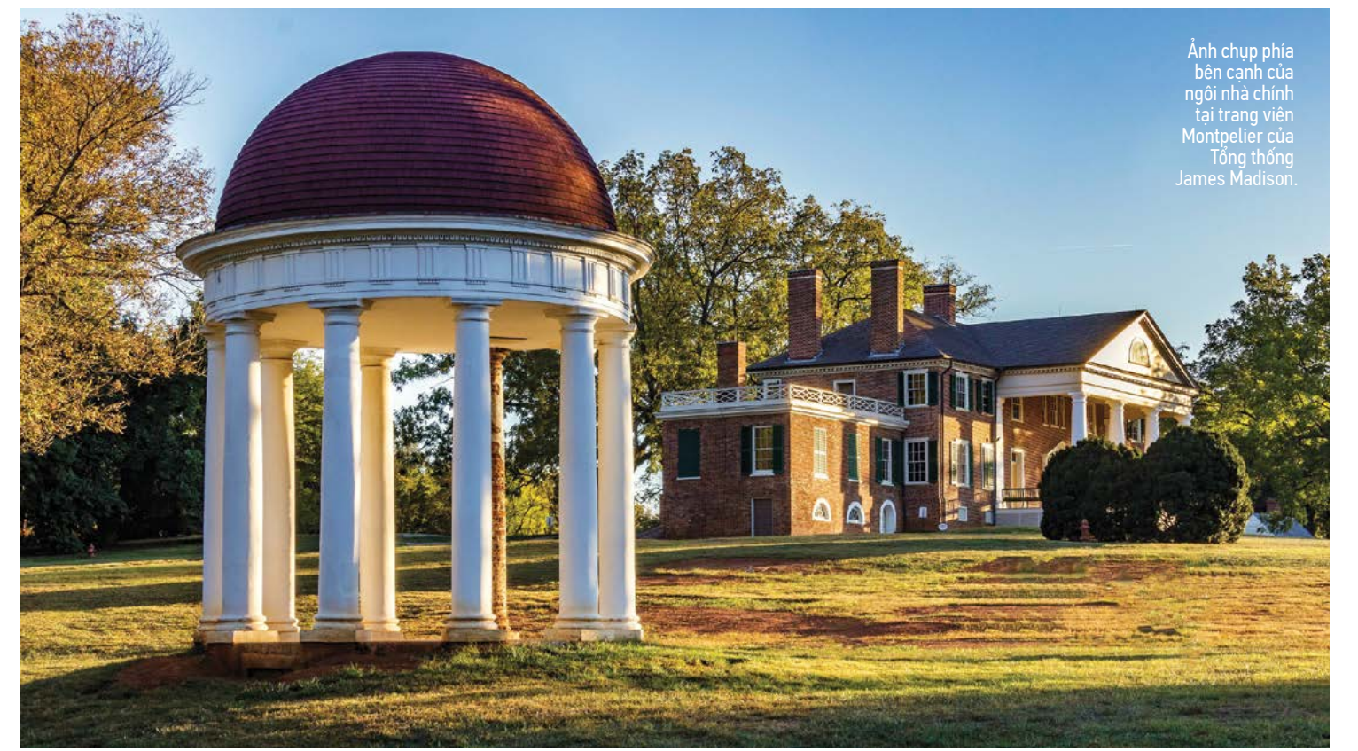
Ảnh chụp phía bên cạnh của ngôi nhà chính tại trang viên Montpelier của Tổng thống James Madison.

Triển lãm này được đặt tên theo một câu nói nổi tiếng năm 1787 của Tổng thống Madison trong Đại hội Liên bang (Federal Convention) vốn đã phác thảo nên Hiến pháp Hoa Kỳ và cho thấy hoàn cảnh trở trêu của một chủ nô, người đã tranh luận chống lại chế độ nô lệ: “Chúng ta đã chứng kiến sự biệt đãi đơn thuần của màu da được thực hiện trong thời kỳ khai sáng nhất, là cơ sở cho một nền thống trị áp bức nhất từng được thực hiện bởi con người lên con người.”