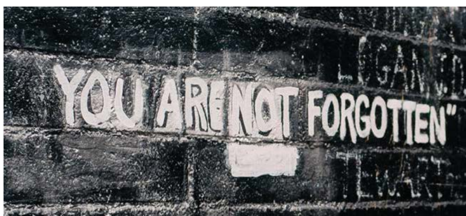
Một bức ảnh trích từ bộ phim tài liệu "Bastards' Road".