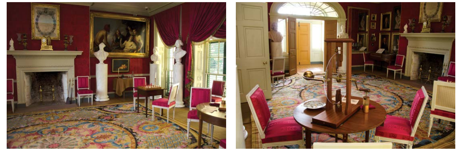
Nội thất xa hoa tại Montpelier.