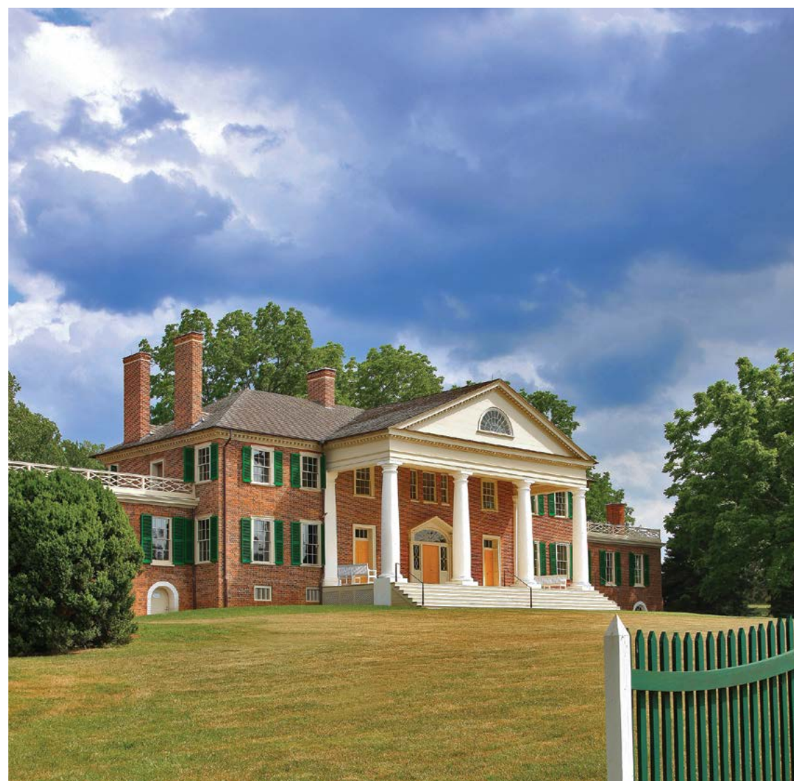
Ngôi nhà chính ở Montpelier.