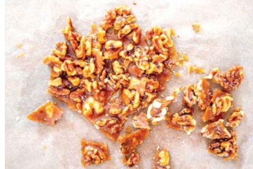
Để nướng hạt walnut có độ giòn tốt ưu, hãy làm chúng trước, sau đó để nguội hẳn mới cho vào salad.

Cho tất cả vào chén và khuấy đều cho tan.