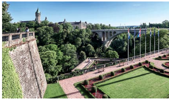
Từ thị trấn Thượng có thể khám phá cầu Adolphe bắc qua thung lũng Pétrusse xanh tươi dẫn đến khu ga.