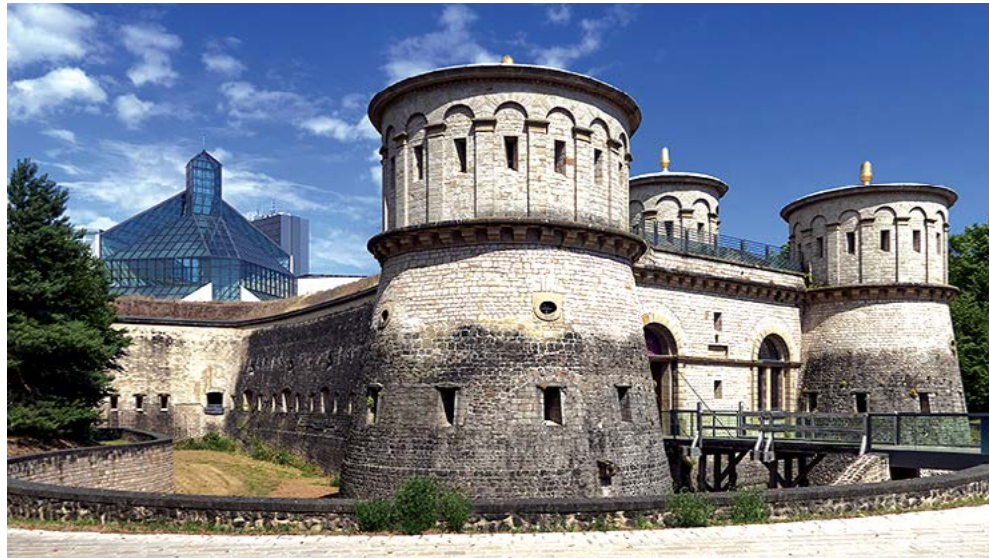
Tòa nhà Mudam với mái kiến trúc hình chữ V bất đối xứng nhô lên bên cạnh di tích Pháo đài Thüngen.