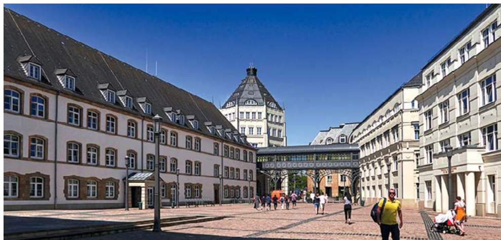
Khu phố Tư pháp theo phong cách Baroque Moselle nằm trên cao nguyên Saint-Esprit, nơi có tầm nhìn bao quát xuống thị trấn Hạ.