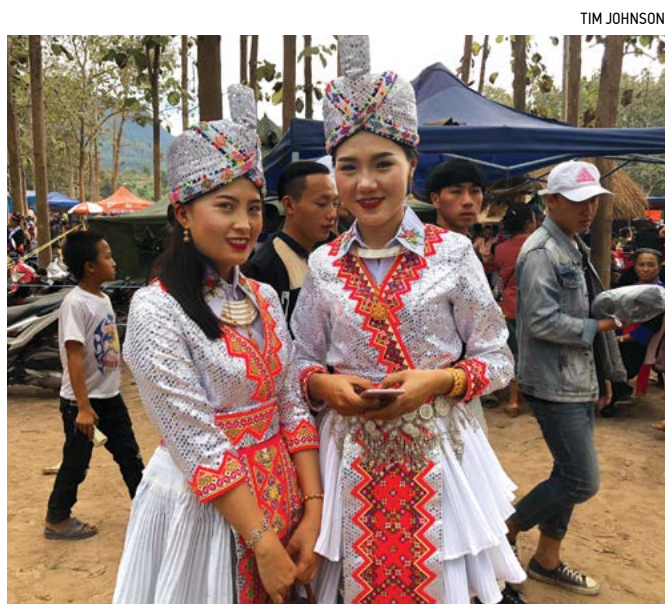
Một cặp đôi trẻ tại lễ hội Năm mới.