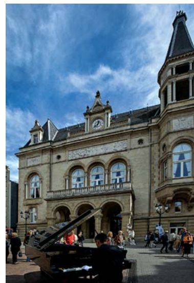
Buổi tối, quảng trường D'armes lãng mạn trong tiếng dương cầm, đem đến niềm vui cho du khách nhâm nhi một ly ở ngoài trời.