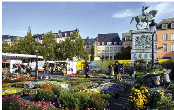
Tượng Đại công tước Guillaume II trên lưng ngựa, một trong những bức tượng tiêu biểu nhất của thủ đô Luxembourg, chợ phiên hàng tuần được tổ chức tại địa điểm này.