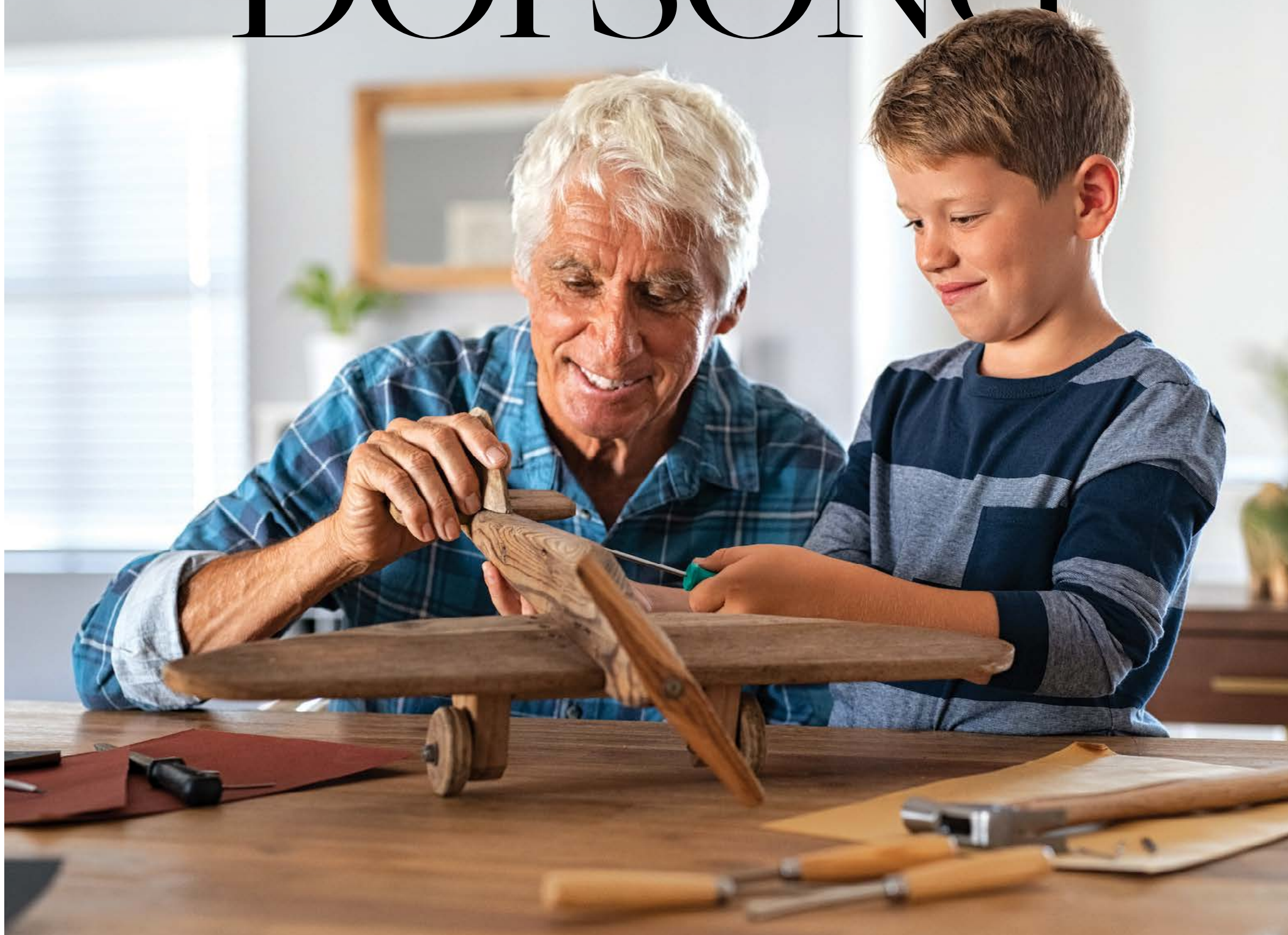
Ông bà đôi khi đóng vai trò là người bạn tâm giao của cháu mình.