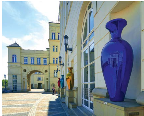
Những chiếc bình khổng lồ có màu sắc tươi sáng được đặt dọc theo các bức tường của Khu phố Tư pháp.