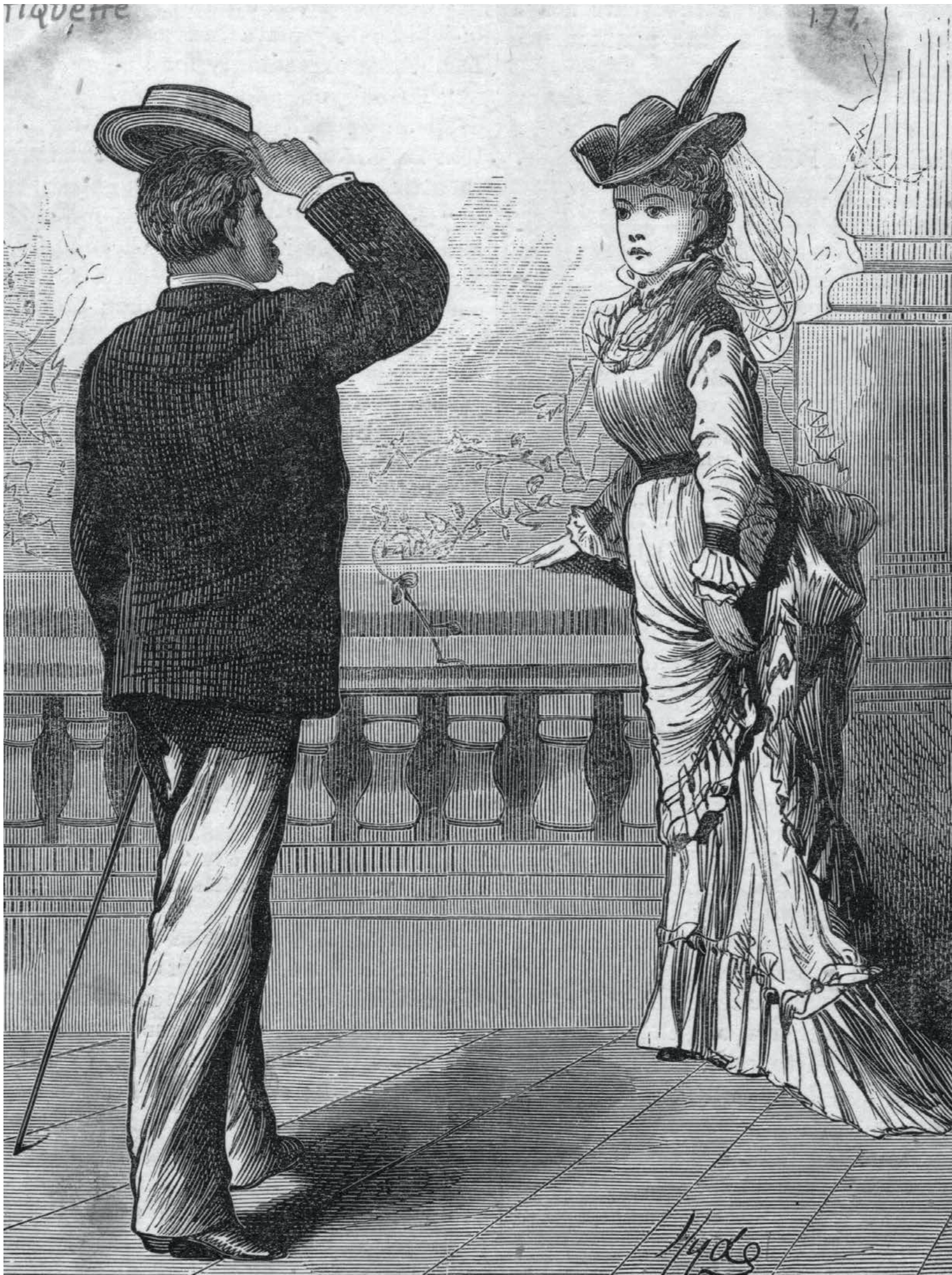
(Ảnh minh họa)