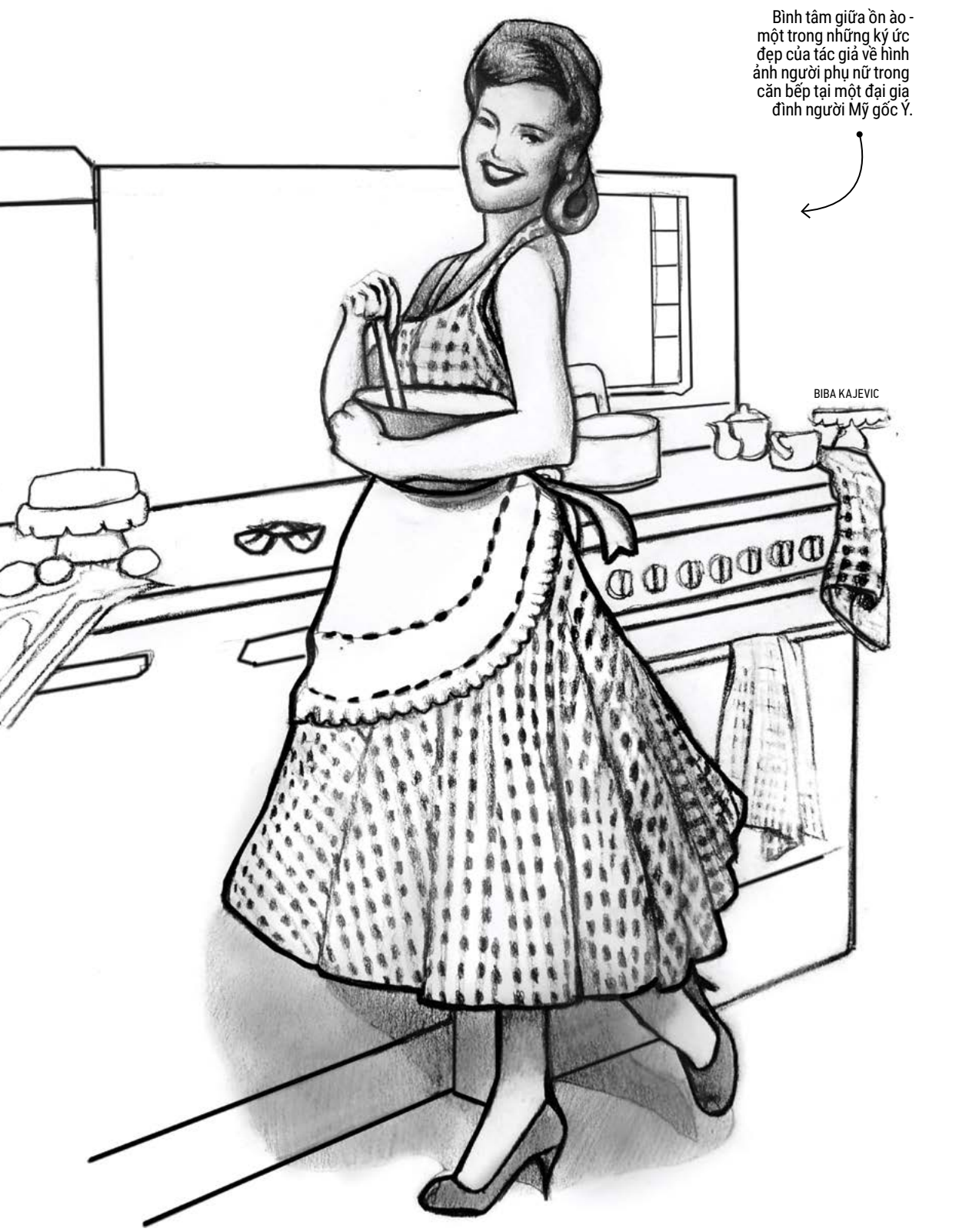
Bình tâm giữa ồn ào - một trong những kỷ ức đẹp của tác giả về hình ảnh người phụ nữ trong căn bếp tại một đại gia đình người Mỹ gốc Ý.