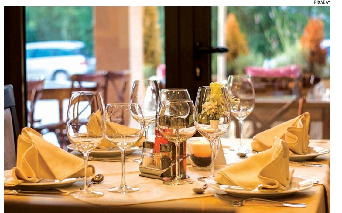
“Trong khi ngồi ăn, quý vị phải giữ cơ thể thẳng trên ghế và không bao giờ chống khuỷu tay lên bàn.”