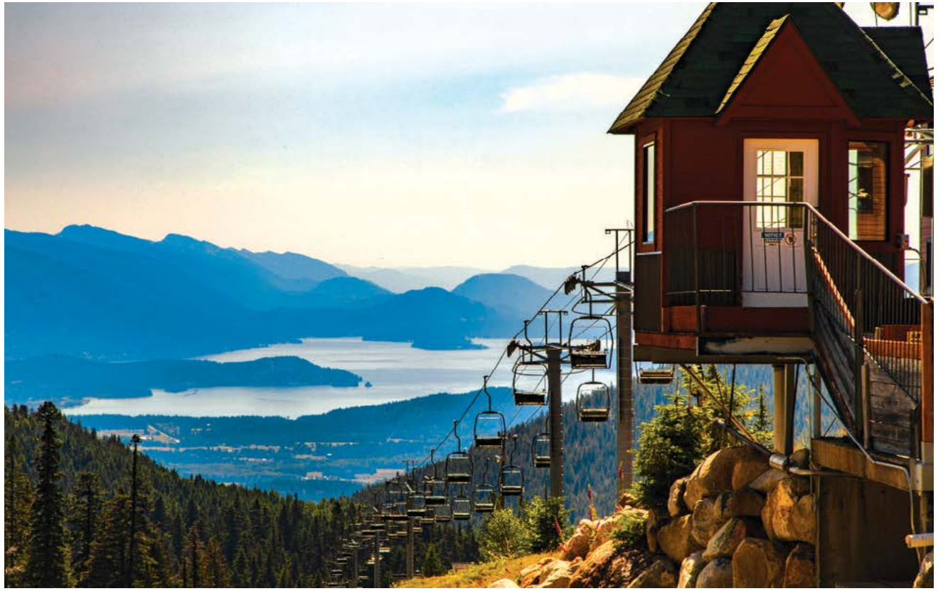
Phong cảnh Hồ Pend Oreille từ Núi Schweitzer.