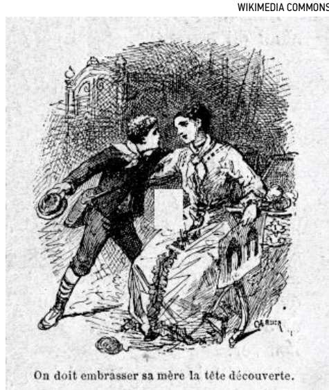
Khi ôm hôn mẹ thì cần để đầu trần.

Theo định nghĩa của nhà văn Courtin, tác phẩm này không chỉ đơn giản là liệt kê các quy tắc xã giao và