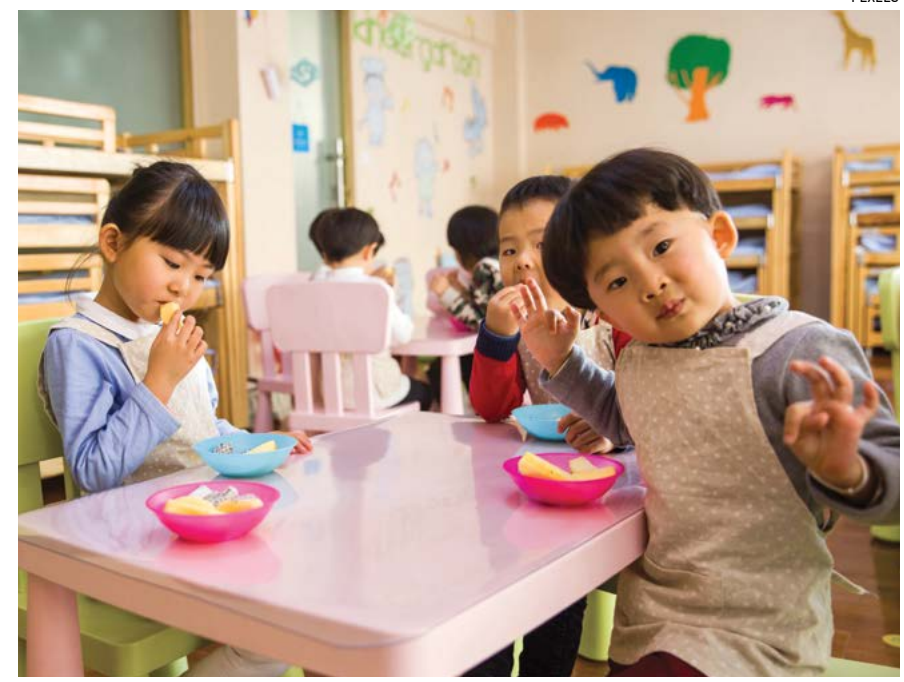
Trẻ nhỏ như một mầm non cần được nuôi dưỡng, mầm non ấy phát triển ra sao phụ thuộc cách chúng ta chăm bón tốt xấu như thế nào.