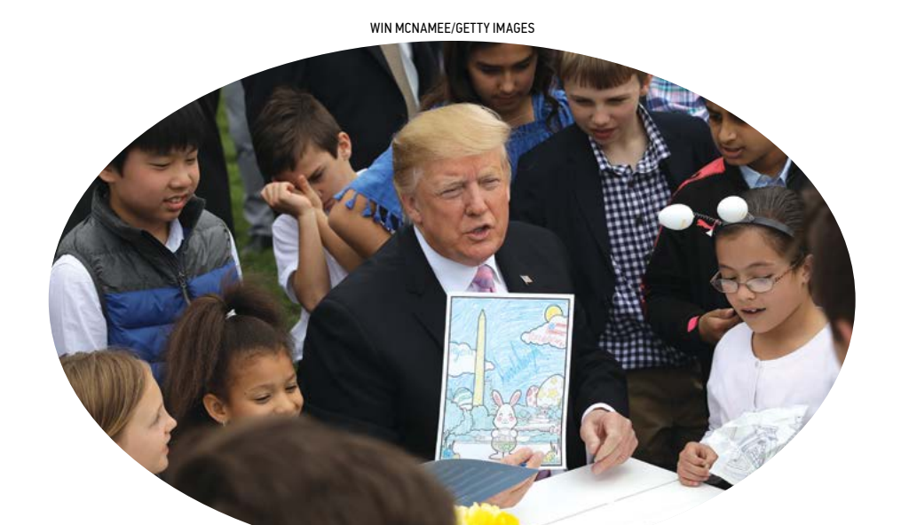
TT Donald Trump tham dự một buổi lễ màu với trẻ em trong Lễ Phục sinh lần thứ 141 trên Bãi cỏ phía Nam của Tòa Bạch Ốc ở Hoa Thịnh Đốn, ngày 22/4/2019.

Một số người cánh hữu đã từng nói rằng lý thuyết quan trọng và lý thuyết chủng tộc quan trọng là những nỗ lực dài hạn nhằm phá vỡ chính thể Hoa Kỳ