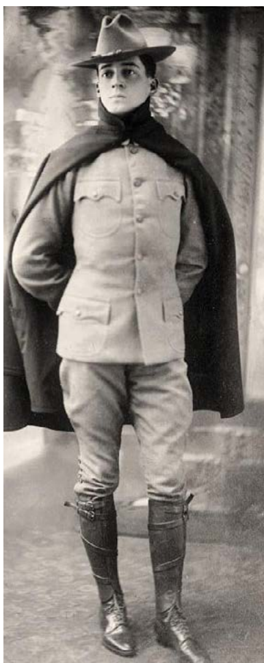
Douglas MacArthur thời trẻ, 1905.

trở thành tiền vệ của đội bóng đá, một người chơi bóng chày và là người chiến thắng trong giải vô địch quần vợt của trường.