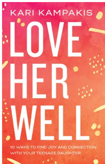
Cuốn sách mới nhất của Kampakis: "Yêu con gái đúng cách: 10 cách để tìm niềm vui và kết nối với con gái tuổi teen của bạn."

đổi, tình bạn cũng thay đổi, văn hóa của họ thiên về thành tích nhiều hơn, và những bài học tự mang xã hội về việc không ai có thể mắc sai lầm liên tục.