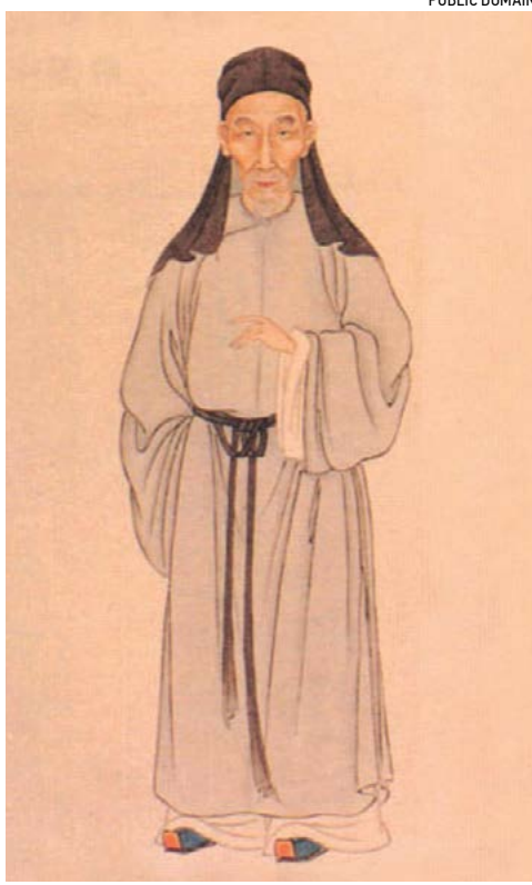
Tranh vẽ Vương Phu Chi của một họa sĩ đời nhà Thanh.