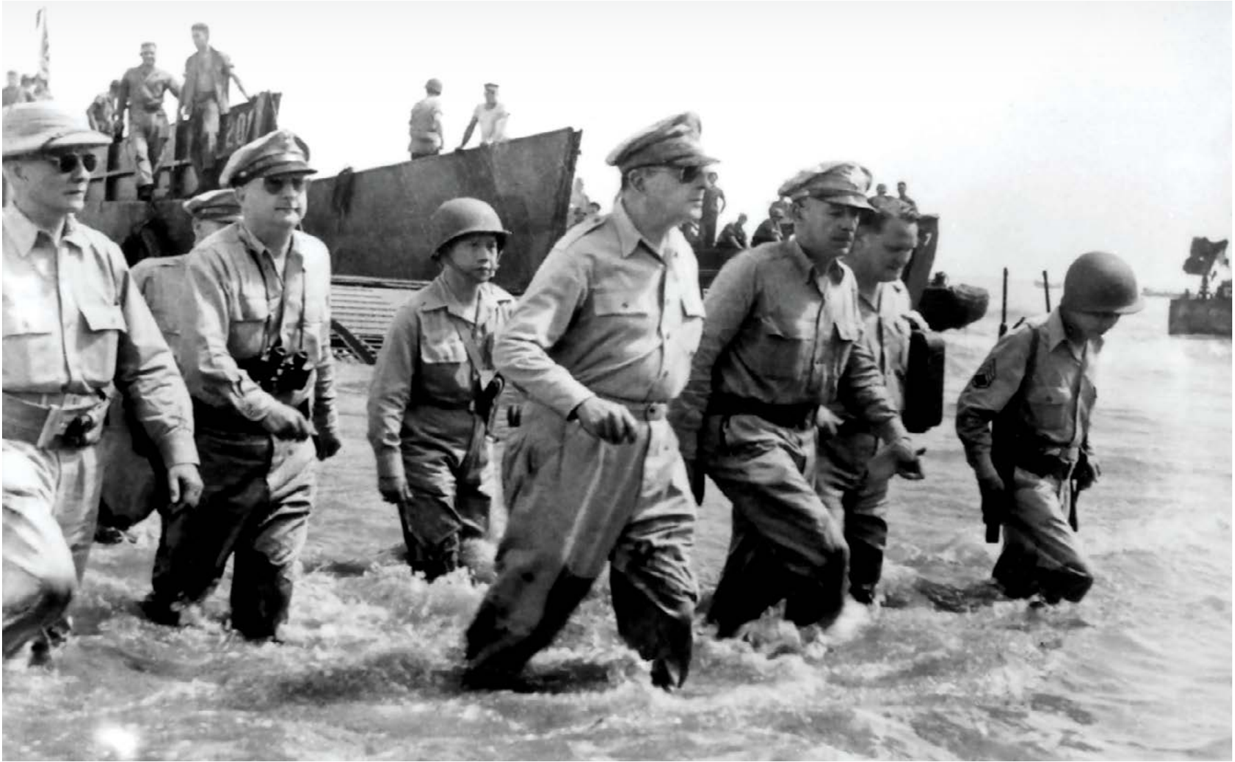
Thống tướng Douglas MacArthur (giữa) trong chuyến trở lại Philippines.