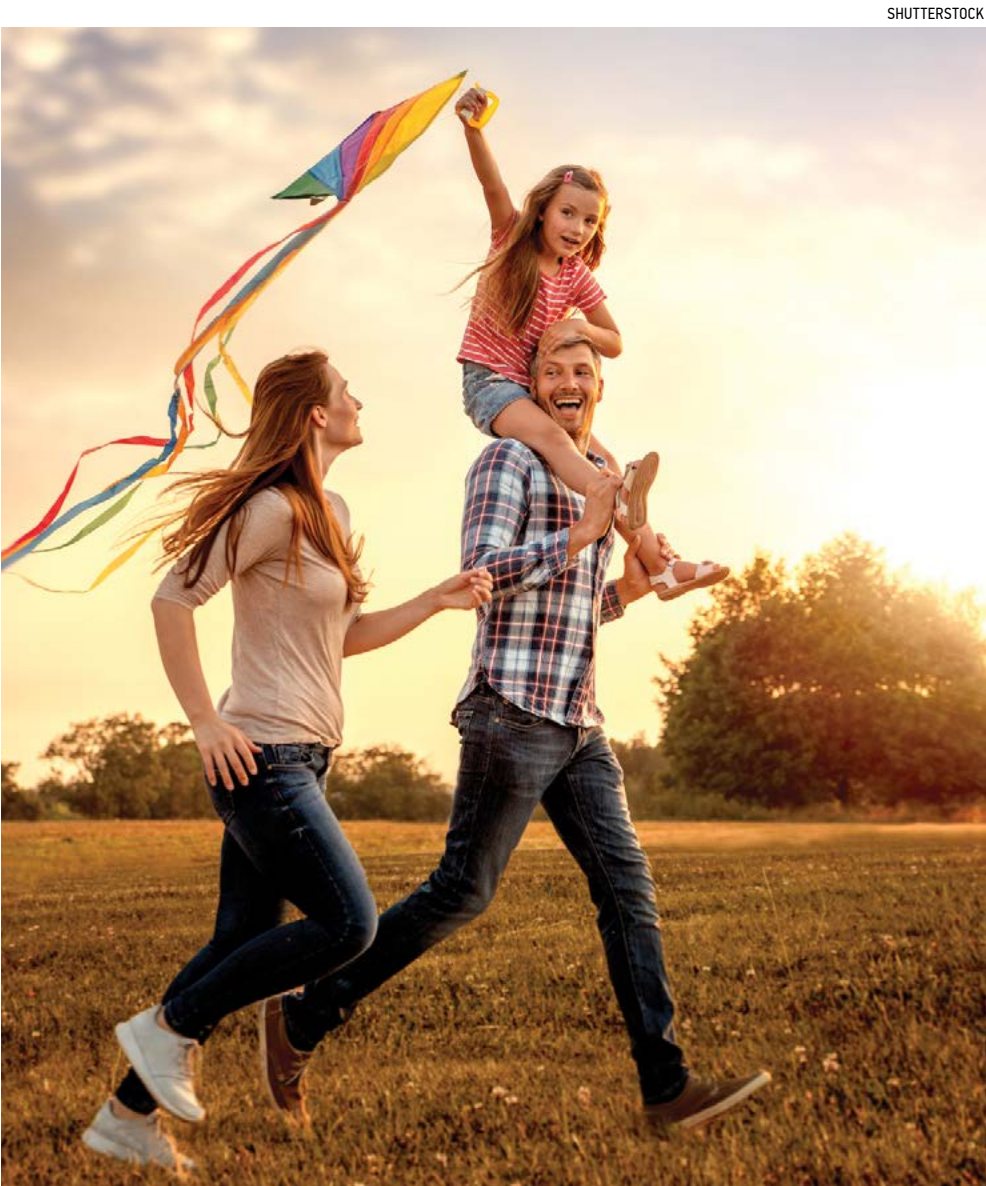
Sau tất cả, đừng quên dành thời gian vui chơi.

Liệt lịch các ngày đặc cho bản thân và các thành viên trong gia đình có thể làm cuộc sống trở nên phức tạp. Hãy tỉnh giác danh sách của bạn lại. Nhìn