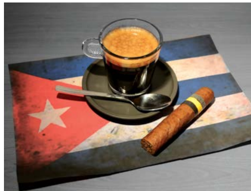
Cà phê Cuba.

Cuba đã từng là quốc gia sản xuất hạt cà phê số lượng khổng lồ, và có thời điểm trong thế kỷ 19, lợi nhuận từ việc xuất khẩu cà phê đã vượt qua lợi nhuận từ xuất khẩu đường. Nhưng sau cuộc cách mạng năm 1956, ngành công nghiệp này đã đi vào suy thoái. Ban đầu, cà phê được chế biến từ những hạt cà phê đã được nghiền mịn và ngâm nước nóng trong một túi vải. Tuy nhiên, espresso của Ý đã du nhập vào hòn đảo này và được ưa chuộng hơn. Người Cuba trong nước và cả người Cuba lưu vong thường thích thưởng thức espresso Cubano với một điều gì gì đó.