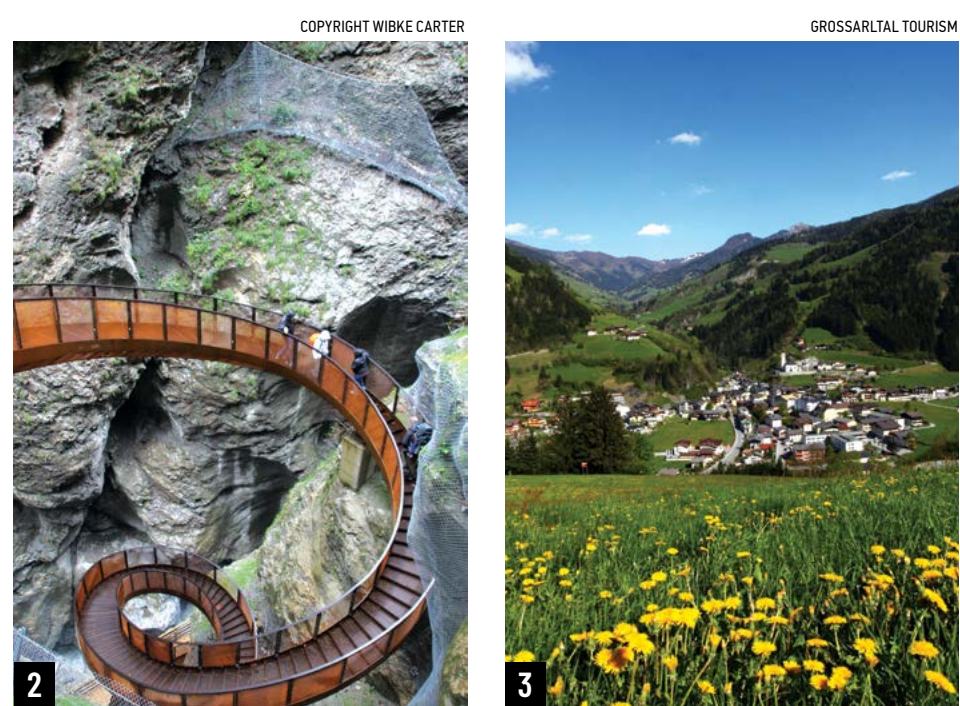
1. Chợ Giáng sinh ở thị trấn cổ Salzburg; 2. Con đường dẫn đến hẻm núi Liechtensteinklamm; 3. Thung lũng Grossarl với đồng cỏ.

ba của tòa nhà này gồm có bốn phòng và một nhà bếp. Nhạc sĩ Mozart rời xa mái ấm gia đình từ sớm khi đi cha ông đưa ông đi biểu diễn tài năng tại các thành phố lớn của Âu Châu thời bấy giờ. Chuyến lưu diễn lâu nhất kéo dài tới 3 năm, 5 tháng, và 20 ngày. Ngày nay, nơi Mozart chào đời đã trở thành một viện bảo tàng với mặt tiền được sơn vàng nổi bật hơn những tòa nhà lân cận.