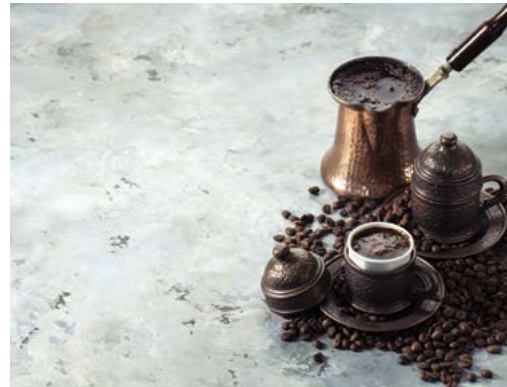
Cà phê Thổ Nhĩ Kỳ.

Cà phê Thổ Nhĩ Kỳ được xay mịn hơn cà espresso, và để chế biến thì đầu tiên, pha cà phê với nước nguội trong một ấm ibrik, một loại ấm pha nhỏ có tay cầm dài, và thêm đường tùy theo độ ngọt mong muốn: có đường, không đường, hoặc ít đường. (Một người bạn Thổ Nhĩ Kỳ đã nháy mắt cam đoan với tôi rằng tại nhà hàng, mọi người đều sẽ nhận được cà phê ít đường để tiện làm trong một lượt.) Ấm được đun nóng một cách vô cùng chậm rãi cho đến khi lớp bọt nổi lên. Sau khi dừng một lúc, ấm lại được tiếp tục đun nhỏ lửa và lớp bọt sẽ nổi lên một lần nữa.