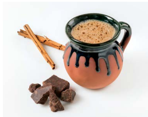
Café de Olla của Mexico.

Trong suốt cuộc Cách mạng Mexico, bắt đầu từ năm 1910 và kéo dài hơn một thập kỷ, những nữ quân nhân được gọi là adelitas, họ không chỉ ra chiến trận và chăm sóc người bị thương, mà còn chuẩn bị các bữa ăn. Họ cũng pha chế cà phê và tin rằng cà phê sẽ giúp mọi người tỉnh táo hơn.