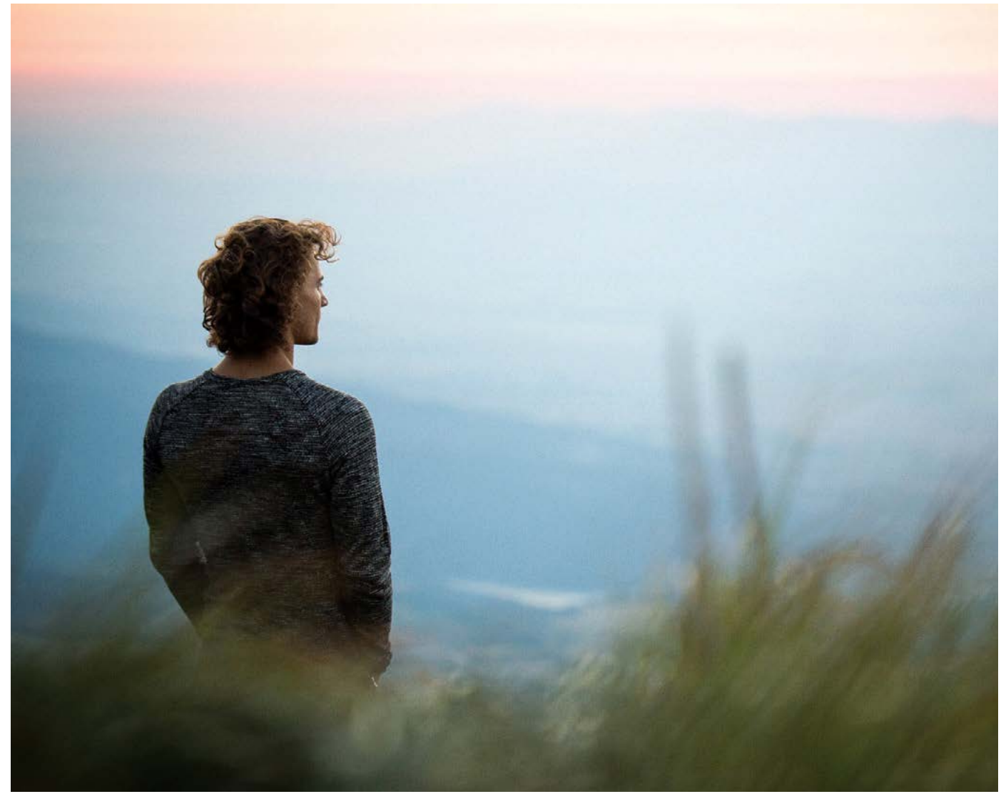
Mở rộng các cánh cửa nghĩa là tôi sẽ phải bận tâm hơn về việc người khác nghĩ gì về mình, nhưng thà như vậy vẫn tốt hơn ngày ngày đối diện với sự tăm tối.