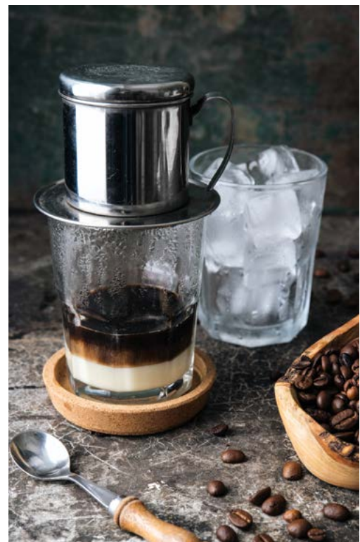
Cà phê Việt Nam.

Để chuẩn bị loại cà phê này, trước tiên đổ bột cà phê vào trong phin – một loại tách kim loại với đáy lọc đặt ở bên trên một đĩa lọc. Một miếng lọc kim loại khác được đặt ở phía trên cà phê. Tất cả sẽ được đặt trên một ly tinh trong suốt. Sau khi đổ nước nóng vào trong phin, cà phê sẽ chậm chậm nhỏ giọt xuống ly. Đa số người dùng đều sẽ cho thêm hai hoặc ba thìa sữa đặc, hoặc có khi cho thêm đá.