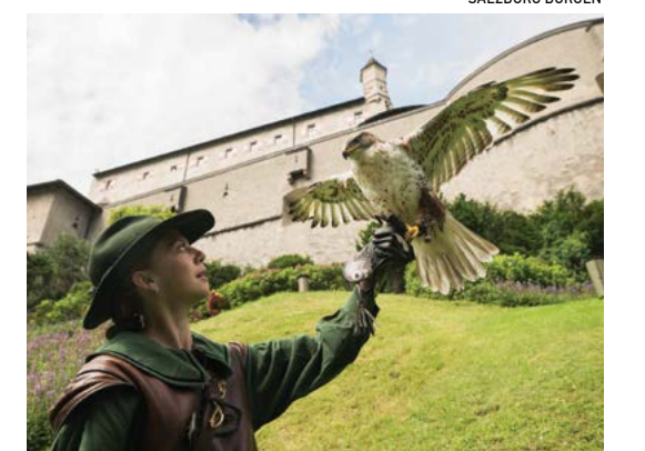
Chim săn mồi đậu trên tay một người huấn luyện chim ưng ở Hohenwerfen.