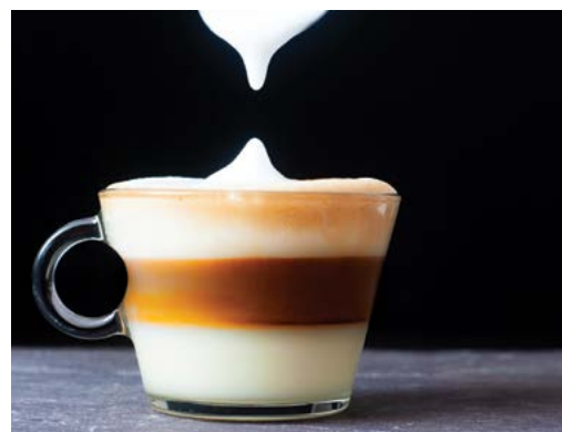
Cà phê Flat White của Úc Châu.

Để chuẩn bị loại cà phê này, trước tiên đổ bột cà phê vào trong phin – một loại tách kim loại với đáy lọc đặt ở bên trên một đĩa lọc. Một miếng lọc kim loại khác