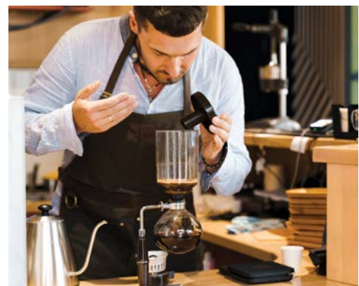
Cà phê Siphon (cà phê làm bằng phương pháp chân không)

Tùy thuộc vào người mà bạn hỏi, sẽ có người trả lời rằng phương pháp pha cà phê này được phát minh ở Pháp hoặc Scotland vào những năm 1840, nhưng cũng sẽ có ý kiến cho rằng trên thực tế, nó đã bắt nguồn từ Đức trước đó một thập kỷ. Tuy nhiên, nếu bạn muốn quan sát phương thức pha cà phê này, Nhật Bản sẽ là địa điểm thích hợp nhất, nơi mà cà phê Siphon vẫn còn phổ biến.