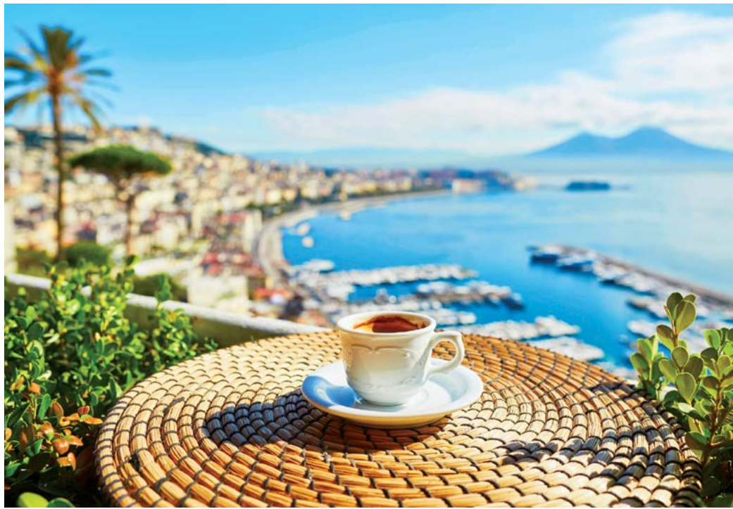
Cà phê Espresso của Ý.