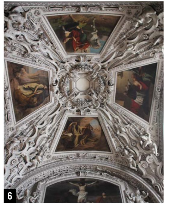
4. Lối vào hang băng Eisriesenwelt; 5. Bảo tàng Salzburger Weihnachtsmuseum và Bảo tàng Salzburg tại quảng trường Residenzplatz; 6. Quang cảnh trần nhà trong nhà thờ Salzburg.