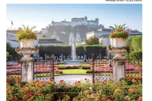
Khu vườn Mirabell tại Stadt Salzburg vào một buổi sáng mùa hè, Salzburg, Áo.