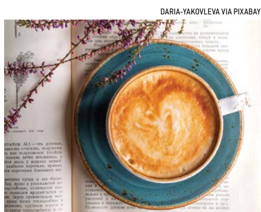
Cà phê Espresso.

Từ cách pha chế sáng tạo espresso này mà nhiều loại cà phê đã ra đời, từ cappuccino và latte cho đến bicerin – gồm có espresso, sữa, chocolate còn nguyên bơ – và Marocchino, một loại cà phê espresso có lớp bọt sữa, được phục vụ trong một ly thủy tinh nhỏ và phía trên có rắc bột cacao. Và dĩ nhiên, không thể không nhắc đến Americano, một loại espresso được pha loãng với nước nóng trong một ly lớn, bởi, như những người Ý từng nói với tôi rằng người Mỹ chúng ta uống “brodo” (broth-nước cốt). Tuy nhiên, Americano