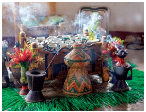
Cà phê Ethiopia.

Cà phê Yirgacheffe có hương vị nhẹ và sáng màu, được đặt tên theo vùng mà nó sinh trưởng, và có thể được tìm thấy ở cả những vùng hoang dã nơi đây. Nơi ra đời của loại cà phê này mang đến cho nó những “đặc quyền” trịnh trọng. Sau khi nhang được đốt lên để xua đuổi các tà linh, những hạt cà phê sẽ được rang trong chảo, xay và ủ trong ấm đất sét trên lửa, và sau đó sẽ được thưởng thức cùng bạn bè trong một sự kiện giao lưu xã hội kéo dài hơn hai giờ.