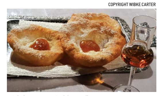
Bánh donut rượu mùi thông arolla.