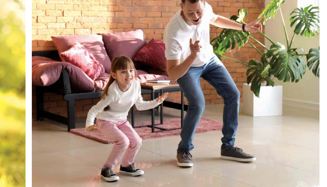
Âm nhạc không chỉ đem lại niềm vui mà còn rất tốt cho não của trẻ em.

Hãy chia sẻ câu chuyện của bạn với chúng tôi tại emg.inspired@epochtimes.com và tiếp thêm nguồn cảm hứng hàng ngày bằng cách ghi danh nhận bản tin Epoch Inspired tại TheEpochTimes.com/newsletter .