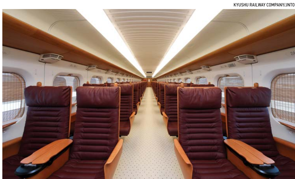
Nội thất của Tàu JR Kyushu Bullet.