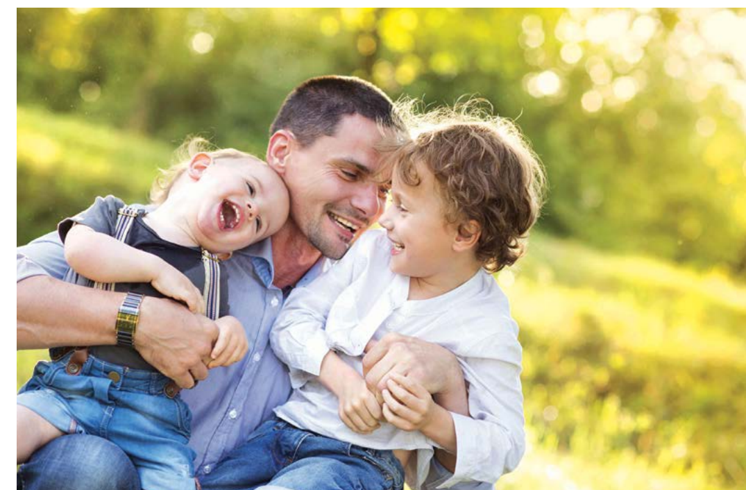
Thế hiện sự trù mến với trẻ em có thể giúp trẻ hiểu rằng chúng đang được yêu thương.