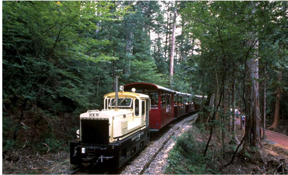
Một chuyến tàu đi qua một khu rừng ở tỉnh Nagano.