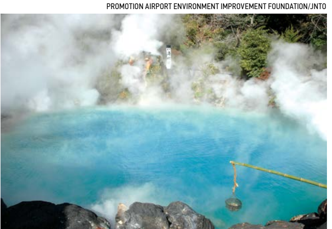
Umi Jigoku, hay suối nước nóng Sea Shell, ở thành phố Beppu, Nhật Bản.