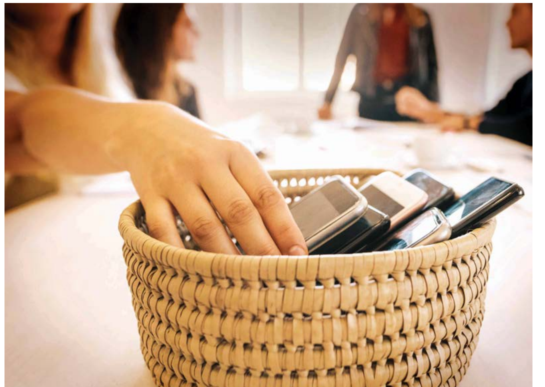
Cha mẹ nên giới hạn thời gian sử dụng các thiết bị điện tử như tv, điện thoại... của trẻ.

Nói tới việc nhà, đây chính là một cách rèn luyện trách nhiệm cho con. Bất kể là rửa chén, chuẩn bị thức ăn hay bữa ăn, chăm sóc cho thú nuôi, hay dọn giặt chỉ chuẩn bị giường và dọn dẹp