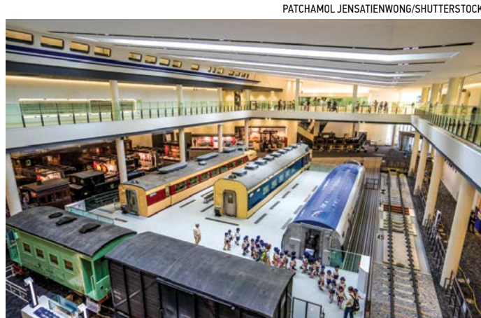
Quang cảnh bên trong Bảo tàng Đường sắt Kyoto.