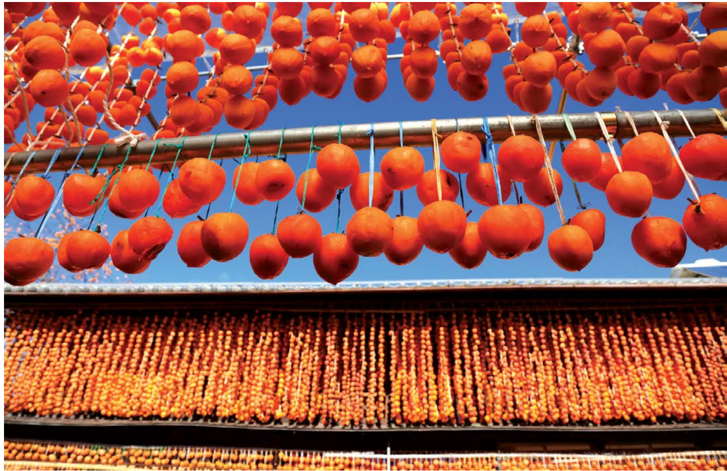
Những dây treo hồng sấy (hoshigaki) là một cảnh tượng thường thấy ở vùng nông thôn Nhật Bản. Làm hồng sấy là một nghi thức theo mùa ở nơi đây.