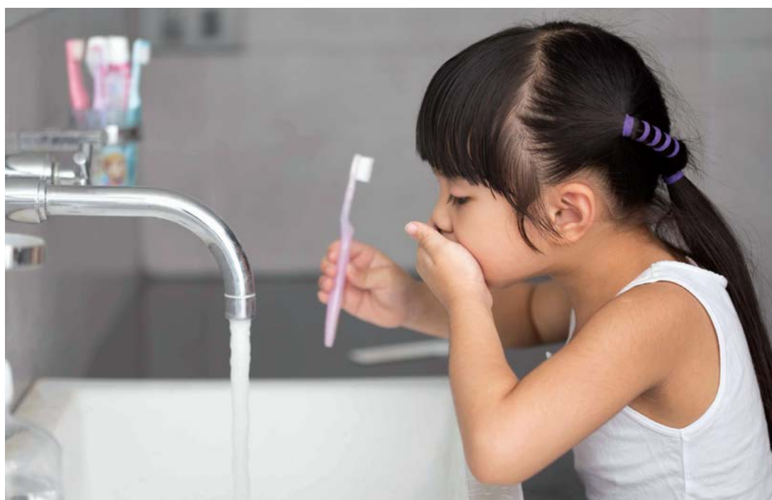
Một cách vừa tốt cho bản thân cha mẹ và vừa cho con họ sự ổn định cần thiết là thiết lập các thói quen.

khăn, vì vậy việc bắt đầu hình thành sự đồng cảm từ khi còn nhỏ là rất quan trọng.