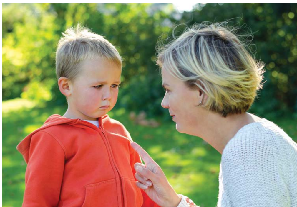
Cha mẹ nên đặt ra ranh giới cho con mình và cần bảo đảm chúng được tôn trọng.

Học cách thương người Lòng trắc ẩn không phải là một thứ gì đó bất ngờ phát triển ở trẻ em. “Đặt bản thân vào hoàn cảnh của người khác” không phải là một bản năng tự nhiên. Tại sao phải chia sẻ thứ gì đó trong khi bạn có thể có được nó cho riêng mình? Đây là điều rất nhiều người trưởng thành cảm thấy khó