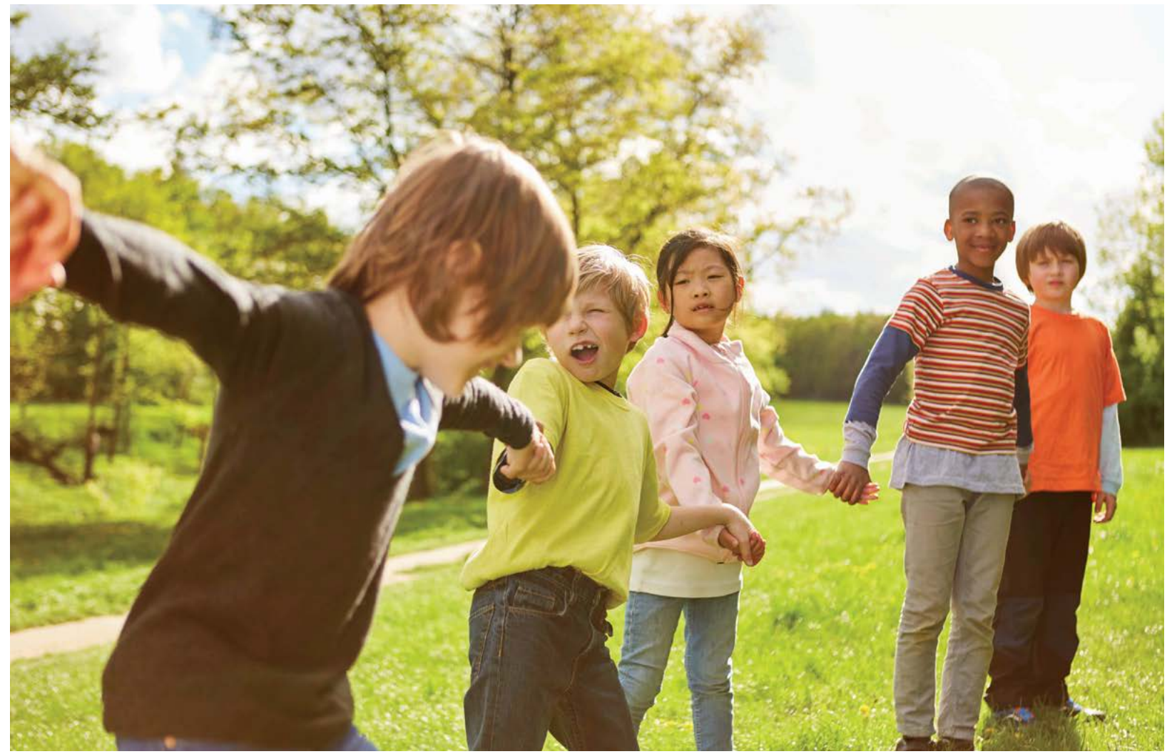
Hoạt động ngoài trời cung cấp vitamin D cho cơ thể và cũng giúp sự vận động cần thiết của trẻ con.

Món đồ chơi bằng lông mà mọi người hiện nay mua cho giáng sinh