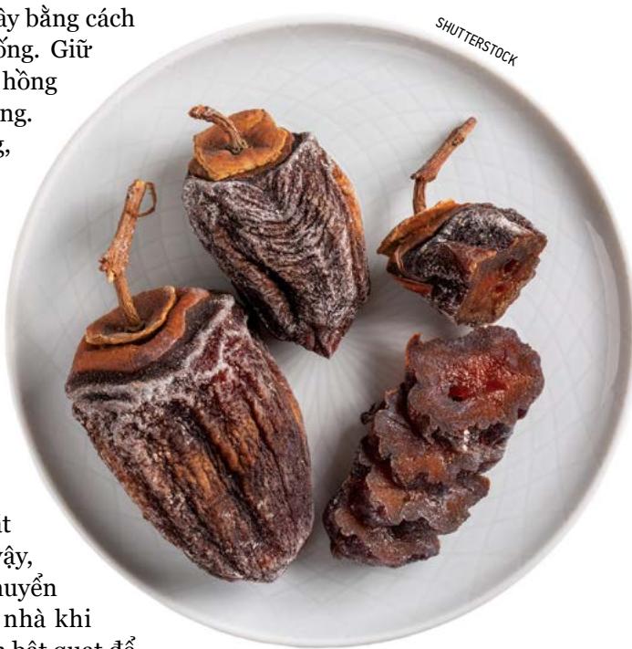
Đậm vị và dai ngon, mang theo vị ngọt caramel, hồng sấy là một tinh hoa ẩm thực truyền thống được yêu chuộng tại Nhật Bản. Hồng sấy thích hợp để nhâm nháp một cách từ từ.