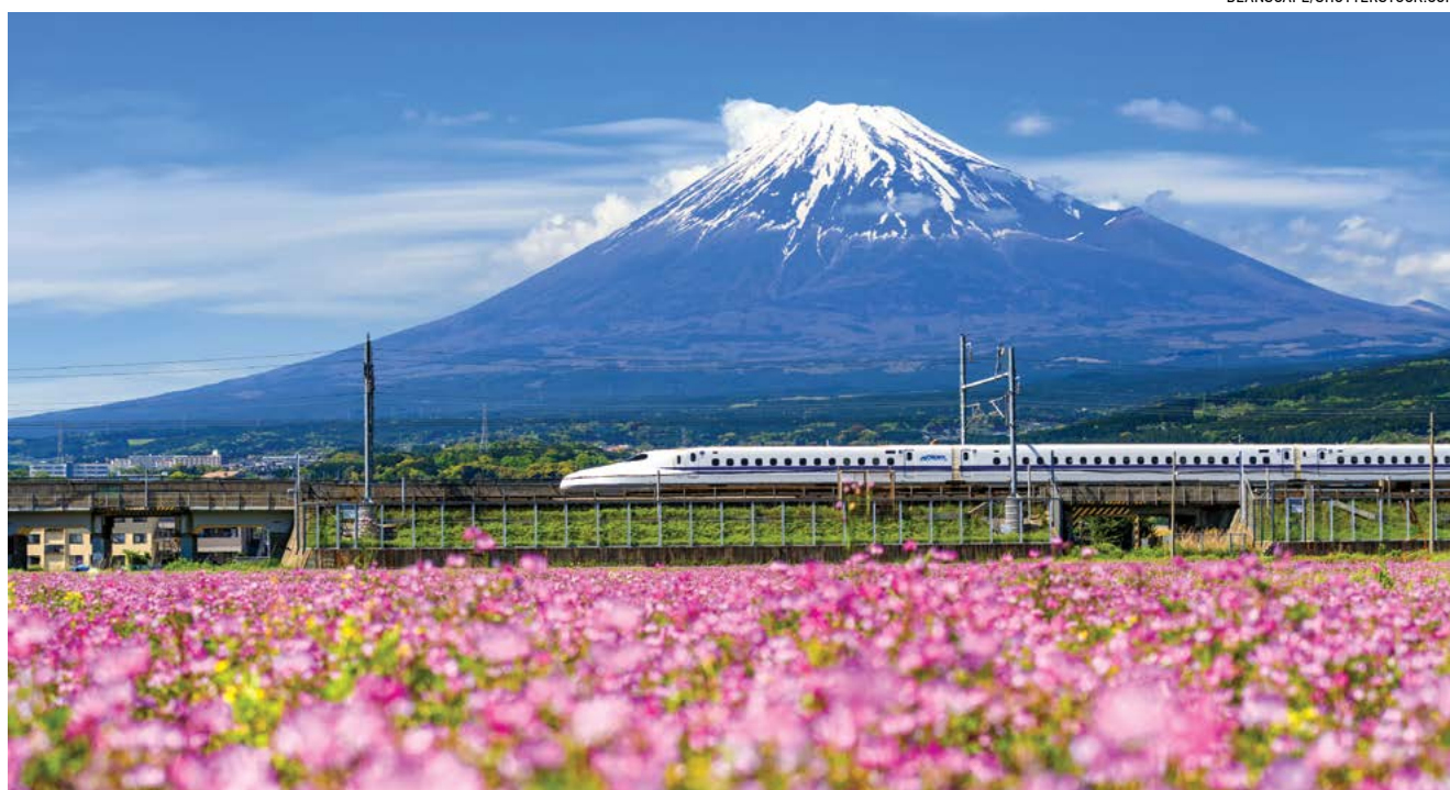
Tàu Shinkansen, hay còn gọi là tàu cao tốc, chạy qua núi Phú Sĩ trong mùa xuân giữa lúc hoa chi anh đang nở rộ.