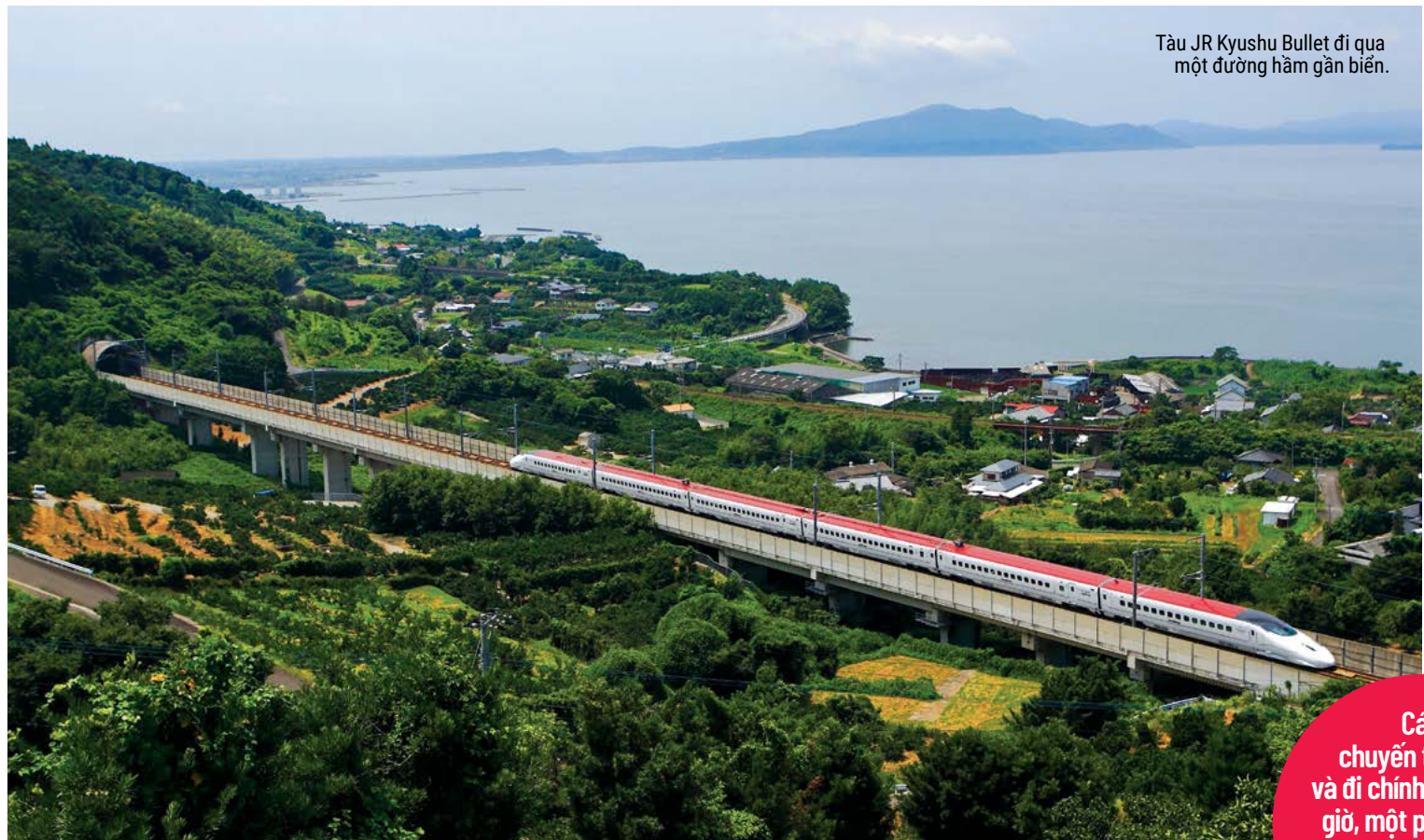
Tàu JR Kyushu Bullet đi qua một đường hầm gần biển.