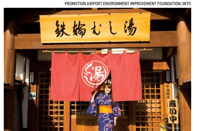
Một phụ nữ trong trang phục truyền thống Phòng tắm Hoi Kannawa ở thành phố Beppu, Nhật Bản.