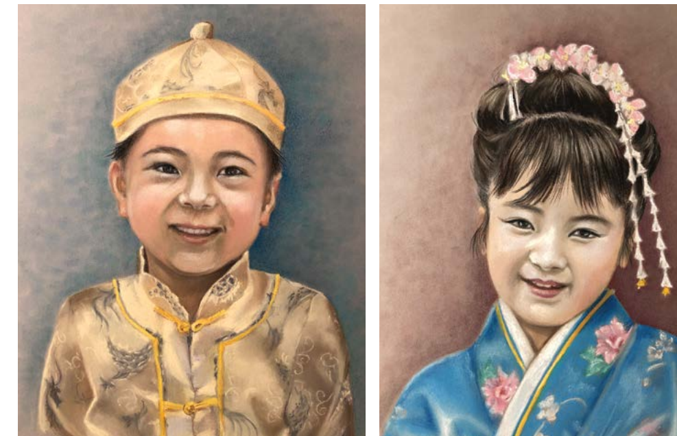
Một số tác phẩm của bà Barbara Schafer: Cậu bé Trung Hoa trong trang phục truyền thống; Bé gái Nhật Bản trong trang phục truyền thống. Chất liệu pastel.