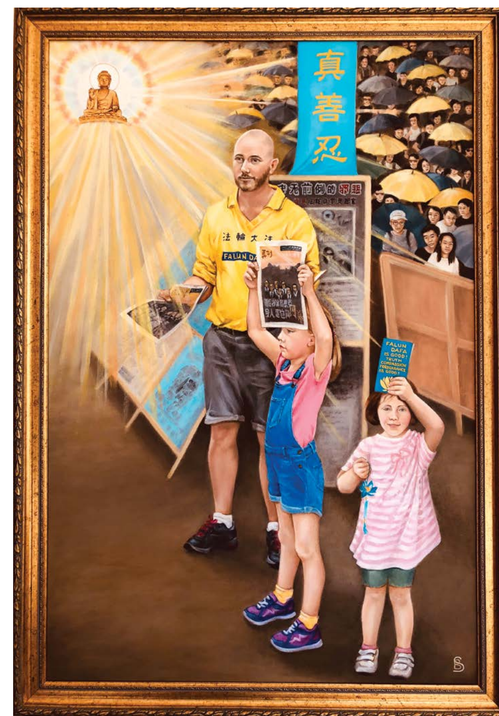
"Buddha Light Shines in Hong Kong" (Tạm dịch: "Phật quang phổ chiếu tại Hồng Kông") của bà Barbara Schafer. Tác phẩm sơn dầu trên vải, 90 cm x 60 cm.

(các nguyên tắc chỉ đạo của Pháp Luân Công) trên biểu ngữ màu xanh.