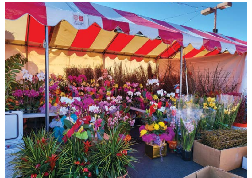
Hàng năm tại đây có chợ Tết để bà con người Việt đến mua sắm, cũng đủ loại bánh mứt, bánh chưng bánh tét, hoa Mai, Đào, Lan, Cúc...

Hoa đào nở, chim én về, mùa xuân sắp sang. Vậy là Tết sắp đến rồi, trong lòng sao thấy nao nao. Nam Cali mấy ngày nay nắng ấm chan hòa; khu chợ quanh Phước Lộc Thọ đã dựng sạp bán các mặt hàng Tết. Hiện diện lâu đời tại vùng Little Saigon, thương xá "Phước Lộc Thọ" giống như một ngôi làng để người Việt hệ có lễ tết gì thì tụ tập về đó. Cổng thương xá có cấu trúc rất quen thuộc như một mái đình làng. Hàng năm tại đây có chợ Tết để bà con người Việt đến mua sắm.