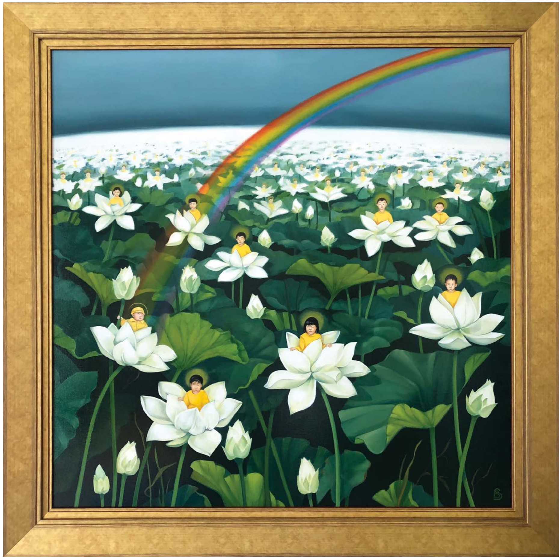
Tác phẩm "The Sea of Suffering" (Tạm dịch: Biển khổ) của bà Barbara Schafer. Tranh sơn dầu trên vải, 120 cm x 120 cm.