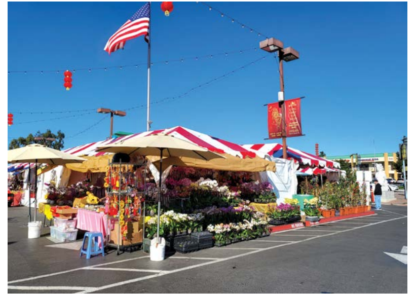
Từ đường Bolsa queo vào đã thấy hàng bày bán sát ngay đầu chợ.

Hoa đào nở, chim én về, mùa xuân sắp sang. Vậy là Tết sắp đến rồi, trong lòng sao thấy nao nao. Nam Cali mấy ngày nay nắng ấm chan hòa; khu chợ quanh Phước Lộc Thọ đã dựng sạp bán các mặt hàng Tết. Hiện diện lâu đời tại vùng Little Saigon, thương xá "Phước Lộc Thọ" giống như một ngôi làng để người Việt hệ có lễ tết gì thì tụ tập về đó. Cổng thương xá có cấu trúc rất quen thuộc như một mái đình làng. Hàng năm tại đây có chợ Tết để bà con người Việt đến mua sắm.