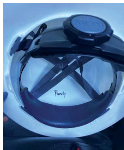
Chiếc nón bảo hộ của Jared Kish.

Sau đó, anh Jared hướng dẫn học sinh của mình chọn một chữ có ý nghĩa động viên và viết vào bên trong nón bảo hộ của họ, và họ có thể nhìn thấy chữ ấy mỗi khi cỡi chiếc nón ra.