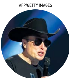
Giám đốc điều hành của Tesla Motors Elon Musk nói chuyện tại bữa tiệc khai trương “Cyber Rodeo” của công ty sản xuất Tesla Giga Texas ở Austin, Texas, hôm 07/04/2022.

Trong tuyên bố, Twitter nói rằng HĐQT sẽ chấp nhận lời đề nghị nếu “điều đó đem lại nhiều lợi ích