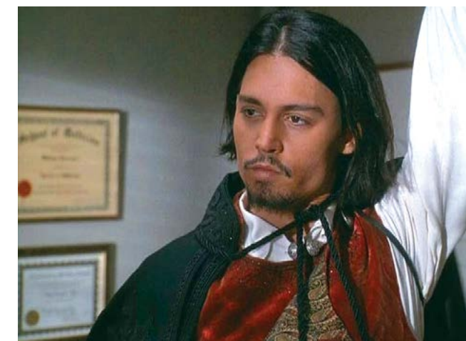
Nhân vật Don Juan DeMarco (Johnny Depp) kể câu chuyện của mình cho "Don Octavio de Flores" (một bác sĩ tâm thần, Tiến sĩ Mickler do Marlon Brando thủ vai) trong phim "Don Juan DeMarco".

Tiến sĩ Mickler quá kiệt sức và đã sẵn sàng về hưu. Tuy nhiên ông bị thuyết phục bởi phong thái nghiêm túc, sự chân thành của chàng trai trẻ, và ấn tượng bởi sự trung thực cùng sự thông thái ẩn chứa trong những lời nói ngắn gọn của anh ta. Ông xin người sắp đang đo dự của