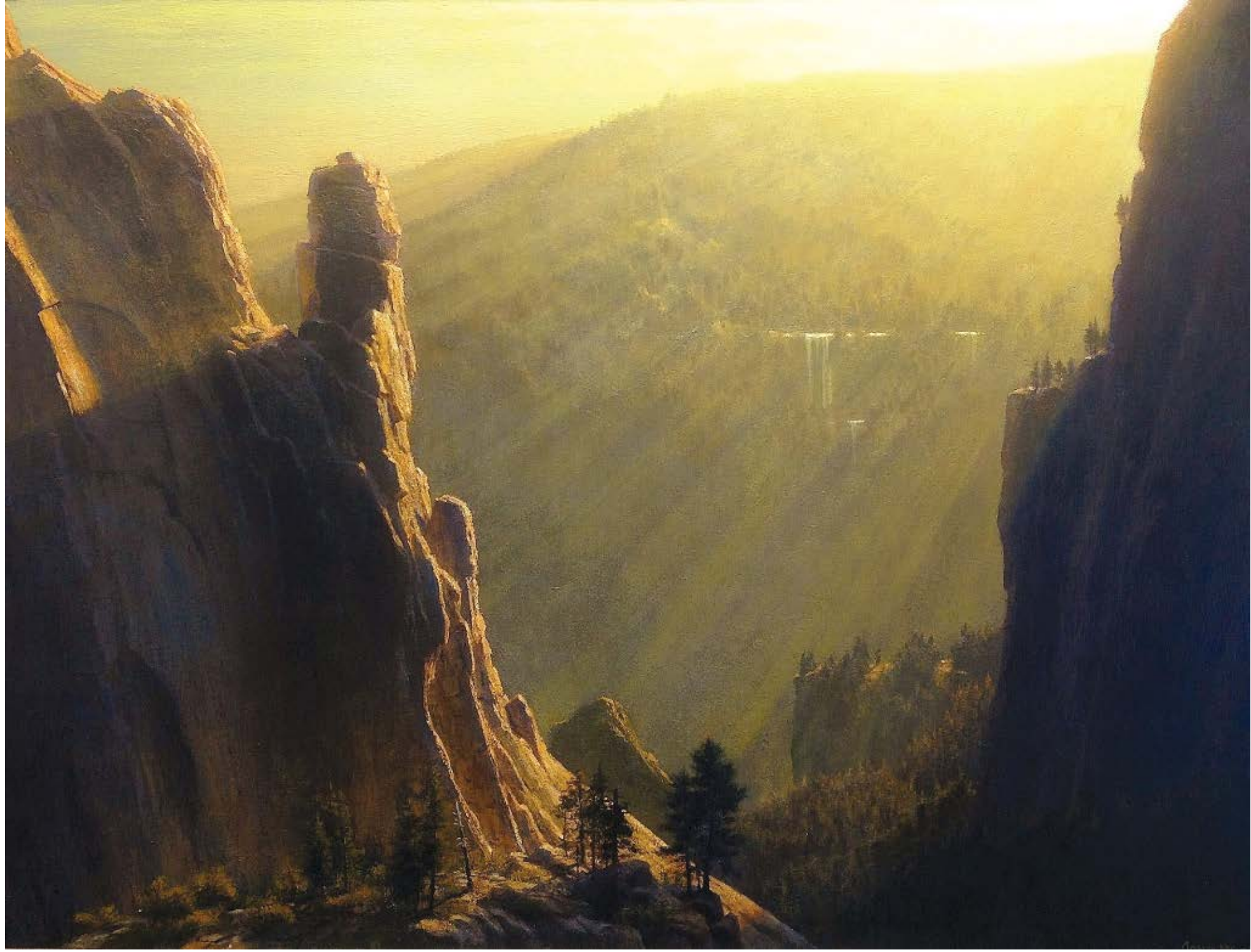
"Những Luồng Sáng" của Joseph McGurl. Sơn dầu trên vải; 76cm x 101cm.