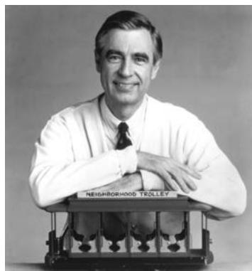
Fred McFeely Rogers (1928-2003). Ông nổi tiếng vì đã tạo ra và là người dẫn chương trình thiếu nhi “Mr. Rogers’ Neighborhood.” (1968-2001).

Trên mảnh đất này, những người theo kiểu truyền thống là được rèn luyện mà thành, chứ không phải họ sinh ra đã vậy.