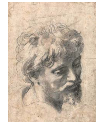
Tác phẩm "Nghiên Cứu về Phân Đầu một Tổng Đồ trong Lê Biên Hình" của Raphael. Bộ sưu tập cá nhân, New York.

cách] nghệ thuật cổ đại và hình tượng nàng Leda trong bản vẽ của Leonardo.