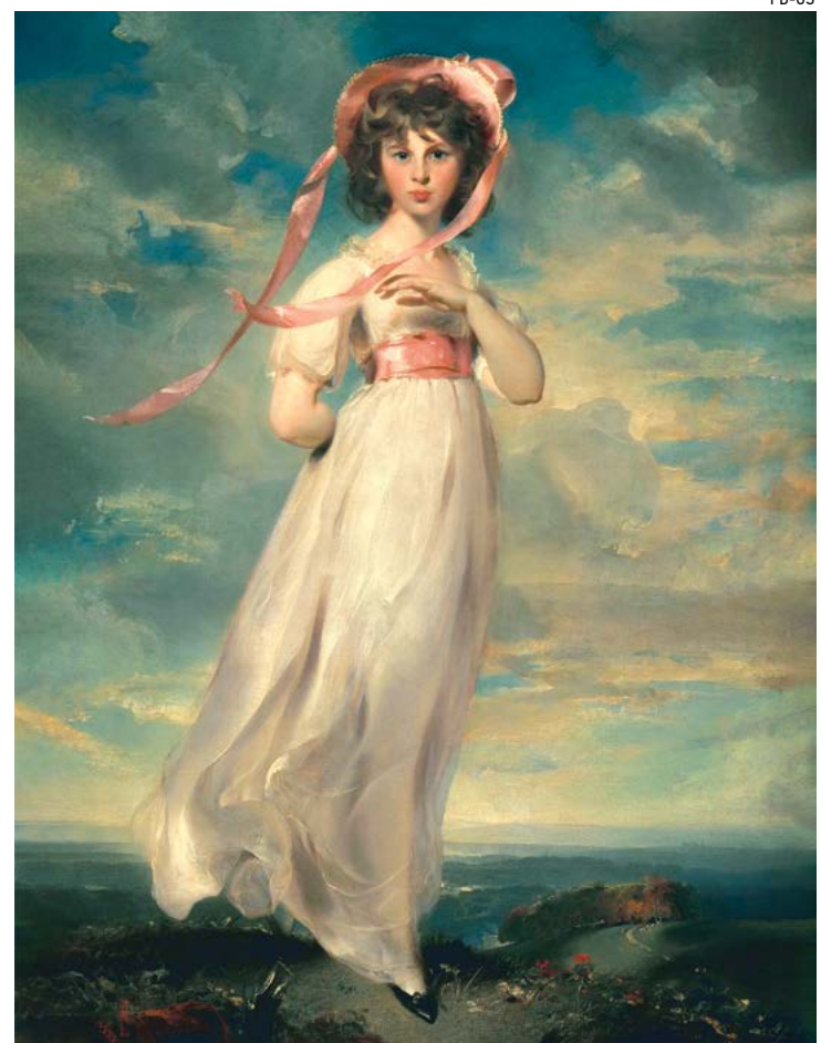
"Sarah Goodin Barrett Moulton: 'Pinkie' (Cô bé hồng)", năm 1794, do họa sĩ Thomas Lawrence vẽ. Tranh sơn dầu trên vải. 58 1/4 x 40 1/4 inch. Thư viện Huntington, San Marino, California.