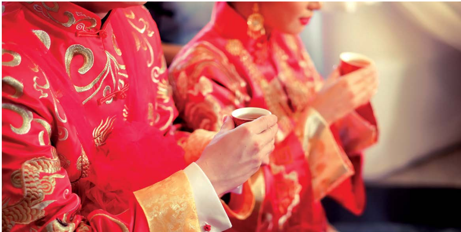
Tân lang tân nương trong một lễ cưới Trung Quốc truyền thống.