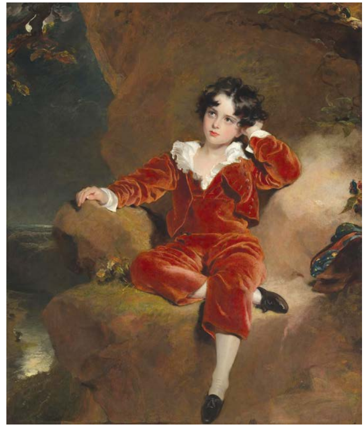
Chân dung Charles William Lambton, thường được biết đến là "The Red Boy" (Cậu Bé Đỏ), năm 1825, do họa sĩ Thomas Lawrence vẽ. Tranh sơn dầu trên vải; 55 1/3 x 43 1/2 inch. Phòng triển lãm Quốc gia, London.