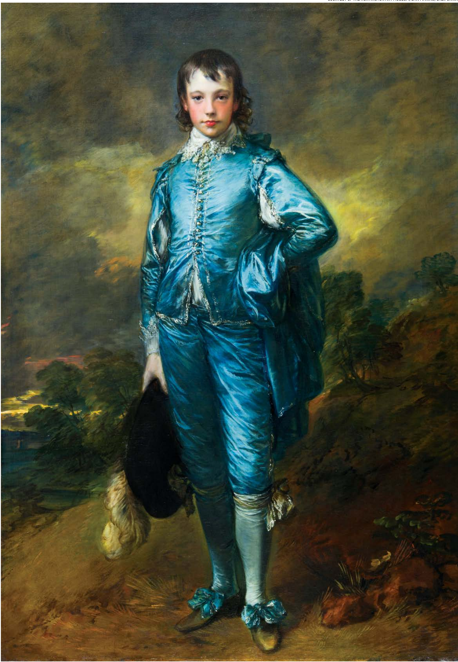
“The Blue Boy”, năm 1770, do họa sĩ Thomas Gainsborough vẽ. Sơn dầu trên vải; 70 x 44 inch. Thư viện Huntington, Bảo tàng Nghệ thuật, và Vườn Bách thảo San Marino, California.