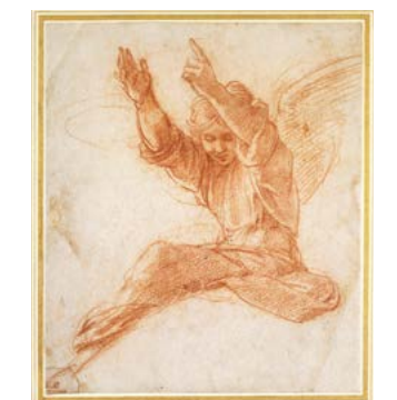
Tác phẩm "Thiên Thần" của Raphael. Khoảng 20 cm x 20.6 cm; vẽ bằng bút và mực nâu trên các phác thảo hình học bằng bút kim loại mờ. Bảo tàng Ashmolean của Đại học Oxford.