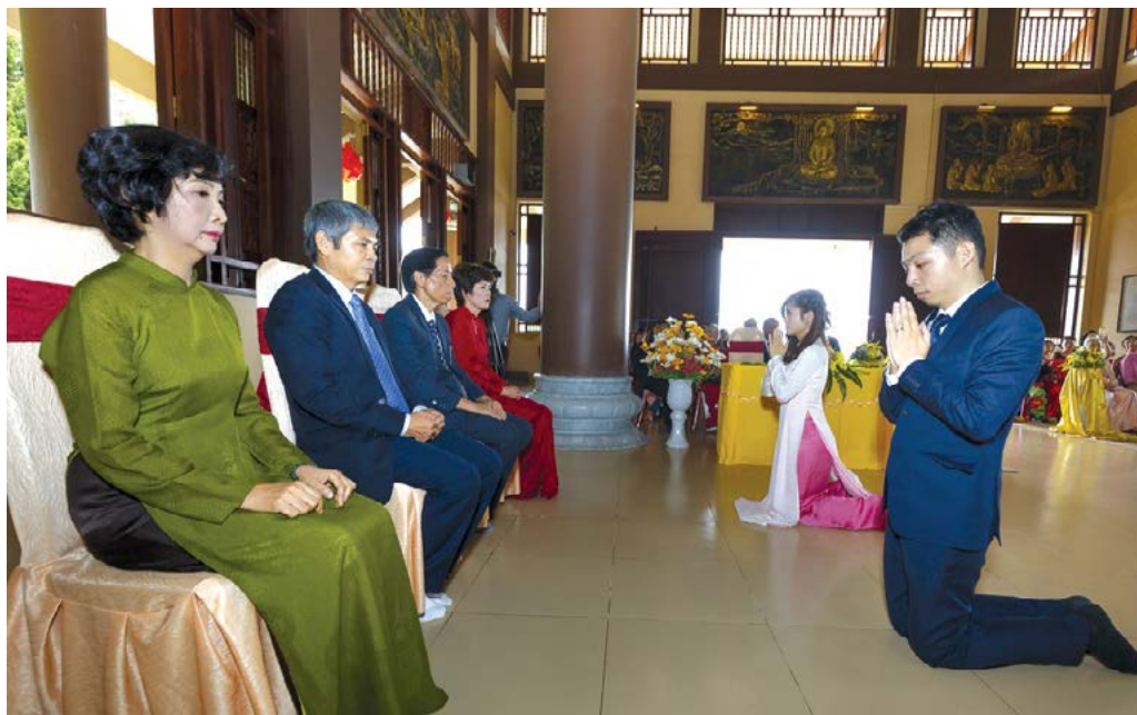
Trong văn hóa Việt Nam, lễ cưới truyền thống mang đậm tư tưởng Phật giáo và Nho giáo.

truyền thống mang đậm tư tưởng Phật giáo và Nho giáo, đồng thời tôn vinh sự ràng buộc giữa hai người tri kỷ bằng cách cầu xin sự phù hộ của tổ tiên.