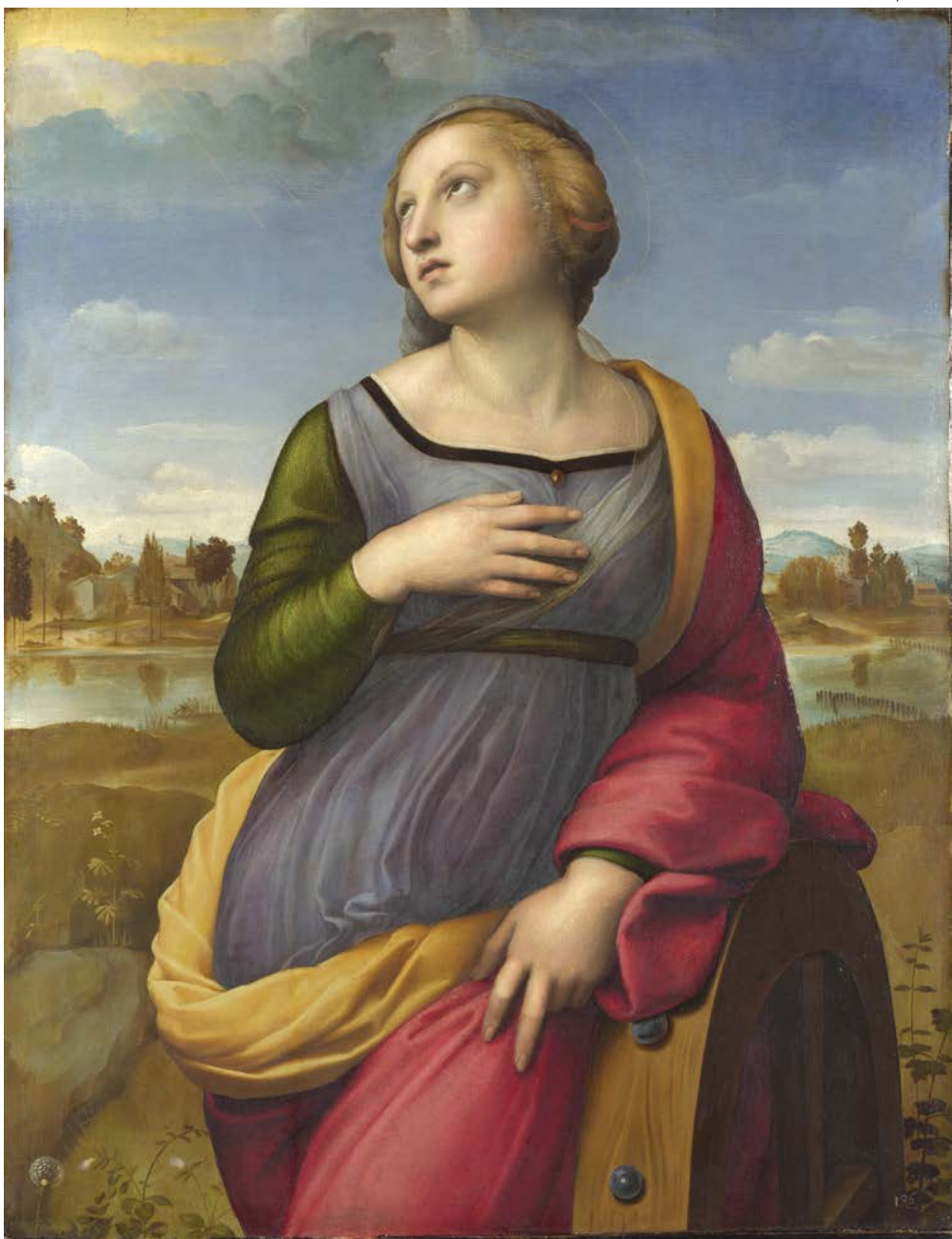
Tác phẩm "Thánh Catherine thành Alexandria", do Raphael sáng tác năm 1507. Tranh sơn dầu trên gỗ cây dương; 72 cm x 55 cm. Phòng trưng bày Quốc gia tại London.

Sức cuốn hút và tinh cách hòa hảo của Raphael thể hiện qua tất cả các biên niên sử trong cuộc đời ông. Người ca ngợi Raphael nhiều nhất là họa sĩ và nhà sử học nghệ thuật Giorgio Vasari; lúc