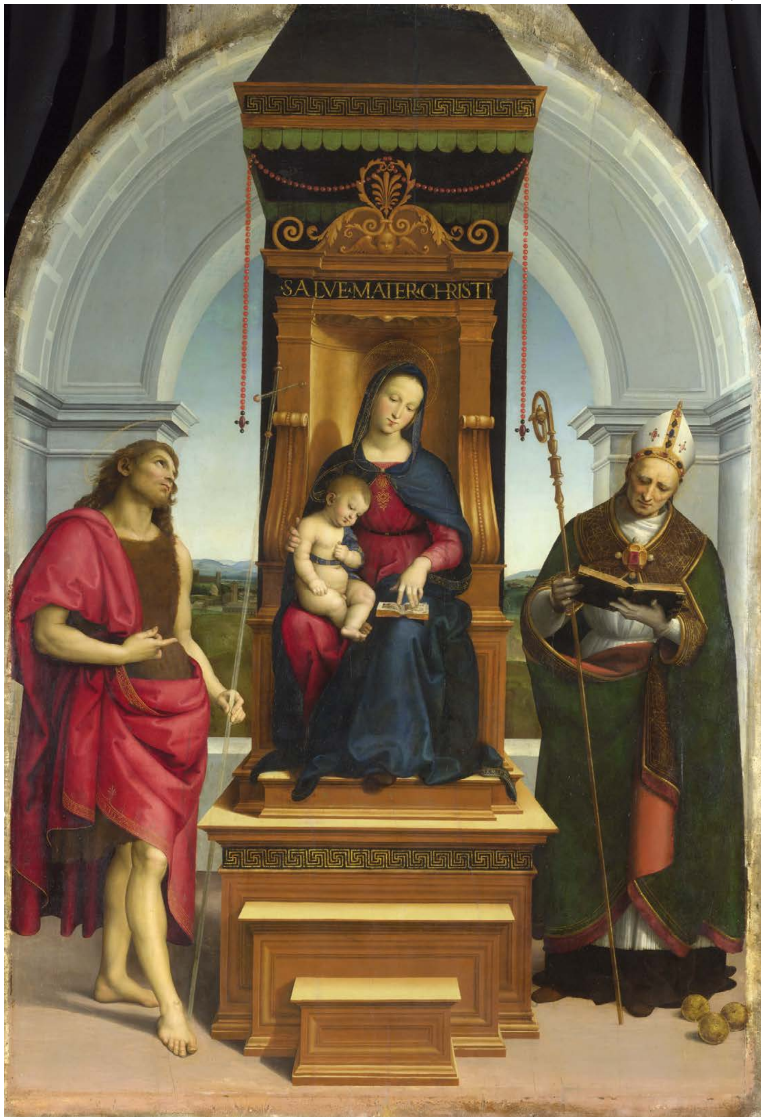
Tác phẩm "Đức Mẹ và Chúa Hải Đông cùng Thánh John Baptist và Thánh Nicholas of Bari" do Raphael sáng tác năm 1505. Tranh sơn dầu trên gỗ cây dương. 217 cm x 147 cm. Phòng trưng bày Quốc gia tại London.