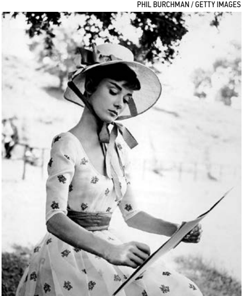
Nữ diễn viên Audrey Hepburn (1929–1993) về phác thảo trong phim “Chiến Tranh và Hòa Bình” qua đạo diễn King Vidor năm 1956.