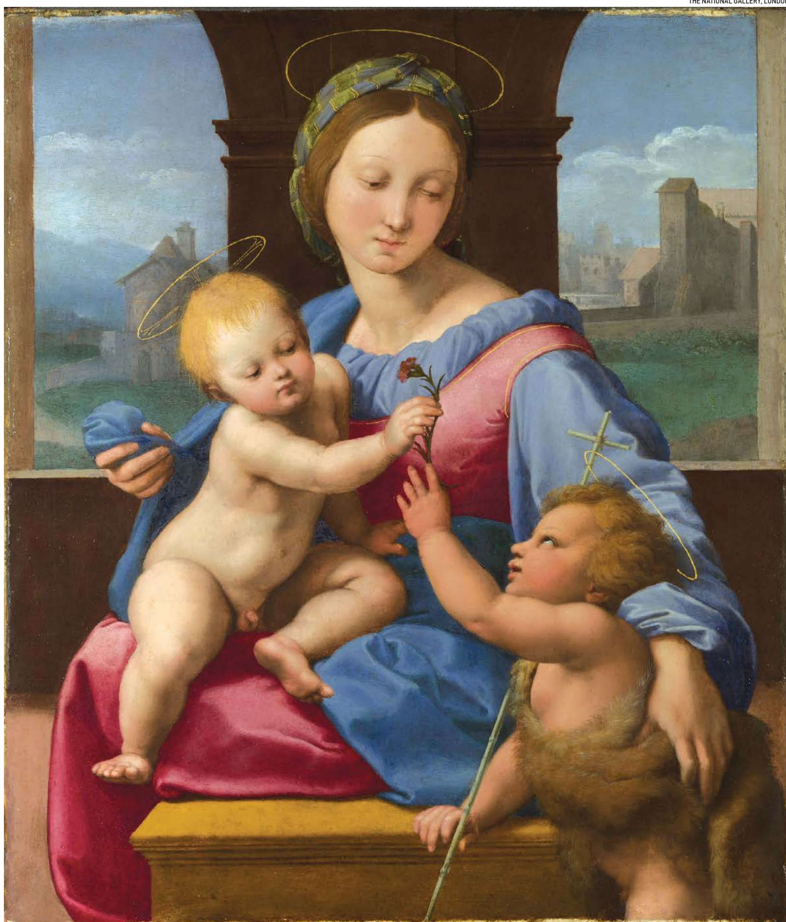
Tác phẩm "Đức Mẹ và Chúa Hài Đồng cùng Thánh Baptist lúc nhỏ", do Raphael sáng tác vào khoảng năm 1509-10. Sơn dầu trên gỗ; 38 cm x 35 cm. Phòng trưng bày Quốc gia tại London.