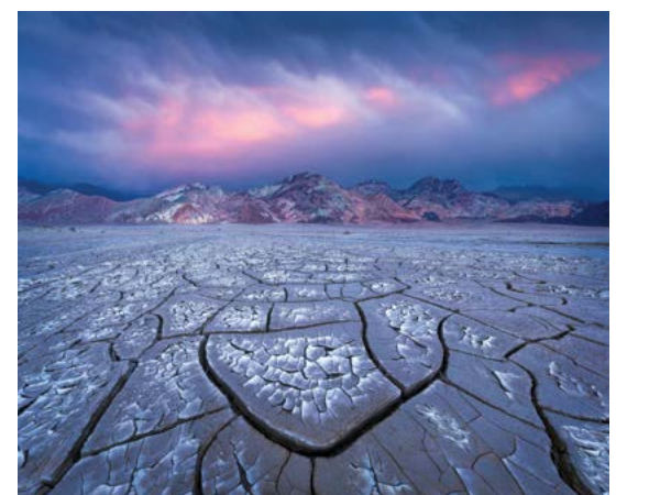
Tác phẩm “Enigma” 2017 của Erin Babnik. Ảnh chụp tại Vườn quốc gia Death Valley, California.

Cô Erin Babnik, nhiếp ảnh gia phong cảnh