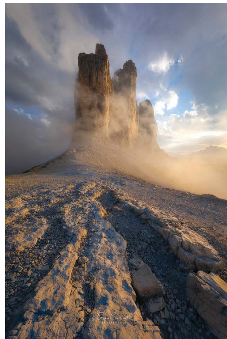
Bức ảnh “Bom tấn” 2018 của Erin Babnik. Ảnh chụp ở Dolomites của Ý.