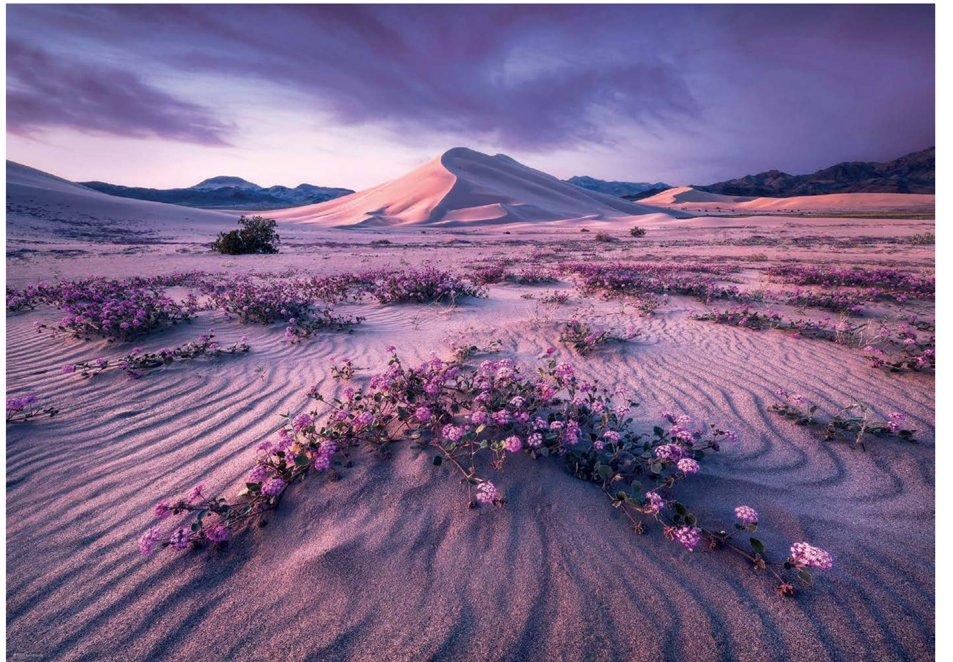
Bức ảnh “Mạnh mẽ đêm chờ” 2018 của Erin Babnik. Ảnh chụp tại Vườn quốc gia Death Valley, California.

Được truyền cảm hứng từ nghệ thuật truyền thống Cô Babnik thường xuyên được truyền cảm hứng từ nền tảng lịch sử nghệ