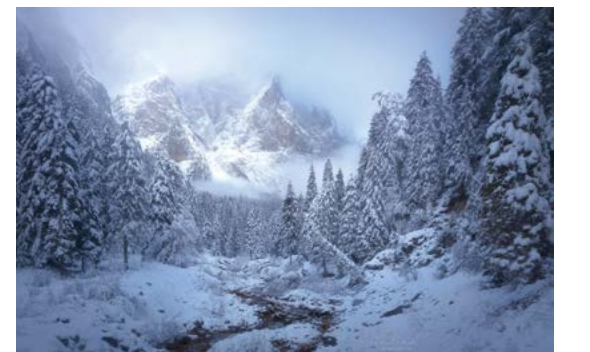
(Dưới) Bức ảnh “Hé mở huy hoàng” 2018 của Erin Babnik. Ảnh chụp ở Dolomites, Ý.

này có thể đem lại những thách thức khác biệt. Trên thực tế, một cuộc giải cứu không định trước trong chuyến đi chụp ảnh ở núi Dolomites thuộc dãy Alps, nước Ý đã giúp cô nhận được bằng khen là Người giải cứu đầu tiên nơi hoang dã.