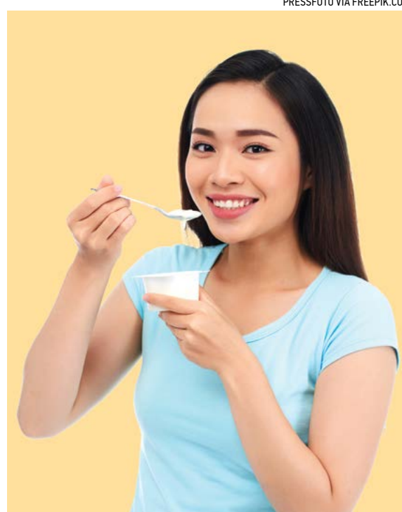
Thực phẩm lên men là một nguồn men vi sinh thơm ngon giúp chống lại độc tố và mầm bệnh.