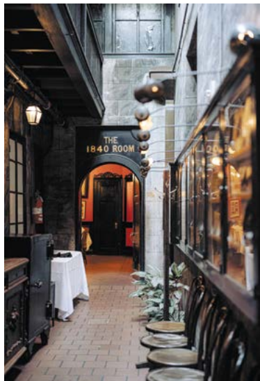
Căn phòng 1840 trong nhà hàng Antoine's.

Tại Antoine's, nhà hàng lâu đời nhất ở New Orleans, gần như mỗi từng góc nhỏ đều kể một câu chuyện. Có rất nhiều gian phòng, được trang trí bằng những vật dụng và những bức ảnh mà người ta cần lời thuyết minh. Phòng Ngục tối – tại một thời điểm trong lịch sử trước khi nhà hàng được thành lập năm 1840 – là nơi đã từng giam giữ các tù nhân trong thời kỳ Lãnh thổ Louisiana nằm dưới sự cai trị của Tây Ban Nha. Phòng Bí Ẩn được đặt tên như vậy bởi vì trong Thời kỳ Cấm Rượu ở Hoa Kỳ, những vị khách quen sẽ được phục vụ rượu "bí mật" trong một tách cà phê. Căn phòng chỉ có thể được qua một cánh cửa bí mật trong phòng vệ sinh dành cho phụ nữ. Trong bốn căn phòng được đặt theo tên Mardi Gras "krewes" – các câu lạc bộ xã hội tổ chức