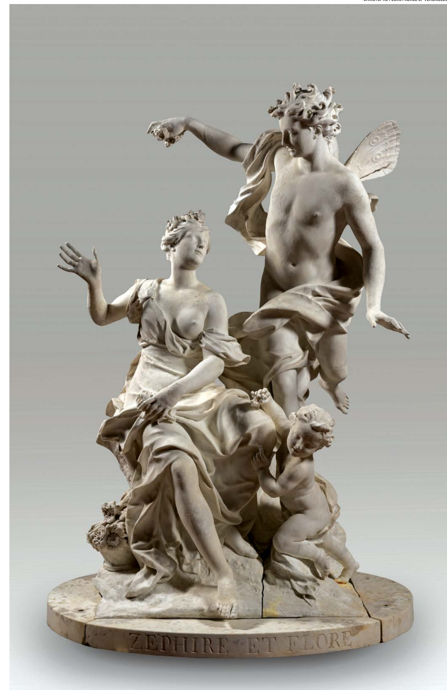
Tác phẩm “Zephyr, Flora, và Tình yêu”, do Philippe Bertrand, René Frémin, và Jacques Bousseau thực hiện năm 1769. Đá hoa cương; khoảng 212 cm x 150 cm. Cung điện Versailles.