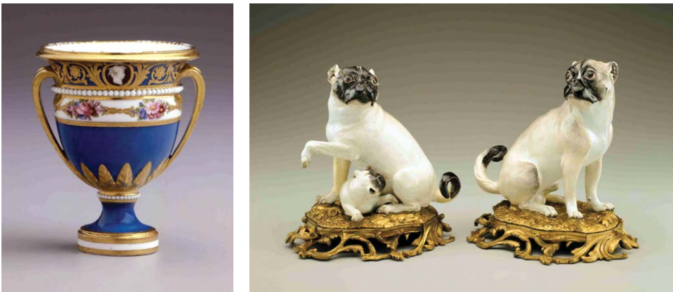
Ảnh trái: Một chiếc bình đá từ Cameo Service, khoảng năm 1779, hãng sản xuất Sèvres Porcelain Manufactory, vùng Sèvres, Pháp quốc. Chất liệu Sứ dỏ*, cao gần 9 cm. Bảo tàng nghệ thuật Hillwood Estate, Museum & Gardens; Ảnh phải: Cặp chó Pug bằng sứ cứng mạ vàng, khoảng năm 1750, của hãng Meissen Manufactory, Saxony, Đức và thành phố Paris, Pháp. Kích thước cao gần 29,5 cm. Tại viện Bảo tàng nghệ thuật Hillwood Estate, Museum & Gardens.

Người Âu Châu ngưỡng mộ sự tinh tế cũng như độ cứng của gốm sứ, là một vật liệu cứng rắn có sắc trắng mờ tự nhiên; họ gọi gốm sứ là “vàng trắng” bởi vì màu sắc trắng tinh khiết cũng như chi phí nhập cảng đắt đỏ.