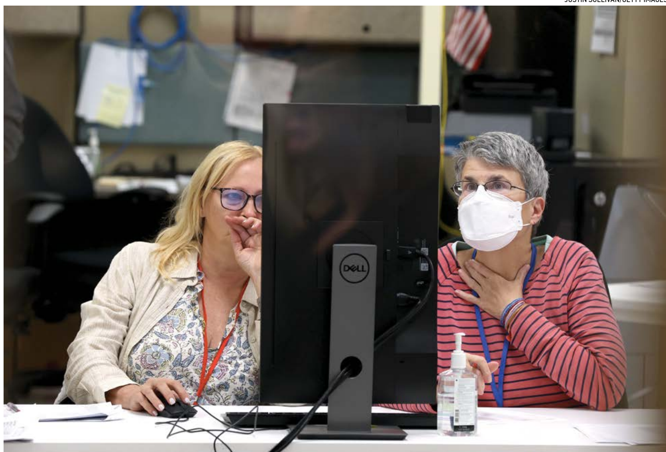
Các thành viên của hội đồng xét xử xem xét các lá phiếu tại Trung tâm Bầu cử và Nhập liệu Quận Maricopa ở Phoenix, hôm 09/11/2022.

POSTMASTER: PLEASE DELIVER PROMPTLY TIME-SENSITIVE NEWS PERIODICALS