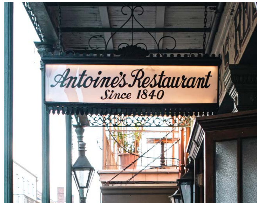
Nhà hàng Antoine's được thành lập từ năm 1840.