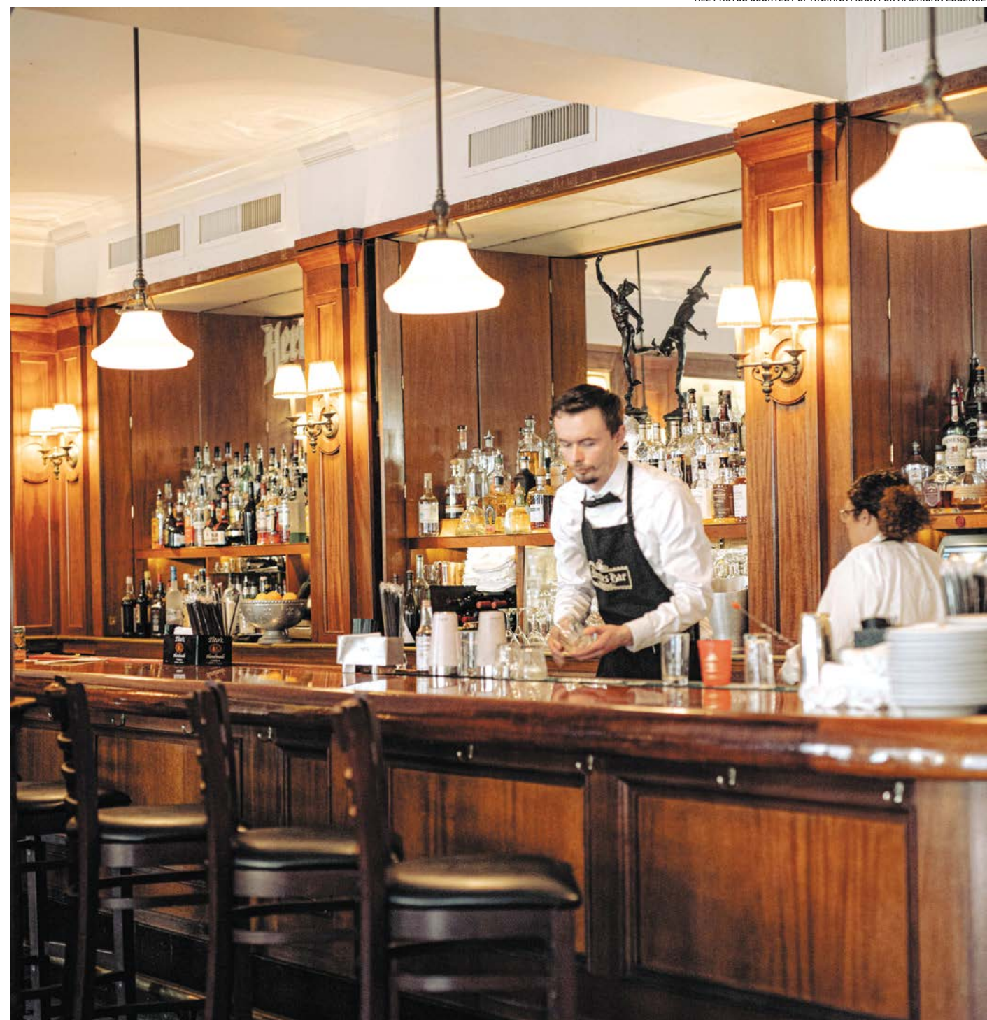
Khu vực quầy bar của nhà hàng Antoine's.