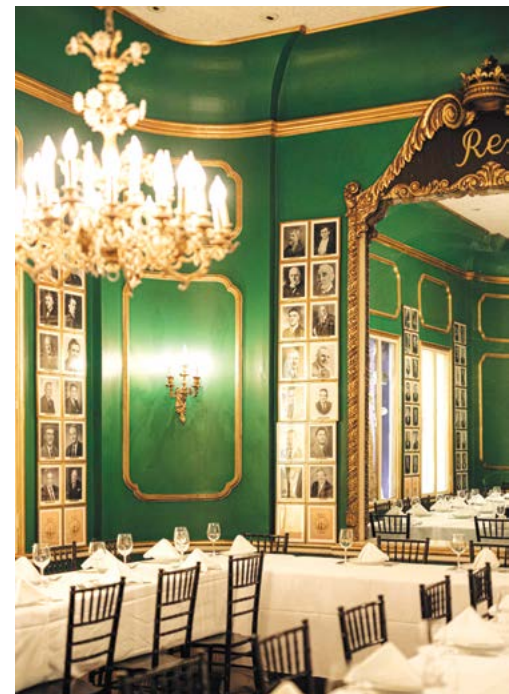
Nội thất bên trong nhà hàng.