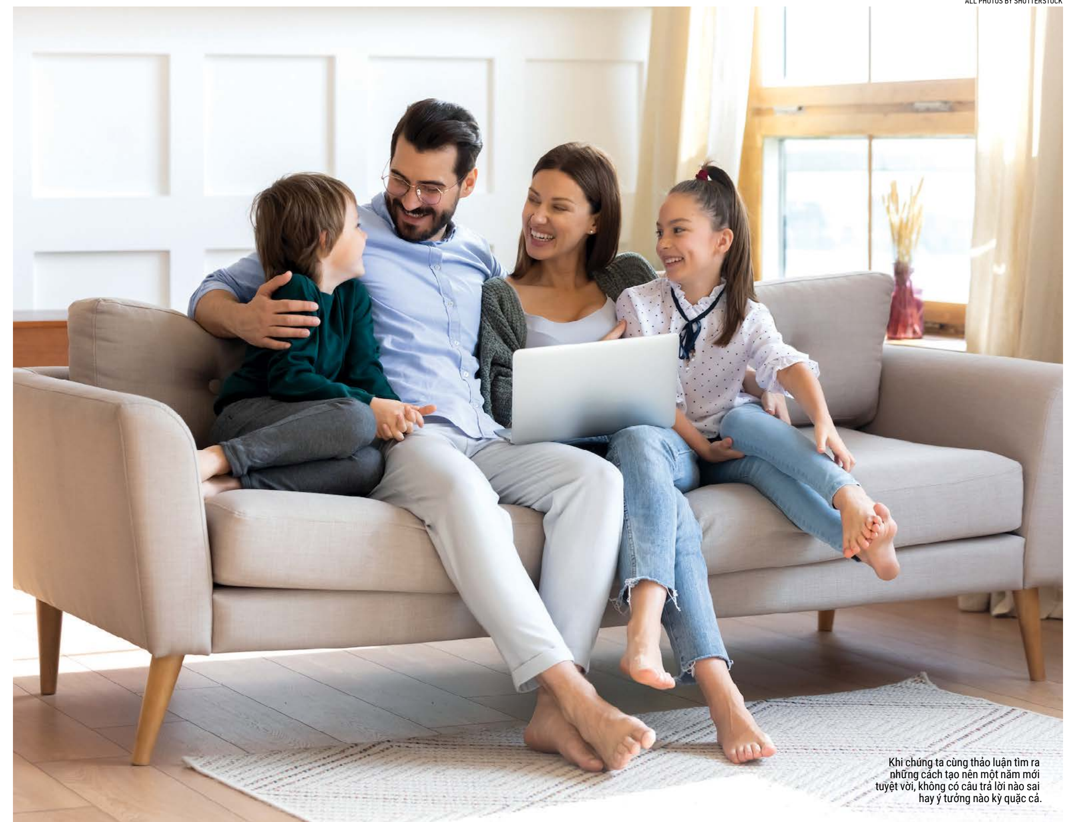
Khi chúng ta cùng thảo luận tìm ra những cách tạo nên một năm mới tuyệt vời, không có câu trả lời nào sai hay ý tưởng nào kỳ quặc cả.