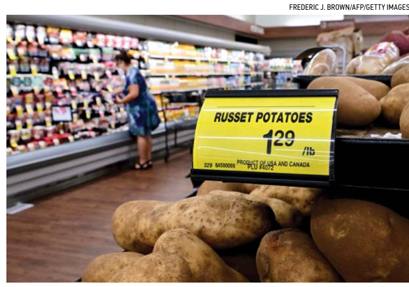
Một người mua hàng đi ngang qua tấm biển ghi giá mỗi pound khoai tây do tại một siêu thị ở Montebello, California, hôm 23/08/2022.

Andrew Moran Theo Cơ quan Thống kê Lao động, tỷ lệ lạm phát hàng năm của Hoa Kỳ đã giảm xuống 6.5% trong tháng 12/2022, từ mức 7.1% trong tháng 11/2022. Chỉ số giá tiêu dùng giảm 0.1% so với tháng trước đó. Tỷ lệ lạm phát căn bản, loại trừ các lĩnh vực năng lượng và thực phẩm biến động, đã giảm xuống 5.7% trong tháng trước, từ mức 6% trong tháng trước đó. Giá thực phẩm vẫn tăng khi chỉ số này cao hơn 10.4% so với cùng thời kỳ năm trước đó.