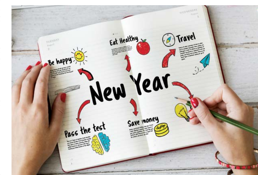
Từ những ý tưởng trên trang giấy này, bạn có thể nhận ra những danh mục nào phổ quát hơn?

Hãy thu hẹp những ý tưởng lớn xộn của bạn thành một vài danh mục chính để bạn không bị choáng ngợp và nhìn thấy những điều bạn muốn chú trọng đến.