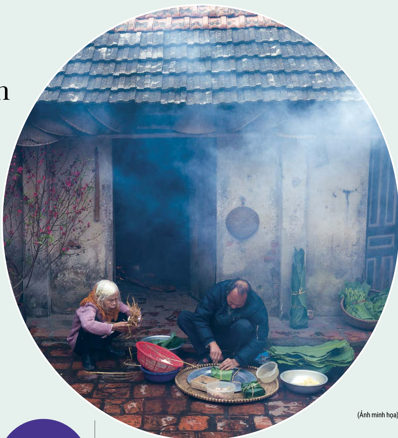
(Ảnh minh họa)

Tết đến mẹ tôi vất vả nhiều Mẹ tôi lo liệu đủ trăm chiều Sân gạch tường hoa, người quét lại Vẽ cung trĩu quý, trồng cây nều