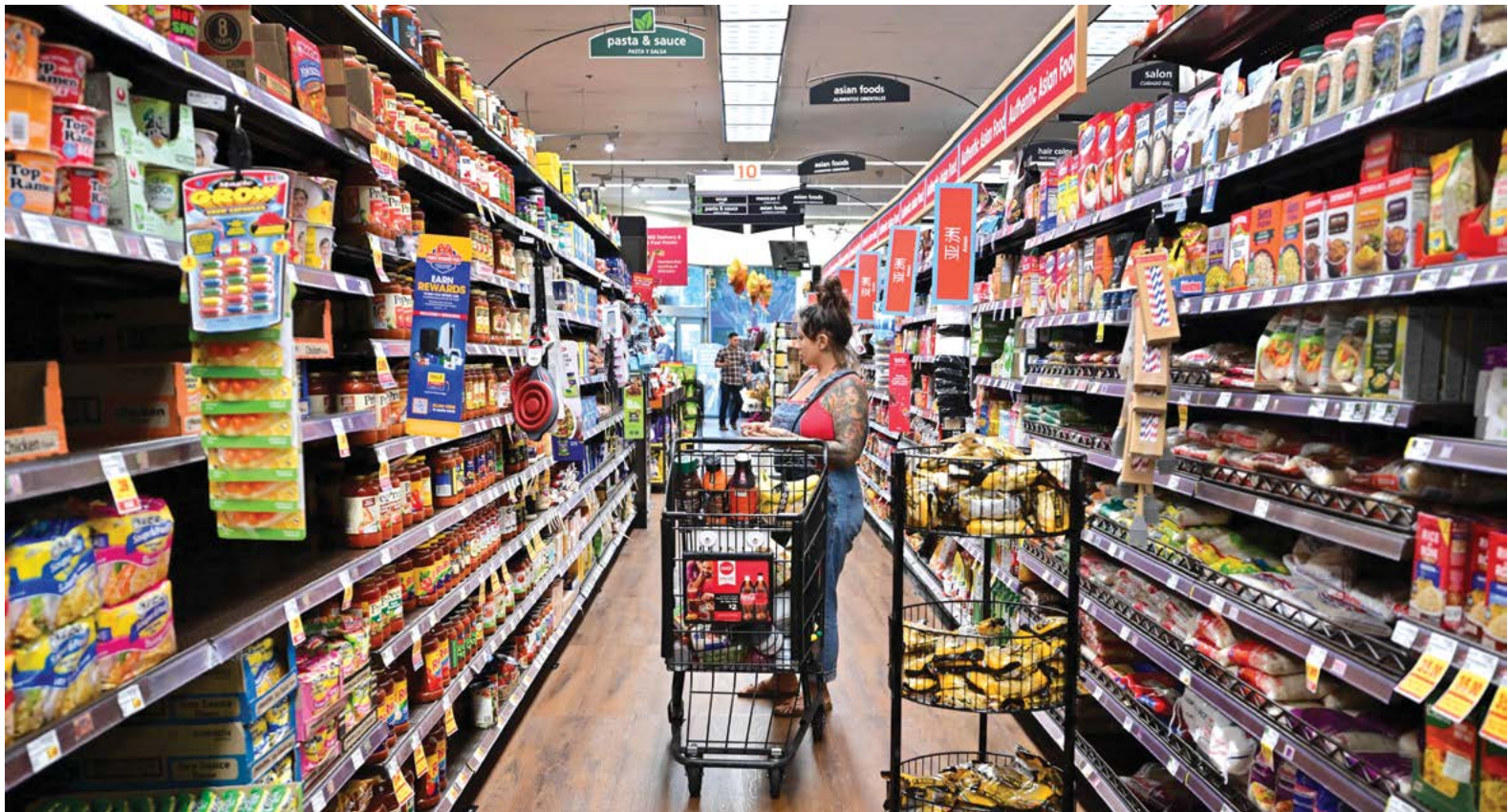
Một phụ nữ mua thực phẩm tại một siêu thị ở Monterey Park, California, hôm 19/10/2022.

Các chính sách tồi tệ nhất đã được áp dụng, và tất cả đều làm giảm tiền lương