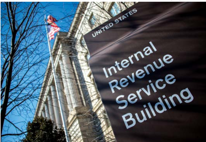
Toà nhà Sở Thuế vụ ở Hoa Thịnh Đốn trong bức ảnh tư liệu này.

Ông O’Donnell nói thêm rằng IRS đã “đào tạo hàng ngàn nhân viên mới để trả lời điện thoại và giúp đỡ người dân. Mặc dù vẫn còn nhiều việc phải làm sau vài năm khó khăn, nhưng chúng tôi hy vọng mọi người sẽ nhận được những cải thiện trong mùa thuế này. Đó mới chỉ là bước khởi đầu khi chúng tôi làm việc để tăng thêm những chuyển đổi dài hạn mới để giúp mọi thứ trở nên suôn sẻ hơn trong những năm tới. Chúng tôi rất vui mừng được bắt đầu cung cấp những gì mà người nộp thuế muốn, và nhân viên của chúng tôi