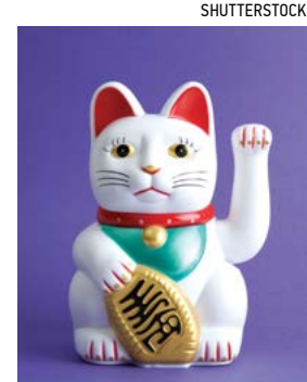
Hình tượng mèo Maneki Neko trong văn hóa Nhật Bản.

Trên thế giới hiện nay, Mèo là loại thú cưng được nhiều người yêu thích nhất, có lẽ vì sự nhỏ nhắn đáng yêu, biết chăm sóc bản thân, và biết đảm đang nuôi con chu đáo. Chúng đã được thuần hóa và xuất hiện từ rất lâu trong đời sống con người. Ban đầu, các nhà khoa học cho rằng mèo nhà phát nguồn từ Ai Cập cổ đại dựa trên những bức vẽ hình mèo có niên đại hơn ba ngàn năm trước. Tuy nhiên vào năm 2004, các nhà khoa học đã khai quật được một ngôi mộ cổ hơn nghìn năm tuổi ở Cyprus, trong đó có một con mèo và chú