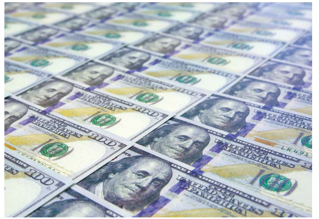
Ảnh minh họa những tờ tiền giấy 100 dollar.

Trái phiếu I (trái phiếu lạm phát) là một khoản đầu tư tốt khác trong thời