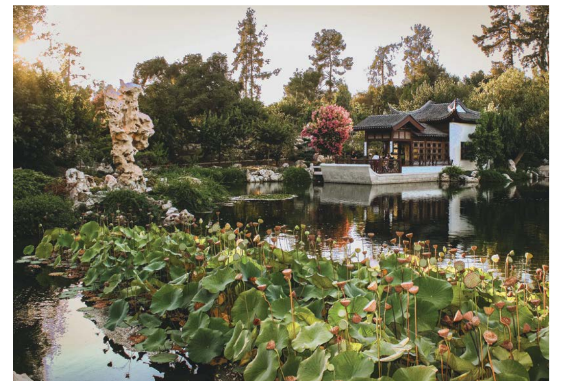
Bãi Ba Tiểu Đình là một điểm kiến trúc được thiết kế mô phỏng một con thuyền nằm bình yên trên mặt nước tĩnh lặng của Ánh Phương Hồ.