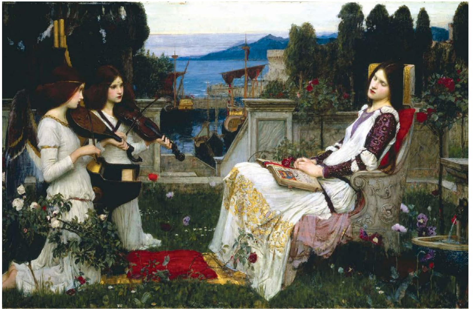
Bức tranh “Thánh Cecilia,” 1895, của John William Waterhouse. Tranh sơn dầu.

Vậy bức tranh về Thánh Cecilia của họa sĩ Waterhouse nói gì về âm nhạc? Tại sao ông miêu tả Thánh Cecilia đang ngủ với một tập nhạc đang tỏa sáng? Vì sao ông vẽ hoa hồng và hoa anh túc thay vì hoa hồng và hoa loa kèn – hai