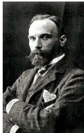
Chân dung danh họa John William Waterhouse, khoảng năm 1886.

Thiên thần quỳ dưới chân Cecilia không phải là để tôn sùng Cecilia với tư cách là Thánh nhân; họ quỳ xuống vì nàng đã thoát khỏi thế giới bằng thanh âm tôn vinh Đức Chúa; đó là một sự kiện thiêng liêng.