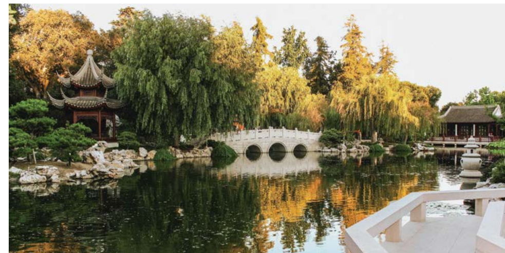
Từ cây cầu Ngự Nhạc Kiều có thể nhìn thấy khung cảnh của Ánh Phương Hồ và nhiều khu vực xung quanh vườn và hình ảnh cây cầu được phản chiếu trên mặt hồ.