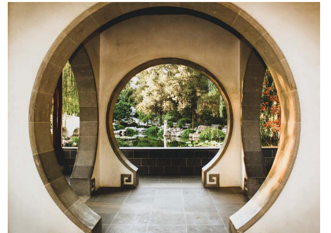
Dãy nhà Ngọc Kinh Đài là một cửa sổ và cửa chính của khu vườn với ý nghĩa kết nối với cổng vòm mặt trăng trắng.