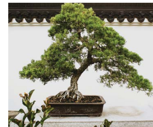
Hòn non bộ này là một phần của Thủy Linh Lung luôn đồng bộ đầy nghệ thuật trên bức Vân Tường phía sau.