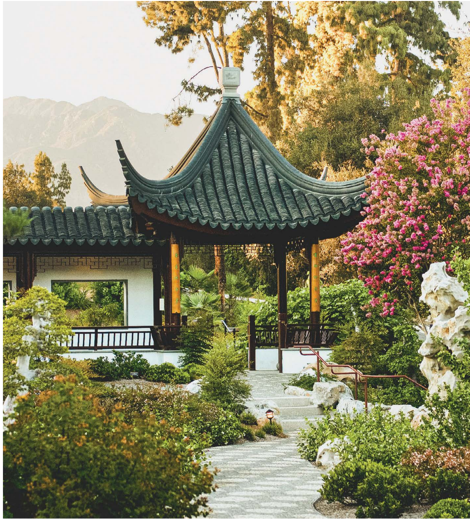
Hồ Thiên là một phần của Thủy Linh Lung, một triển lãm tự nhiên của đá Penzing và đá Thái Hồ.