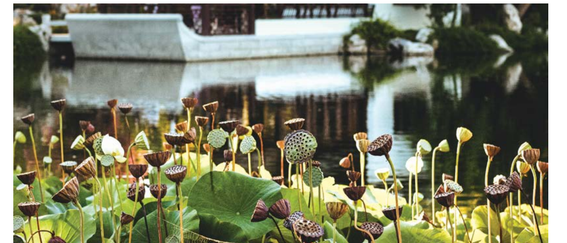
Các đài sen gieo những hạt sen xuống hồ để tiếp tục dòng đời của chúng trong Ánh Phương Hồ.