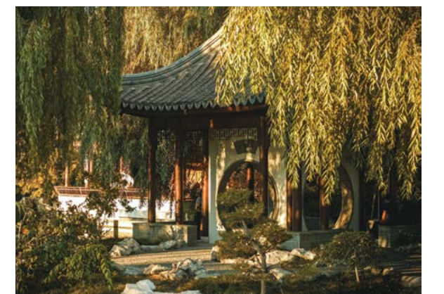
Quang cảnh bên ngoài dãy nhà Ngọc Kinh Đài (Terrace of the Jade Mirror)