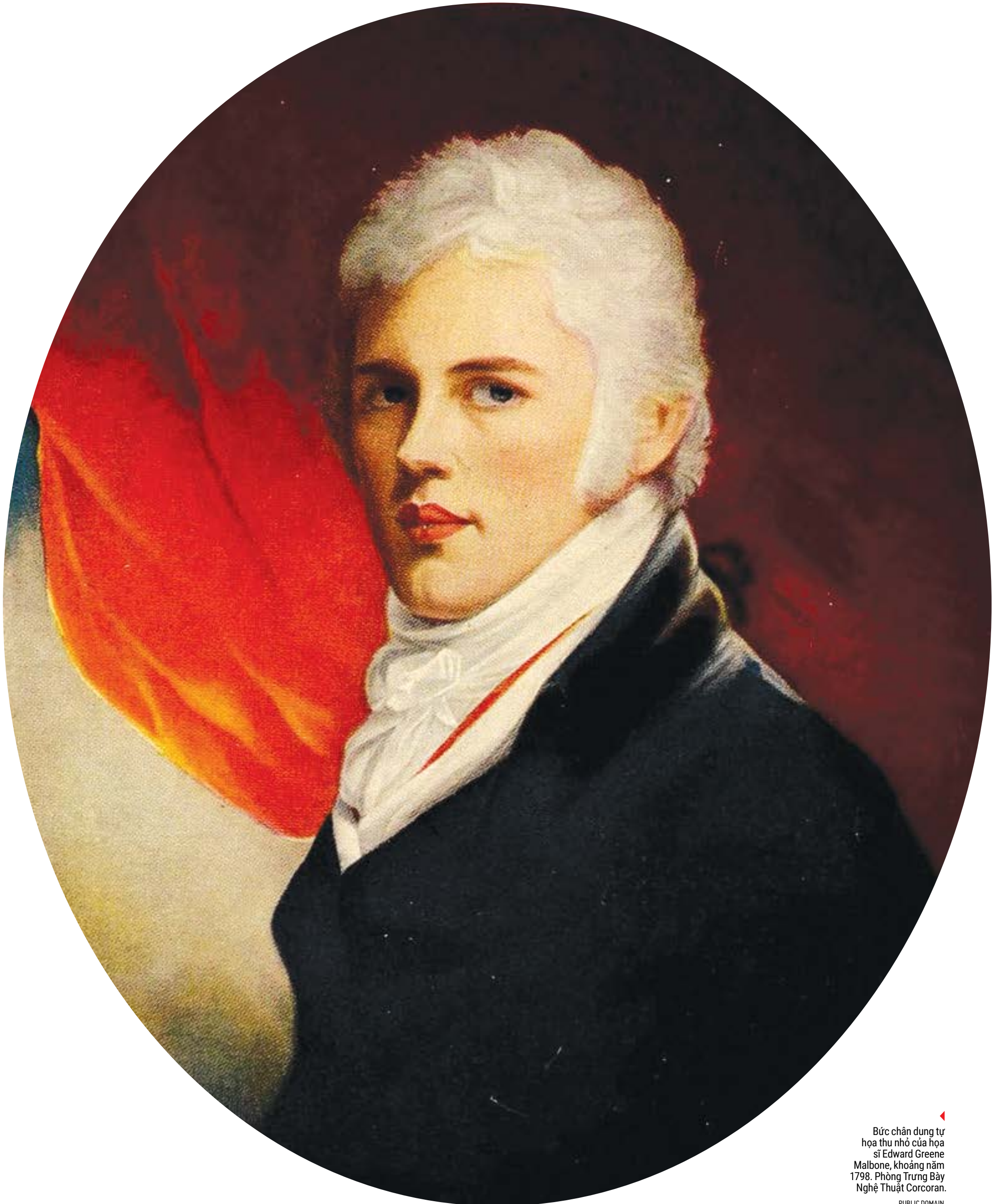
Bức chân dung tự họa thu nhỏ của họa sĩ Edward Greene Malbone, khoảng năm 1798. Phòng Trưng Bày Nghệ Thuật Corcoran.