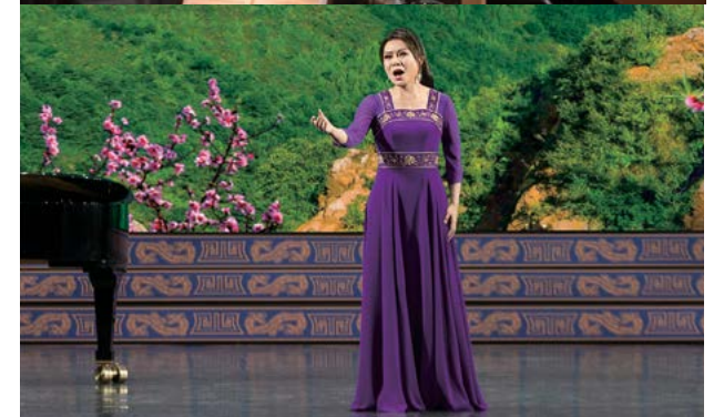
Các ca sĩ từng đoạt giải thưởng của Shen Yun được đào tạo một cách độc đáo theo phương pháp hát bel canto truyền thống nhất.