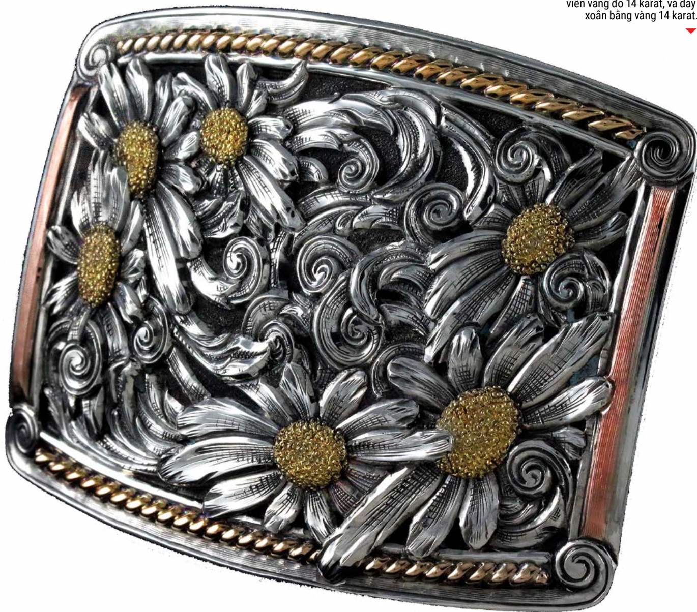
Tác phẩm của nghệ nhân bạc Scott Hardy cho Triển lãm & Bán Các Tác Phẩm Nghệ Thuật Cao Bồi Truyền Thống năm 2022 tại Bảo Tàng Di Sản Phương Tây và Cao Bồi Quốc Gia ở Thành phố Oklahoma. Chiếc thắt lưng do ông Scott Hardy chế tác trong năm 2022. Thắt lưng bằng bạc sterling với lớp phủ cuộn và bông hoa bằng bạc sterling, nhụy hoa vàng xanh 14 karat, viền vàng đỏ 14 karat, và dây xoắn bằng vàng 14 karat.

Ông Hardy đã nhớ lại những người tham dự đã rục rịch như thế nào trong