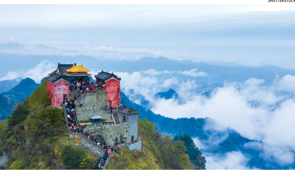
Âm nhạc Shen Yun đưa khán giả đến với dãy núi Võ Đang hùng vĩ và tươi đẹp.

Những khán giả tình y có thể nhận thấy rằng trong sự biến hóa của đội hình còn ẩn chứa vòng quay của đồ hình Thái cực, quả là vi diệu khó nói nên lời. Thái cực là một khái niệm quan trọng trong tư tưởng triết học Trung Quốc cổ đại. Âm