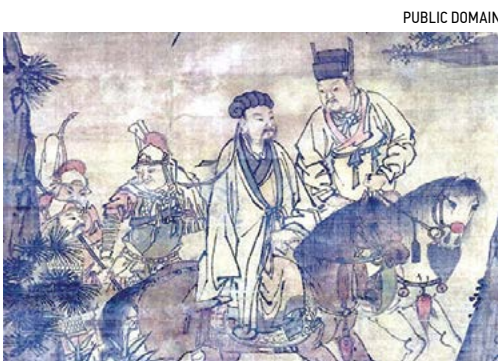
Gia Cát Lượng phát minh ra “Trâu gỗ ngựa máy” là nhờ sự giúp đỡ thần kỳ của vợ ông. Tranh “Khổng Minh xuất sơn đồ” do người thời Minh vẽ.

con cái, cảm chày già gạo, trồng dâu nuôi tằm, thầy đều không cần Gia Cát Lượng lo lắng. Bà đã trông tới 800 cây dâu, để lại gia nghiệp cho đời sau. Cách giáo dục của Hoàng Thạc đối với ba người con trai của mình nằm ở hai chữ “Trung, Hiếu”. Con trai Gia Cát Lượng là Gia Cát Chiêm từ nhỏ thông minh đỉnh ngò, sau này kế thừa tước vị của Gia Cát Lượng, vàng lỏi gia huấn, vì nước xả nghĩa, bỏ mạng trên chiến trường.