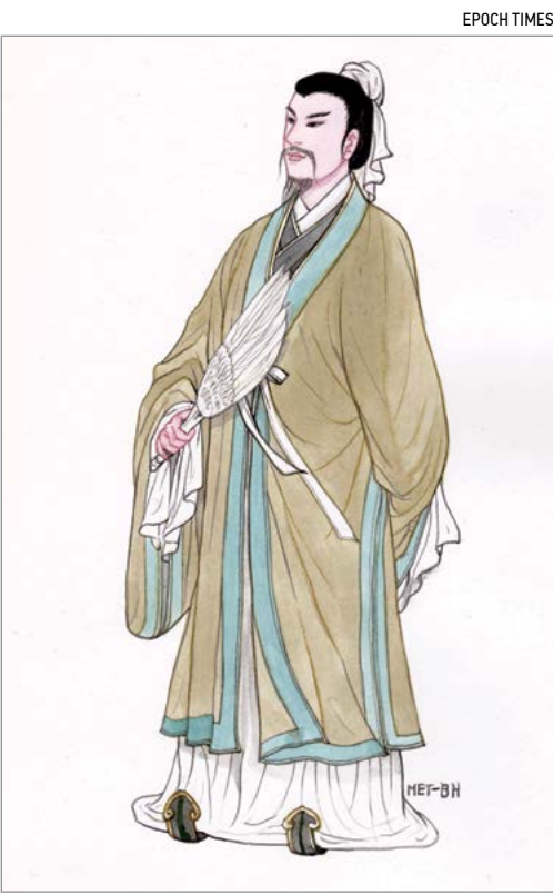
Tranh vẽ Gia Cát Lượng.

Trong “Tam Quốc Diễn Nghĩa” có miêu tả, nói rằng cô ấy có dung mạo xấu xí nhưng lại có kỹ tài, “Trên thông thiên văn, dưới tường địa lý; phạm là các sách lược binh thư, không gì không thông hiểu.” Hơn nữa còn có câu nói, “Việc học của Vũ Hưu (Gia Cát Lượng), phần nhiều