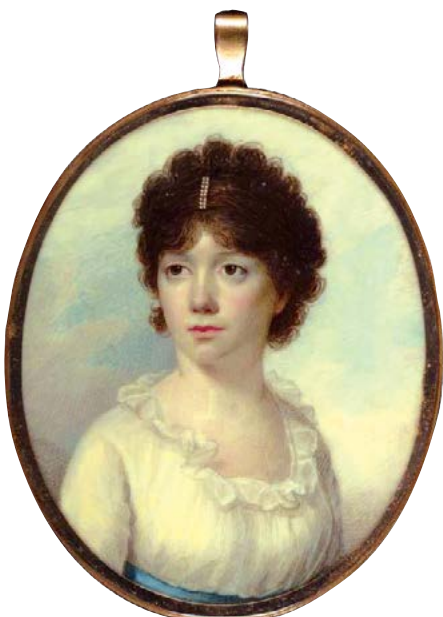
Bức chân dung tiểu họa của Bà Joseph Manigault (Charlotte Drayton), khoảng năm 1801, do họa sĩ Edward Greene Malbone thực hiện. Vẽ bằng màu nước trên ngà voi; kích thước 2 3/4 inches x 2 1/4 inches. Bảo tàng nghệ thuật Smithsonian American.

Bà Susannah Russell là một hậu duệ của các vương tộc Condé và Bourbon, cả một số vị vua nước Pháp cũng thuộc dòng dõi của bà, trong đó có Vua Louis IV.