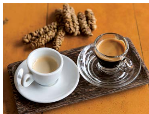
Một ly cà phê Kopi Luwak độc đáo được làm từ phân chồn có giá tới 100USD/ly.

Vì chúng ta đang nói đến vàng, nên quý vị biết mình giàu có khi quý vị có thể tin dụng vàng và các vật dụng mạ vàng khác khắp nhà của quý vị.