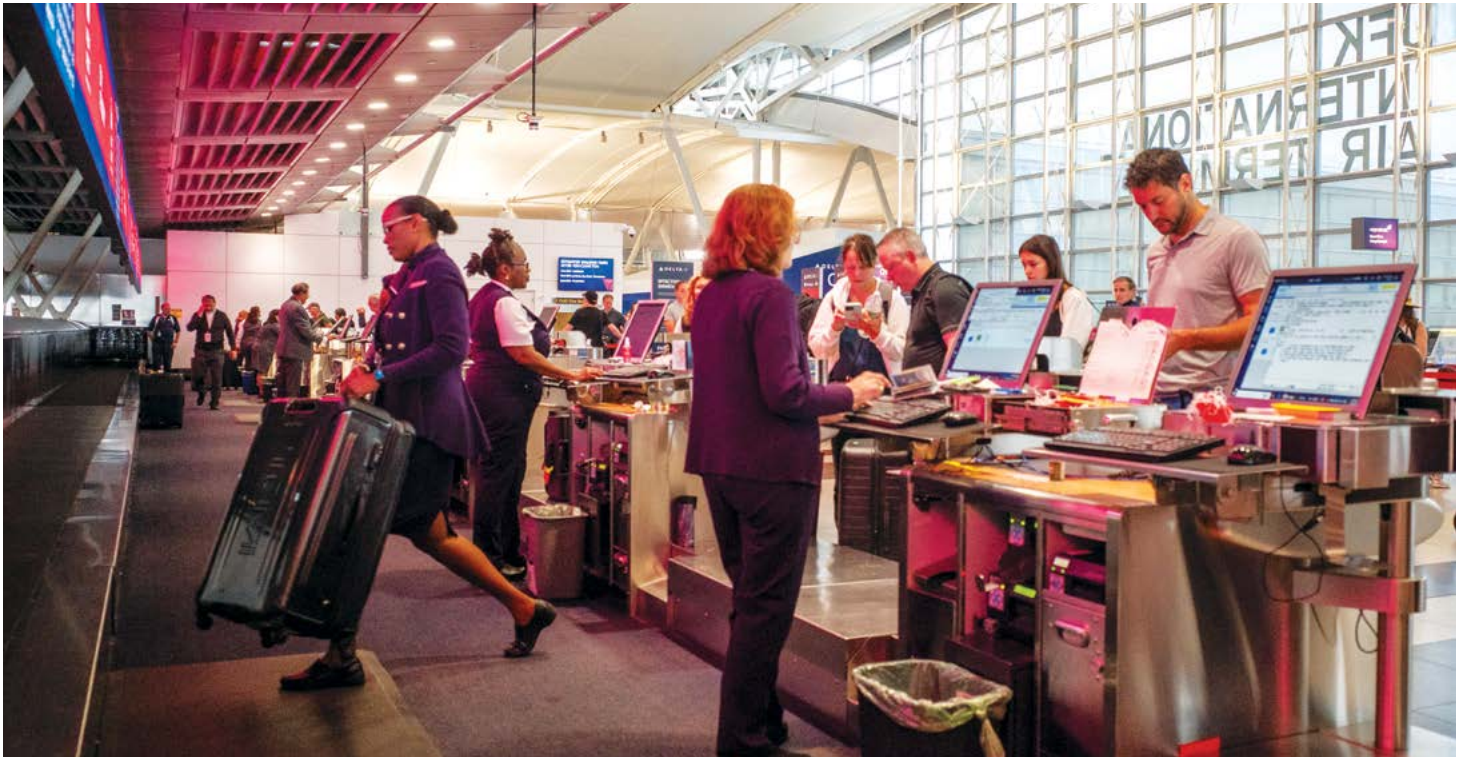
▲ Mọi người làm thủ tục tại quầy của Phi trường Quốc tế JFK, Thành phố New York hôm 30/06/2023.

Thời gian hoàn tất sổ thông hành mới đã được Bộ Ngoại giao kéo dài lần thứ ba vào tháng Ba. Du khách dự kiến sẽ phải đợi từ 10 đến 13 tuần đối với trường hợp thông thường và từ 7 đến 9 tuần cho trường hợp nhanh. Trước đại dịch, thời gian hoàn thành thông thường mất từ sáu đến tám tuần, trong khi quá trình nhanh mất từ hai đến ba tuần. Trường hợp nhanh