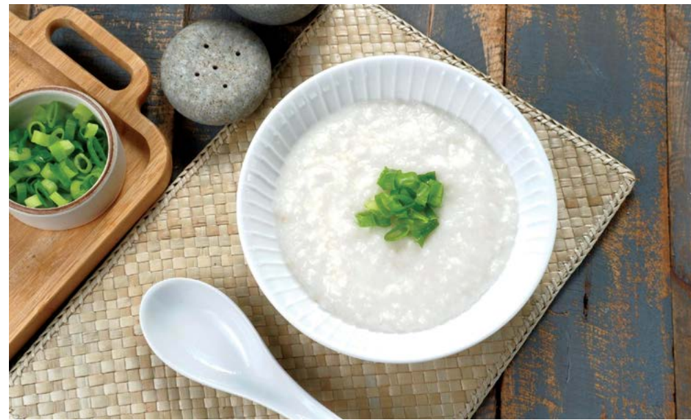
Cháo chứa nhiều enzyme có ích cho tiêu hóa.