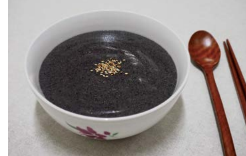
Mè đen giúp nuôi dưỡng gan và thận.

Những thực phẩm này cung cấp năng lượng bền vững cho cơ thể, ổn định đường huyết, trợ giúp tiêu hóa, nâng cao thể lực, giảm mệt mỏi.