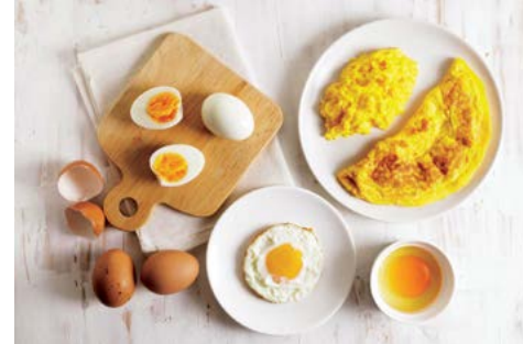
Trứng chứa protein, các loại amino acid, và chất béo.