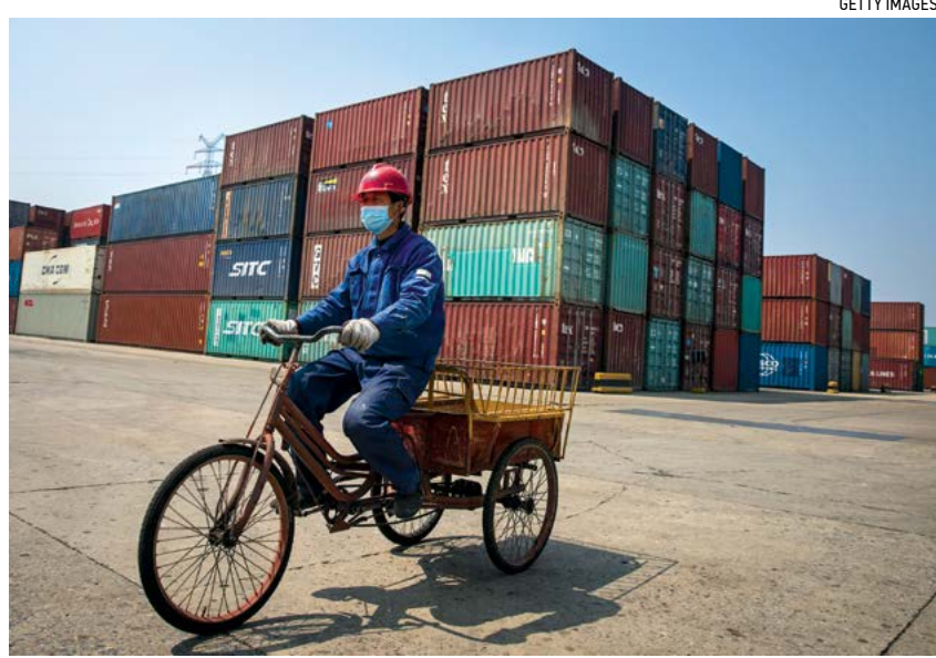
▲ Một công nhân trên xe ba bánh tại cảng container Yanglou trên sông Dương Tử tại Vũ Hán, tỉnh Hồ Bắc, Trung Quốc vào ngày 12/04/2020.

ở và những khoản vay đó không thể thu hồi được, ngành ngân hàng đang mất rất nhiều tiền và chính quyền các cấp đang cạn kiệt tiền, bởi vì các ngân hàng của Trung Quốc đều thuộc sở hữu của nhà nước,” ông Dư nói tiếp. “Khi ngân hàng gặp khó khăn, quý vị sẽ có một cuộc khủng hoảng tín dụng, và sau đó quý vị có nhiều doanh nghiệp đóng cửa hơn, và vì vậy đó là một phản ứng dây chuyền.”