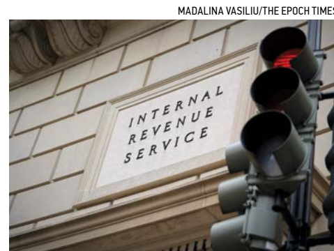
▲ Tòa nhà Sở Thuế vụ (IRS) ở Hoa Thịnh Đốn, hôm 28/06/2023.