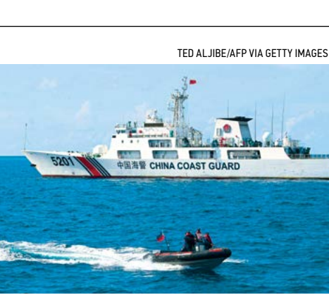
▲ Các nhân viên bảo vệ bờ biển Philippines trên chiếc thuyền bom hơi cũng tăng tốc vượt qua một tàu tuần duyên Trung Quốc sau khi tiến hành khảo sát tại Bãi cạn Second Thomas thuộc quần đảo Trường Sa ở Biển Đông đang tranh chấp, hôm 23/04/2023.

Hơn 40 tàu Trung Quốc bị phát hiện Quân đội Philippines cho biết hôm 30/06 họ đã phát hiện 48 tàu đánh cá Trung Quốc xung quanh Đảo đá Khúc Giác, phía nam Bãi Cỏ Rong – một rạn san hô giàu dầu khí nằm trong vùng đặc quyền kinh tế của Philippines.