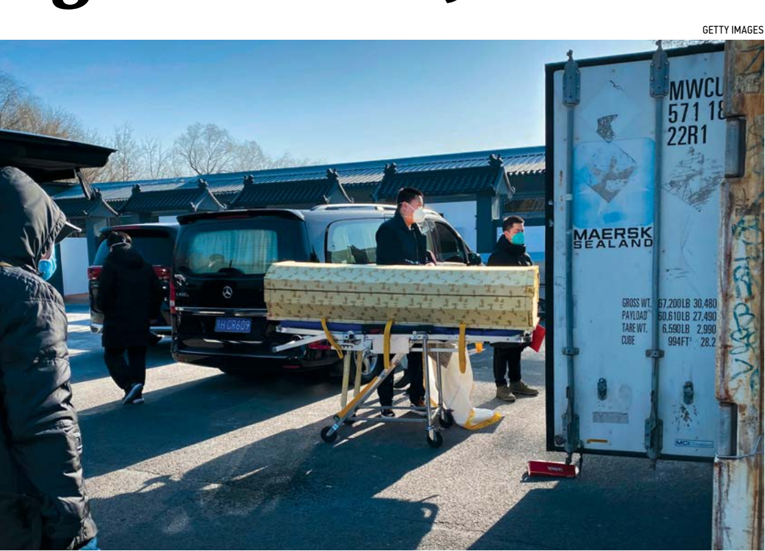
▲ Một chiếc quan tài được đưa từ xe tang vào container đông lạnh bảo quản thi thể tại nhà tang lễ và trung tâm hỏa táng Đông Giao, một trong số những nơi chuyên giải quyết các ca nhiễm COVID-19 tại thành phố Bắc Kinh, Trung Quốc, ngày 18/12/2022.

Hai người họ hàng sống trong một ngôi làng địa phương cũng đã qua đời