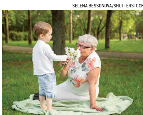
Tình yêu thương là vì tha và là lời kêu gọi những phần đức hạnh nhất của chúng ta thể hiện và phụng sự.

Khi người bán hàng hành xử thô lỗ, khi con của bạn ở tuổi thiếu niên