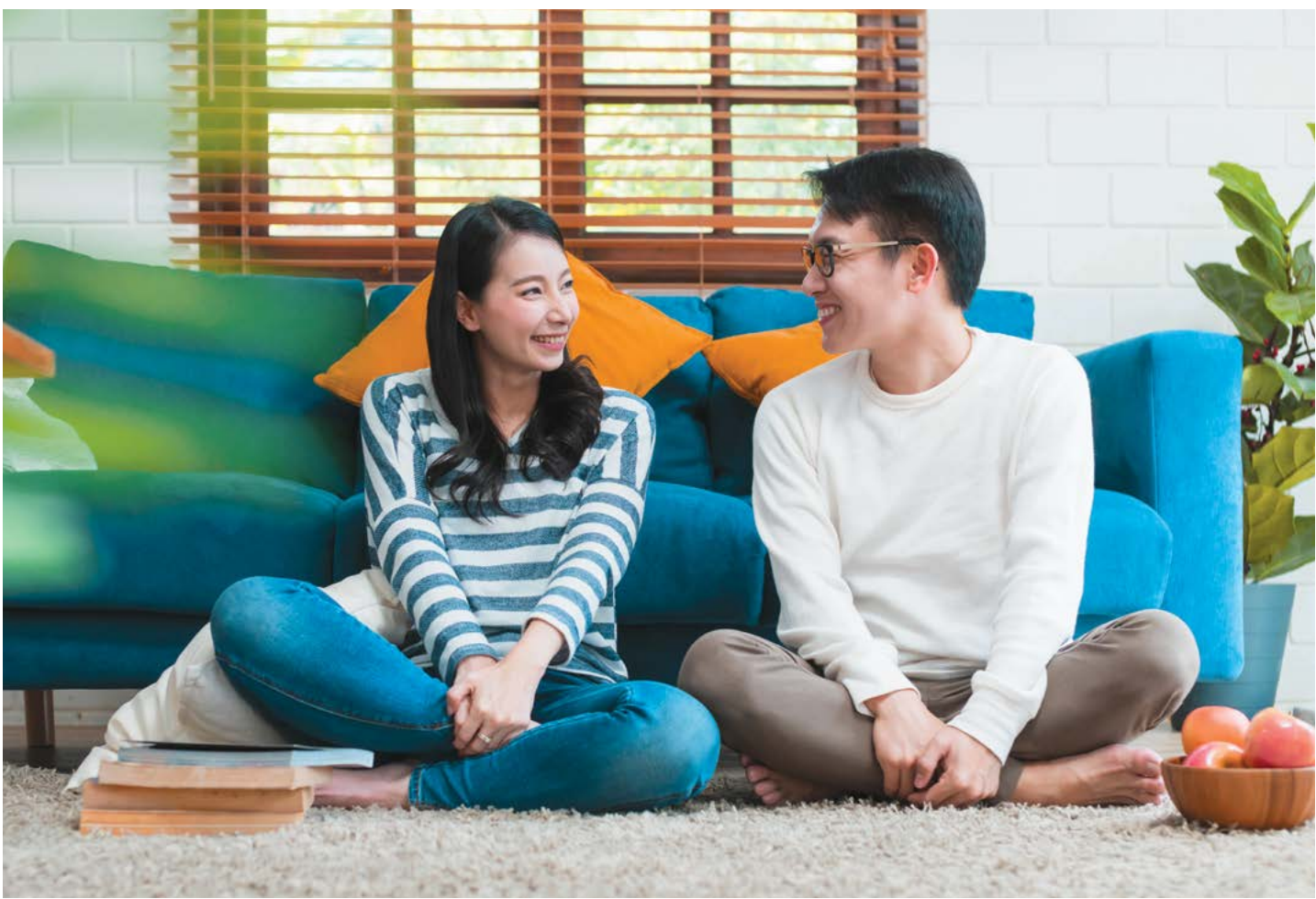
Vợ chồng hiểu nhau, khi xúc động nên lui một bước, bình tĩnh rồi lại giao tiếp thì tình cảm mới có thể bền lâu.

Hại vị giáo sư này cho biết, “Khi chúng tôi làm việc với những cặp đôi đang tranh cãi và không đạt được tiến triển nào, chúng tôi thường khuyên họ ngừng tranh cãi và lập một kế hoạch để có thể giao tiếp tốt và có hiệu quả. Mỗi người hãy viết ra những vấn đề hoặc hành vi của đối phương (hoặc bản thân mối quan hệ)