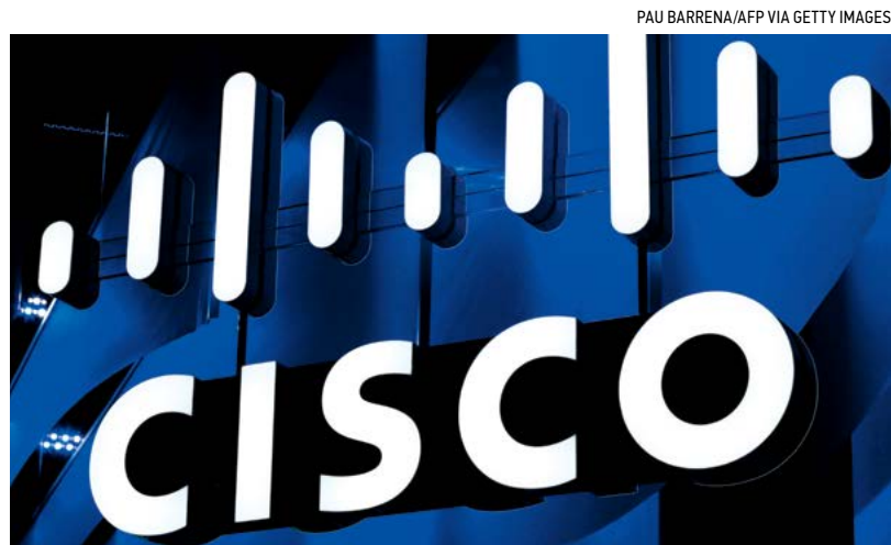
▲ Logo của Cisco tại Hội nghị Thế giới Di động (MWC) ở Barcelona vào ngày 26/02/2018.