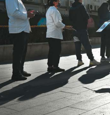
▲ Một nhân viên kiểm soát dịch bệnh yêu cầu mọi người quét mã sức khỏe của họ khi xếp hàng chờ xét nghiệm COVID-19 tại một địa điểm xét nghiệm công cộng ở Bắc Kinh vào ngày 15/11/2022.

Hai người họ hàng sống trong một ngôi làng địa phương cũng đã qua đời