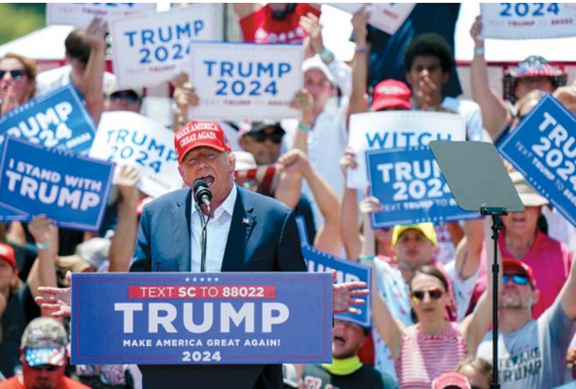
▲ Cựu Tổng thống Donald Trump đến sự kiện vận động tranh cử ở Pickens, South Carolina, hôm 01/07/2023.

"Trường hợp đặc biệt này đặt ra một thách thức nghiêm trọng đối với cả thực tế và nhận thức về nền dân chủ Mỹ của chúng ta," các luật sư viết. "Tòa hiện chủ tọa một vụ truy tố do chính phủ của một Tổng thống đương nhiệm đưa ra