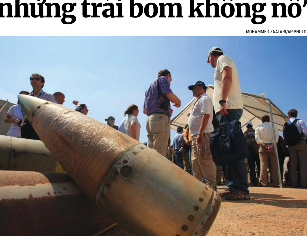
▲ Các nhà hoạt động và phái đoàn quốc tế đứng cạnh các đơn vị gỡ bom chùm trong một bức ảnh tư liệu.

tương tự để biện minh cho việc cung cấp đạn dược này, và sau đó ông Kahl giải thích thêm.