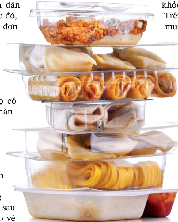
Lúa mì phổ biến trong chế độ ăn uống phương Tây. Mặc dù điều đó tốt cho nhiều người, nhưng ngày càng có nhiều người gặp phải tình trạng không dung nạp gluten.

Con người chúng ta đã quá xa rời nguồn thực phẩm dồi dào dưỡng chất, không có thuốc trừ sâu, và càng lạc lối thì càng gặp nhiều vấn đề sức khỏe.