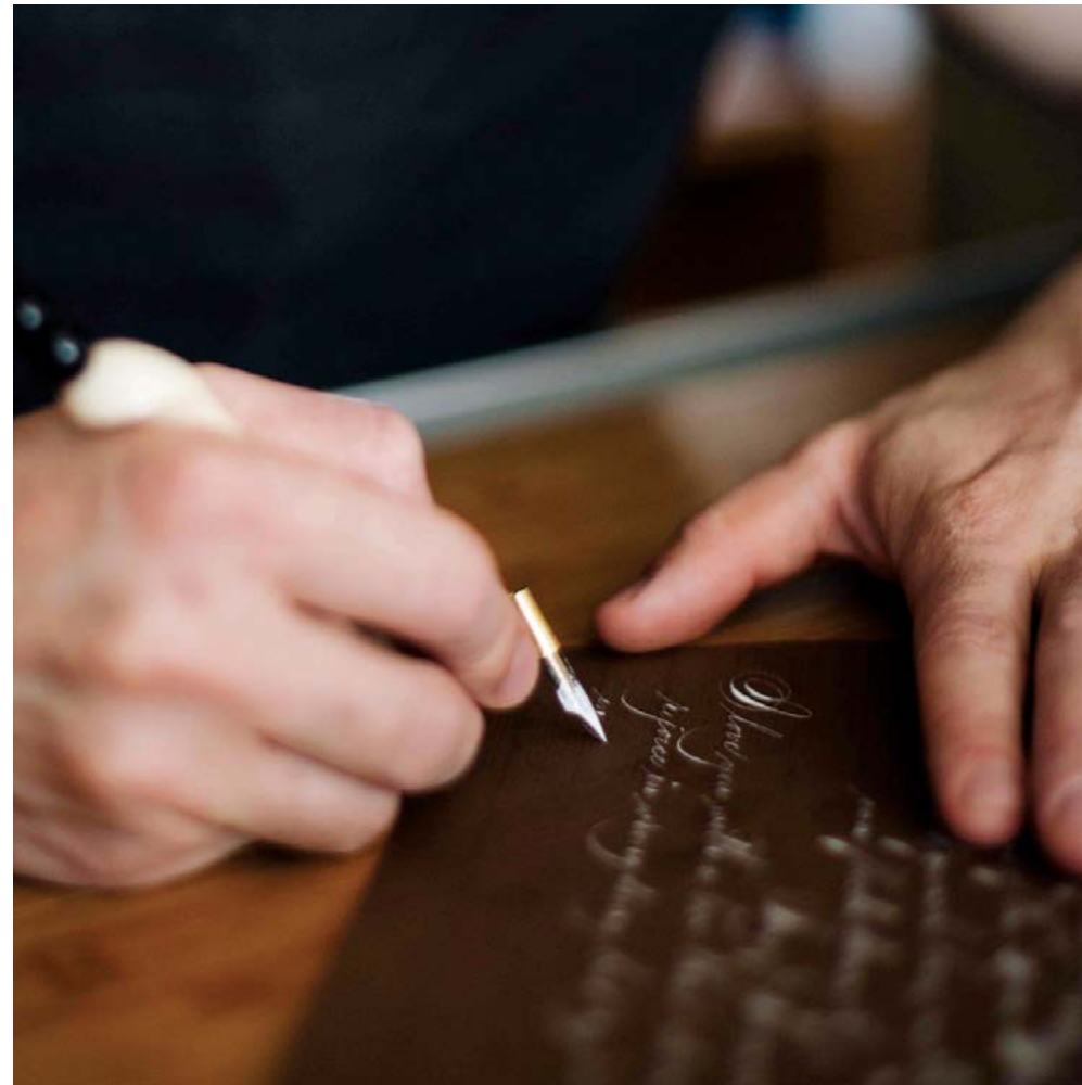
Thư pháp khi đạt đến hình thức cao nhất chính là một môn nghệ thuật, và anh Weidmann là một trong số ít những người trên toàn thế giới thành thạo về lĩnh vực này.