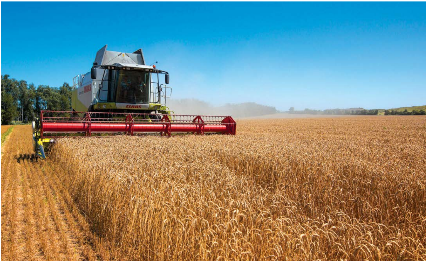
▲ Máy gặt đang thu hoạch lúa mì ở Ukraine trong một bức ảnh tư liệu.

Hãy tua nhanh đến 75 năm sau, và chúng ta thấy rằng một cuộc bạo loạn lớn trong Nội chiến Hoa Kỳ, được gọi là Cuộc bạo loạn Bánh mì Richmond,