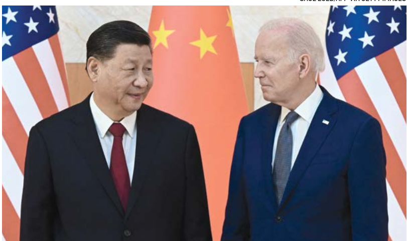
▲ TT Joe Biden (phải) và lãnh đạo Trung Quốc Tập Cận Bình gặp nhau bên lễ Hội nghị Thượng đỉnh G20 ở Nusa Dua trên đảo nghỉ dưỡng Bali của Indonesia vào ngày 14/11/2022.