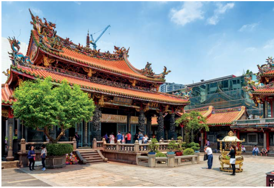
Chùa Long Sơn ở Đài Bắc, Đài Loan.

Trong “Thuyết văn giải tự”, hàm nghĩa của “Tự” (寺) là: “Tự, đình dã, hữu pháp độ giả dã” (Tạm dịch: Tự, cũng là đình, là nơi có phép tắc khuôn mẫu); hoặc là “Tự, trj dã, quan xá dã” (Tạm dịch: Tự, là trụ sở, nơi ở của quan lại). Tại Trung Quốc cổ đại, “tự”