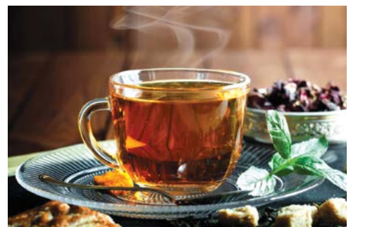
Để giúp đầu óc tỉnh táo, bạn có thể thay thế cà phê bằng các loại trà.