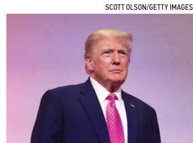
▲ Cựu Tổng thống Donald Trump ở Novi, Michigan, hôm 25/06/2023.

Ông Trump đã không nhận tội và khẳng định rằng vụ kiện