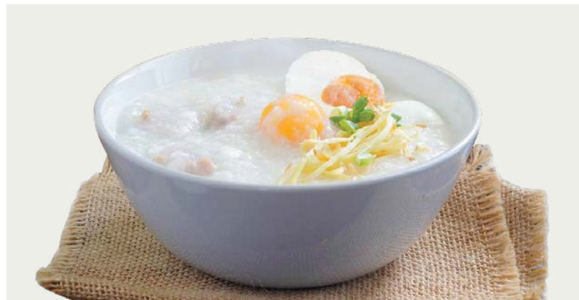
Có một bữa sáng bổ dưỡng là yếu tố cần thiết để đánh thức cơ thể.