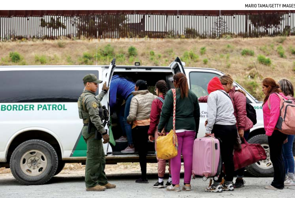
▲ Một nhân viên Bảo vệ Biên giới Hoa Kỳ đưa những người nhập cư bất hợp pháp về một chiếc xe để chuyển đến một nơi khác, tại San Diego, California hôm 13/05/2023.

Báo cáo cũng nhắc đến lời khai của một nhân viên Tuần tra Biên giới tại trung tâm giải quyết người nhập cư ở Yuma. Nhân viên này cho biết anh và các đồng nghiệp của mình lúc đó đang cố gắng hỏi anh các thủ điện tử từ Trung tâm Nhầm mục tiêu Quốc gia của CBP nhưng không thể làm được vì họ quá bận giải quyết một lượng lớn người nhập