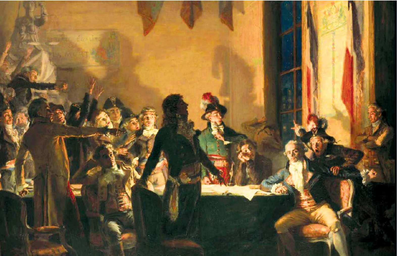
“Cách mạng Pháp. Ông Saint-Just và ông Robespierre tại Tòa thị chính Paris vào đêm 09 rạng sáng ngày 10 Thermidor năm II (lịch Cách mạng Pháp, tức ngày 27 đến 28/07 năm 1794)”, tranh sơn dầu trên vải canvas của Jean-Joseph Weerts, năm 1897.

ban hành Luật 22 Prairial (được ban hành vào tháng Prairial theo lịch Cách mạng Pháp) khét tiếng. Đạo luật này đưa ra một danh sách mở rộng về “kẻ thù của nhân dân”, những người bị trừng phạt bằng án tử mà gần như không có quyền kháng cáo. Sáu tuần sau đó, đường phố khắp Paris chìm trong biển máu. Sau đó, khi sự hỗn loạn lên đến đỉnh điểm, cuộc cách mạng này đột nhiên tiêu diệt, cuộc cách mạng này đột nhiên tiêu diệt; hai thành viên quyết liệt nhất. Ông Robespierre và ông Saint-Just bị bắt vào ngày 27/07 và bị hành quyết vào ngày hôm sau. Lúc đó, ông Robespierre 36 tuổi và Saint-Just mới chỉ 26 tuổi.