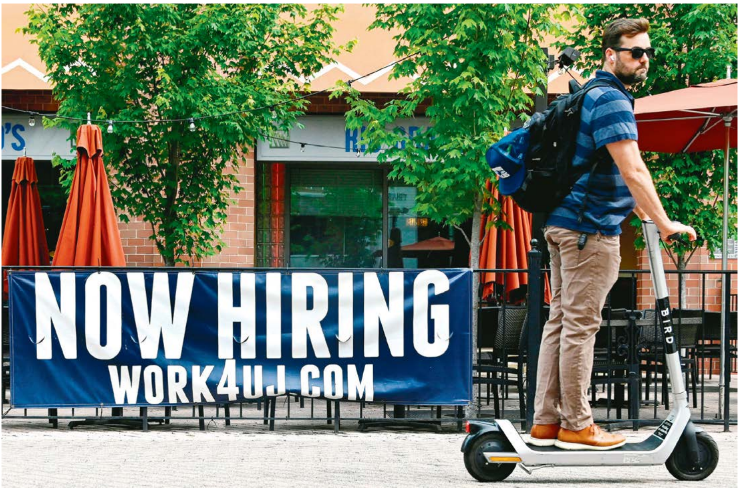
▲ Một người đàn ông đi qua tấm biển "Đang tuyển dụng" được dán bên ngoài một nhà hàng ở Arlington, Virginia vào ngày 03/06/2022.

Trong những tháng gần đây, các chuyên gia thị trường đã nhận xét về sự sụt giảm chung của các công việc tạm thời, cảnh báo rằng nếu mức việc làm giảm xuống dưới 3 triệu, thì đó có thể là dấu hiệu đáng lo ngại. Trong lịch sử, sự sụt giảm đáng kể ở khu vực này của đầu trường lao động thường xảy ra trước các cuộc suy thoái.