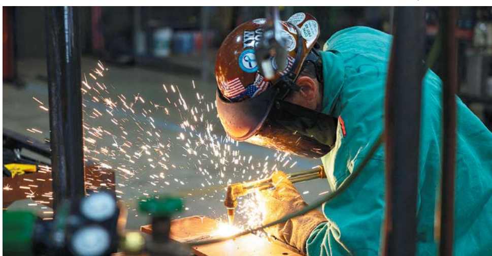
▲ Một người đàn ông đang làm việc ở Dayton, Ohio, vào ngày 24/10/2022.

"Khi chúng tôi công bố Ngân sách cho Tài khóa 2024 của Tổng thống, chúng tôi tự hào về các khoản đầu tư theo sứ mệnh mà ngân sách này tạo ra cho tài sản quan trọng nhất của chính phủ liên bang – các nhân viên của chúng tôi."