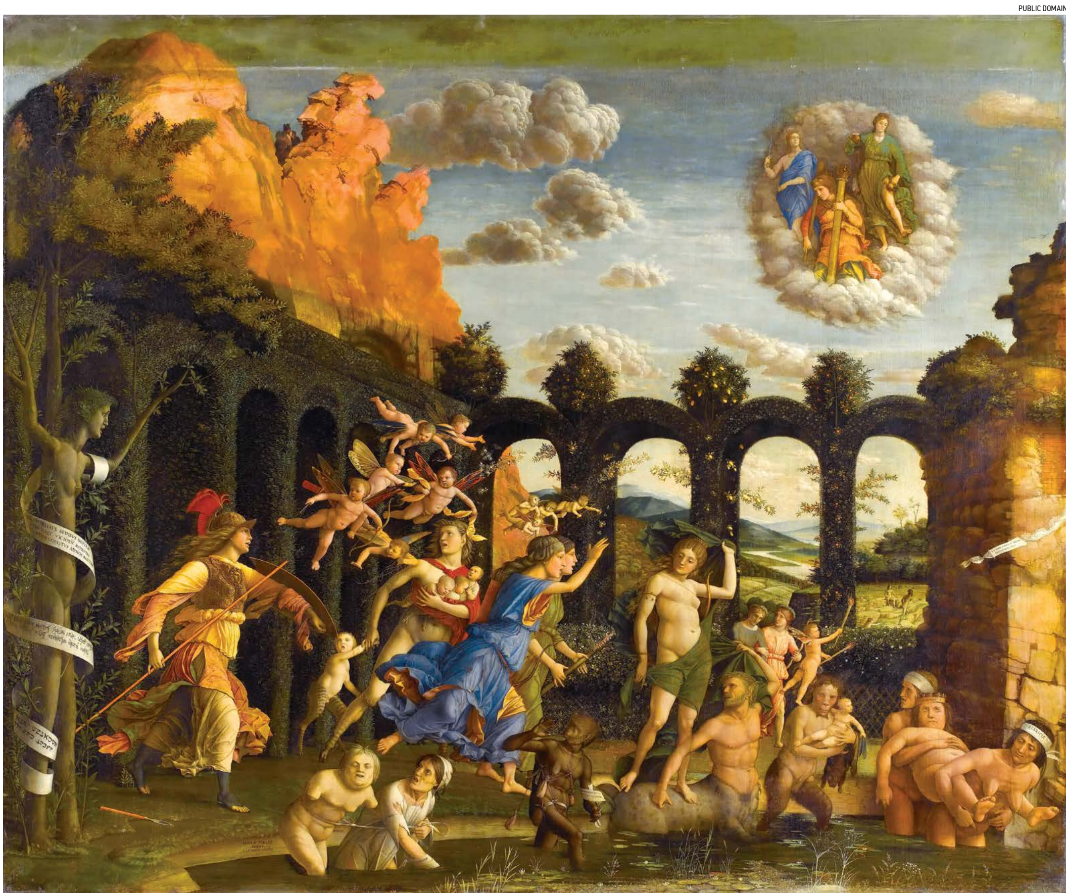
▲ Bức tranh của họa sĩ Mantegna khích lệ chúng ta từ bỏ những thói hư tật xấu để đức hạnh có thể phát triển. Tác phẩm "Minerva Expelling the Vices from the Garden of Virtue" (Nữ Thần Minerva đuổi các Thói xấu khỏi Khu vườn Đức hạnh) của họa sĩ Andrea Mantegna, khoảng năm 1502. Tranh Sơn dầu trên vải canvas, kích thước 5.25 feet x 6.3 feet. Viện bảo tàng Louvre.