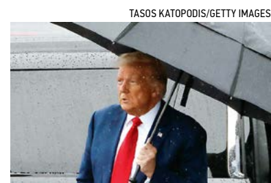
▲ Cựu TT Donald Trump sau phiên tòa buộc tội tại tòa án Hoa Thịnh Đốn ở Arlington, Virginia, hôm 03/08/2023.

Một chuyên gia pháp lý nói với The Epoch Times rằng việc dùng đại bồi thẩm đoàn trong một khu vực tài phán để truy