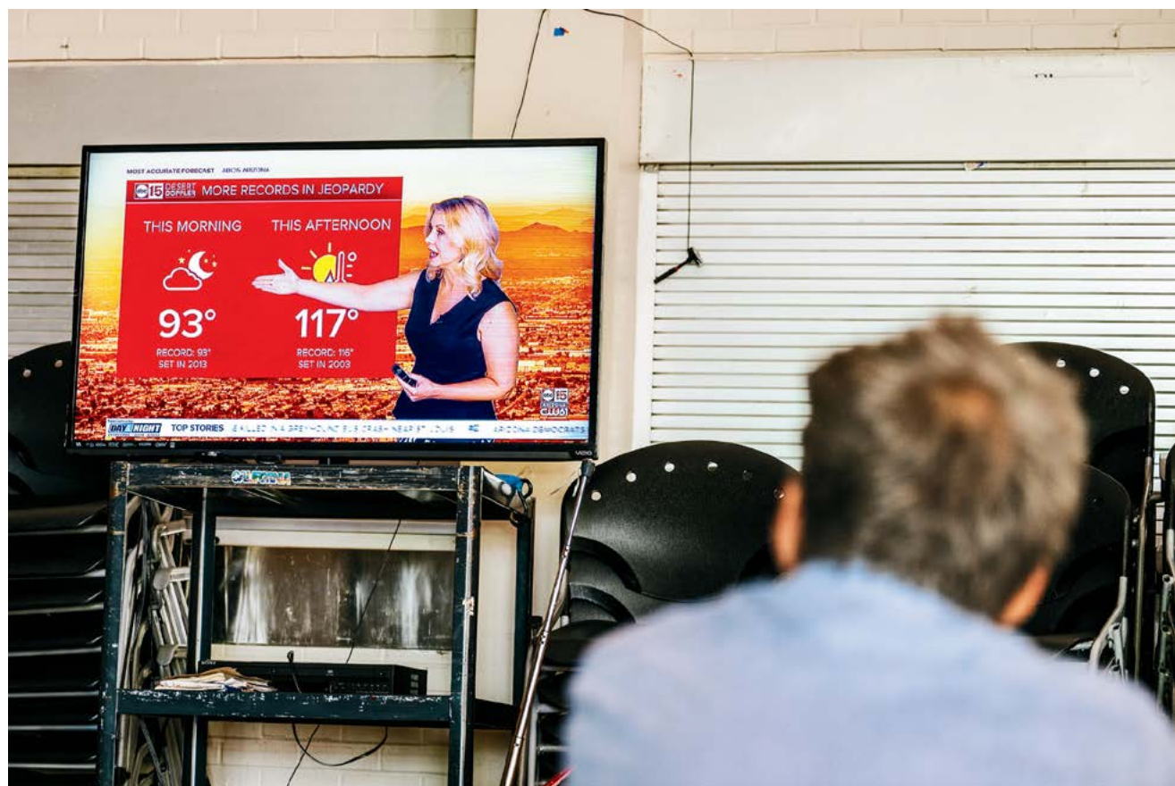
▲ Một người đàn ông xem dự báo thời tiết tại trung tâm tránh nóng có máy điều hòa ở Phoenix, Arizona, hôm 14/07/2023.