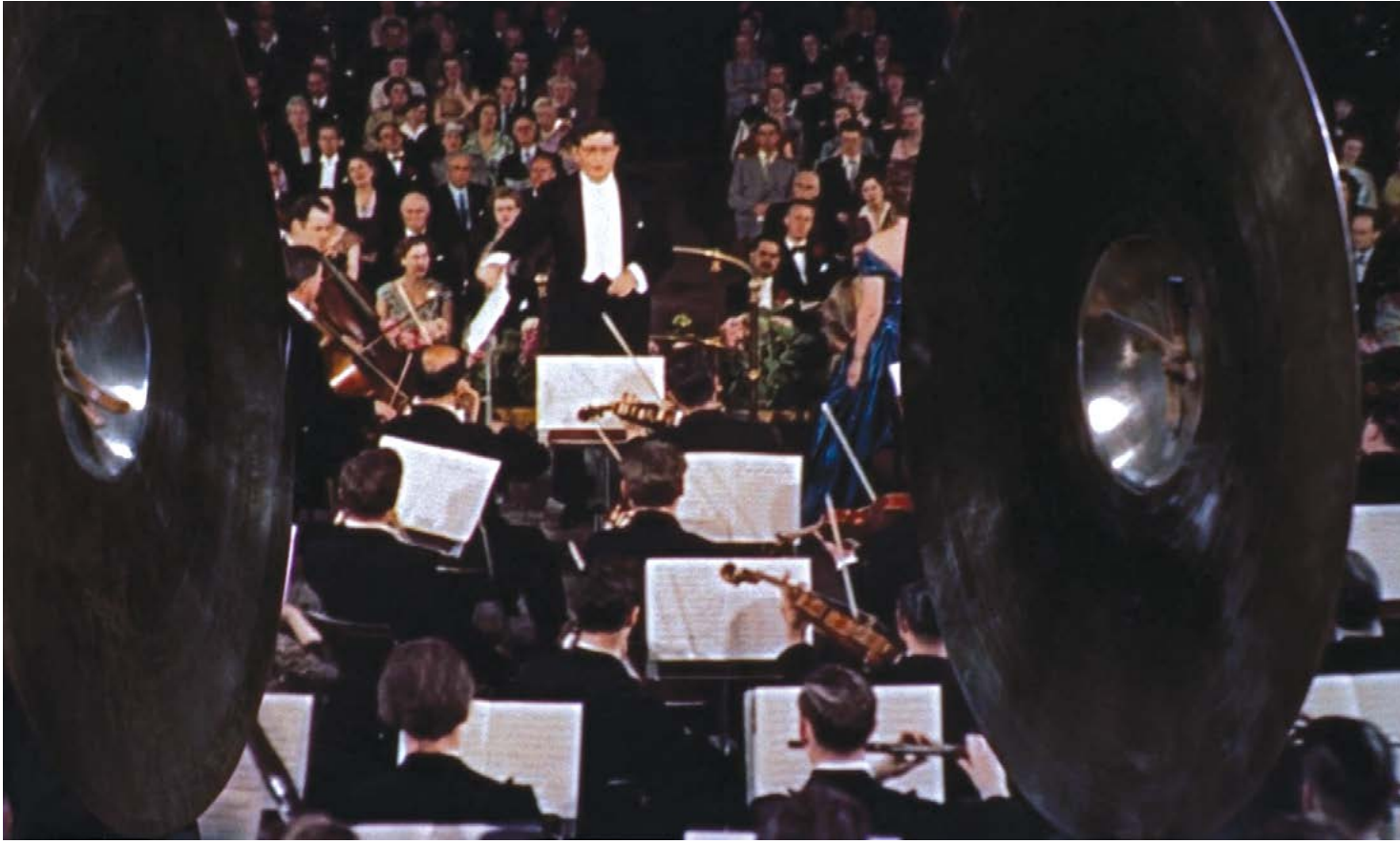
◀ Cùng sự nổi danh của nhà soạn nhạc Bernard Herrmann, nhạc phim đã có nhiều thay đổi. Đây là tấm ảnh chụp ông khi chỉ huy dàn nhạc giao hưởng trong đoạn giới thiệu bộ phim "The Man Who Knew Too Much" (Người Đan Ông Biết Quá Nhiều) năm 1956 của đạo diễn Alfred Hitchcock.