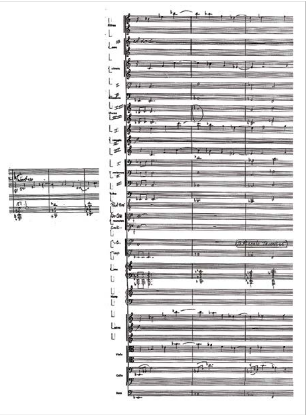
▲ Một bản nhạc phim thể hiện ý tưởng âm nhạc (bên trái) của nhà soạn nhạc và bản tổng phổ hoàn thiện của người hòa âm.