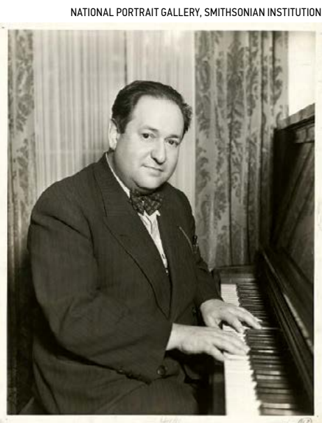
▲ Nhà soạn nhạc Erich Wolfgang Korngold, năm 1934–35. Bức ảnh này là một món quà từ Musical America Archives (Kho lưu trữ Âm nhạc Hoa Kỳ).

phương pháp hiện đại dành cho các bản nhạc ngắn đã ra đời, chẳng hạn như bản nhạc cho bộ phim “Vertigo” vào năm 1958 của ông.