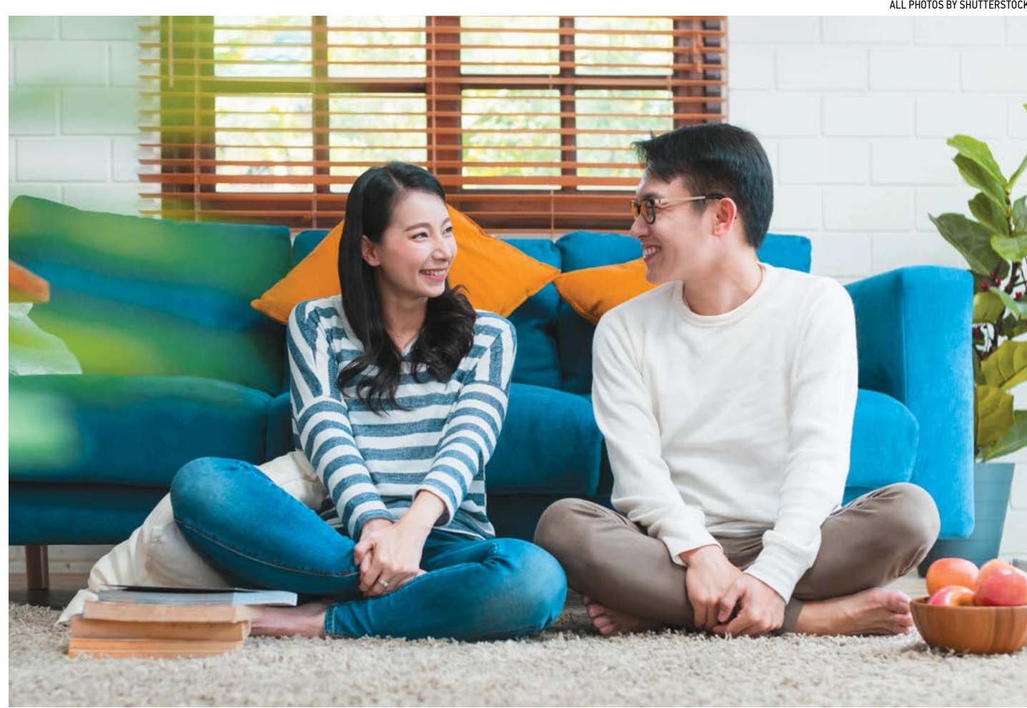
Vợ chồng hiểu nhau, khi xúc động nên lùi một bước, bình tĩnh rồi lại giao tiếp thì tình cảm mới có thể bền lâu.

Hại vị giáo sư này cho biết, "Khi chúng tôi làm việc với những cặp đôi đang tranh cãi và không đạt được tiến triển nào, chúng tôi thường khuyên họ ngừng tranh cãi và lập một kế hoạch để có thể giao tiếp tốt và có hiệu quả. Mỗi người hãy viết ra những vấn đề hoặc hành vi của đối phương (hoặc bản thân mối quan hệ)