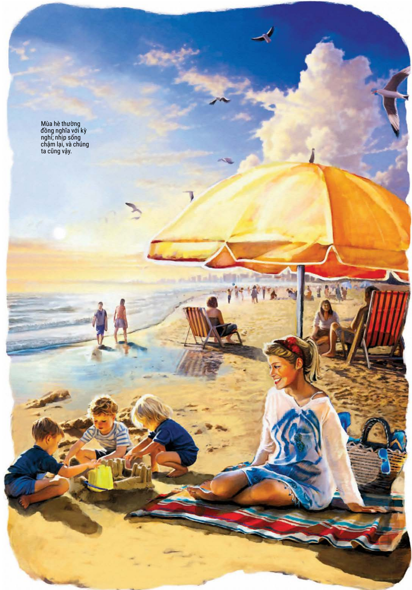
Mùa hè thường đồng nghĩa với kỳ nghỉ, nhịp sống chậm lại, và chúng ta cũng vậy.

nhóm lo sau vườn vào tháng Giêng ở những tiểu bang như Minnesota hay Maine. Mùa xuân đem lại những nụ hoa hé nở và tiếng chim hót véo von, nhưng thời tiết vẫn chưa ổn định – ngày thì ấm áp những ngày hôm sau lại lạnh công.