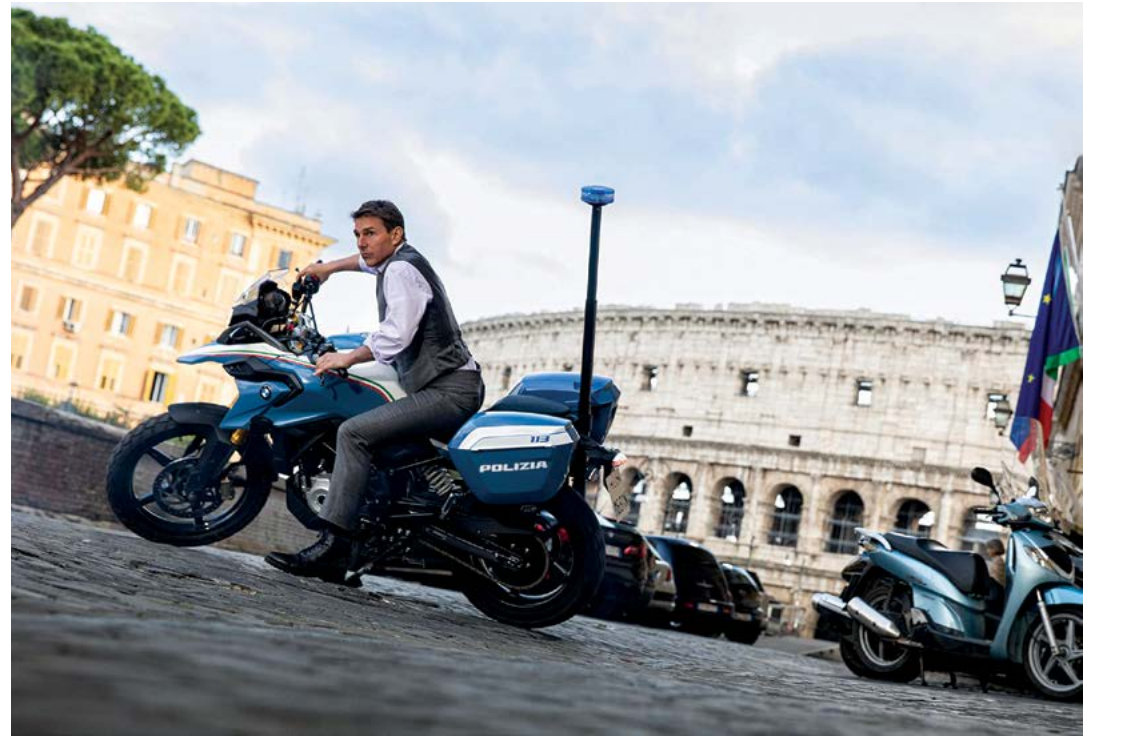
▲ Nhân vật Ethan Hunt (do Tom Cruise thủ vai) trong “Mission: Impossible – Dead Reckoning Part One”.