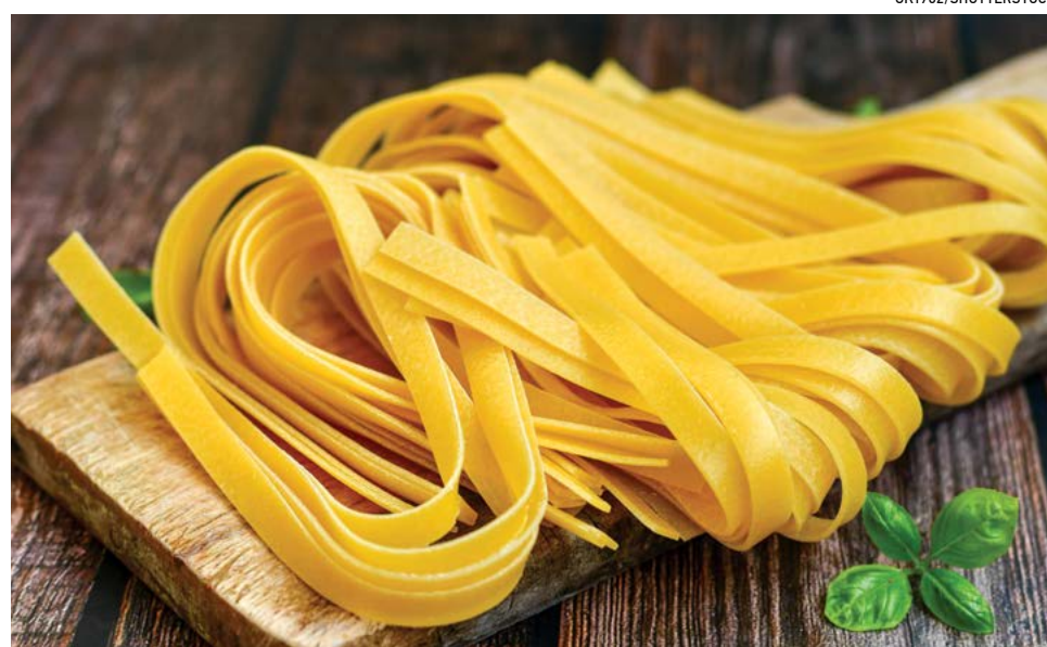
▲ Vì mì sợi tươi dẻo hồng và mềm, tốt nhất là bảo quản trong tủ đông lạnh.

Là một trong những loại thực phẩm tiết kiệm và tiện lợi nhất, mì ống đã