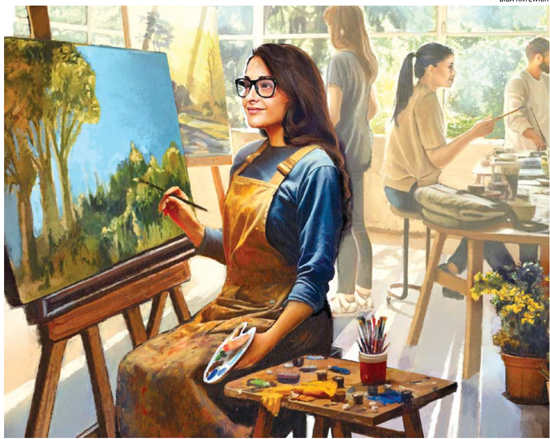
▲ Tham dự các lớp học hay sự kiện cộng đồng có thể mở rộng tầm nhìn xã hội của chúng ta.

Nhà hiền triết Aristotle đã từng viết một câu nổi tiếng, “Vẻ bản chất, con người là một loài vật có tinh xã hội.” Chúng ta không phải sinh ra để sống