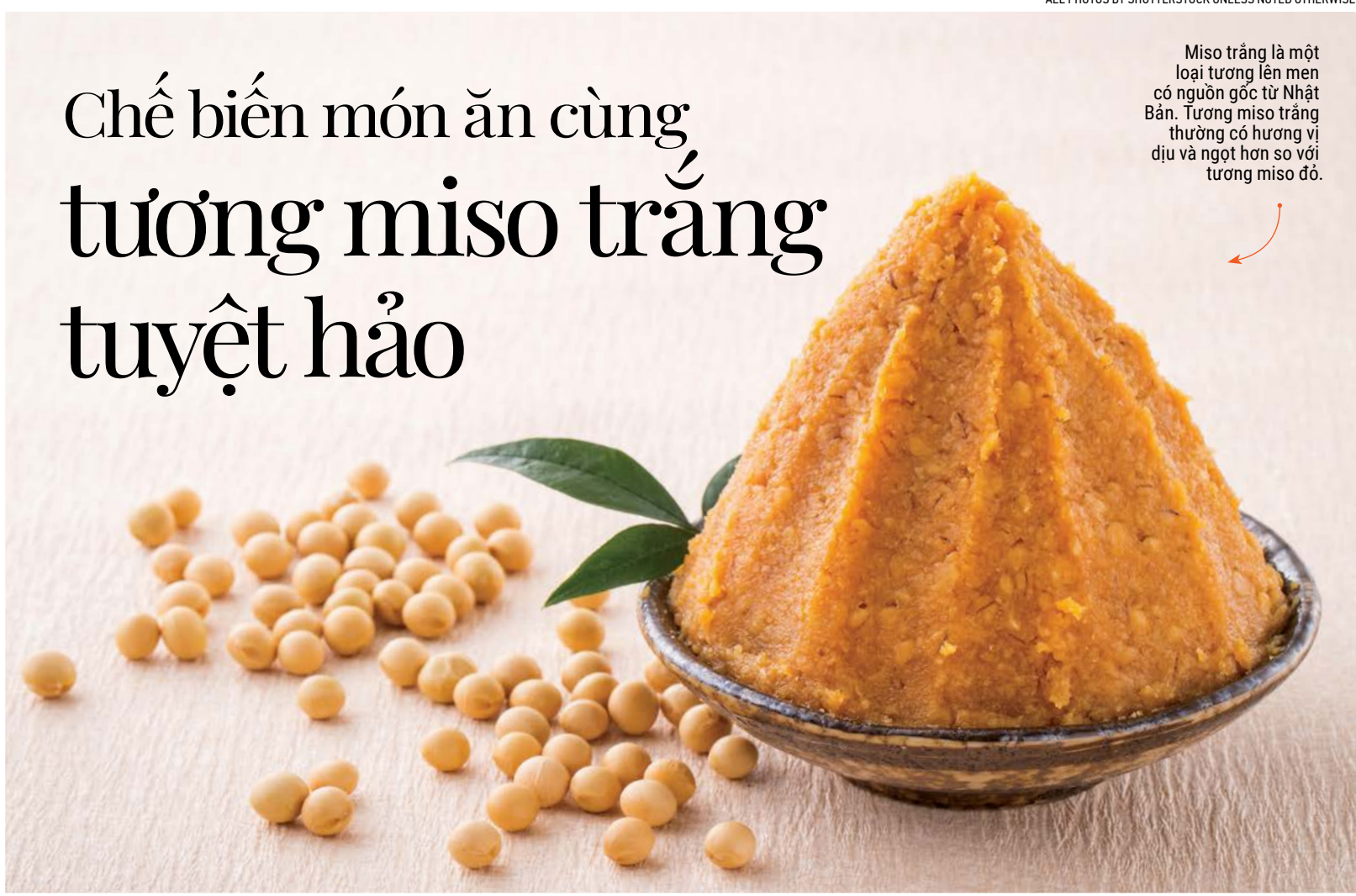
Miso trắng là một loại tương lên men có nguồn gốc từ Nhật Bản. Tương miso trắng thường có hương vị dịu và ngọt hơn so với tương miso đỏ.