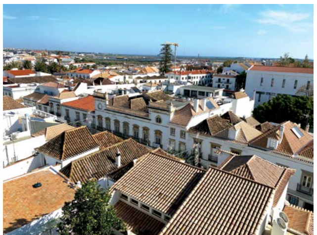
Những mái nhà ở Tavira được nhìn từ các bức tường lâu đài phía trên cao của thị trấn.

Đi xa hơn những bãi biển Algarve của Bồ Đào Nha xứng đáng là một trong những nơi nghỉ dưỡng nổi tiếng nhất của châu Âu. Trái dài đến tận cực nam của đất nước,