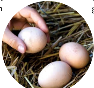
▲ Bạn cũng sẽ nâng cao sức khỏe cho gia đình mình với những quả trứng gà thả vườn nhiều dưỡng chất mà con bạn thu thập mỗi ngày.

con bạn là mẹ của chúng và sẽ nhanh chóng gần bó. Bạn sẽ muốn chọn từ một số giống gà thân thiện với trẻ em hơn như giống gà Anh Buff Orpington, gà quạ Black Australorp, gà lông lụa Silkie, gà Delaware, gà Brahmas, và gà Barred Plymouth Rock. Tôi thực sự khuyên bạn nên mua