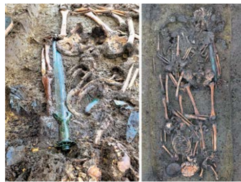
▲ Thanh kiếm đồng hơn 3,000 năm tuổi được khai quật ở miền nam nước Đức.

Các nhà khảo cổ suy luận sơ bộ rằng, lịch sử của loại vũ khí sắc bén