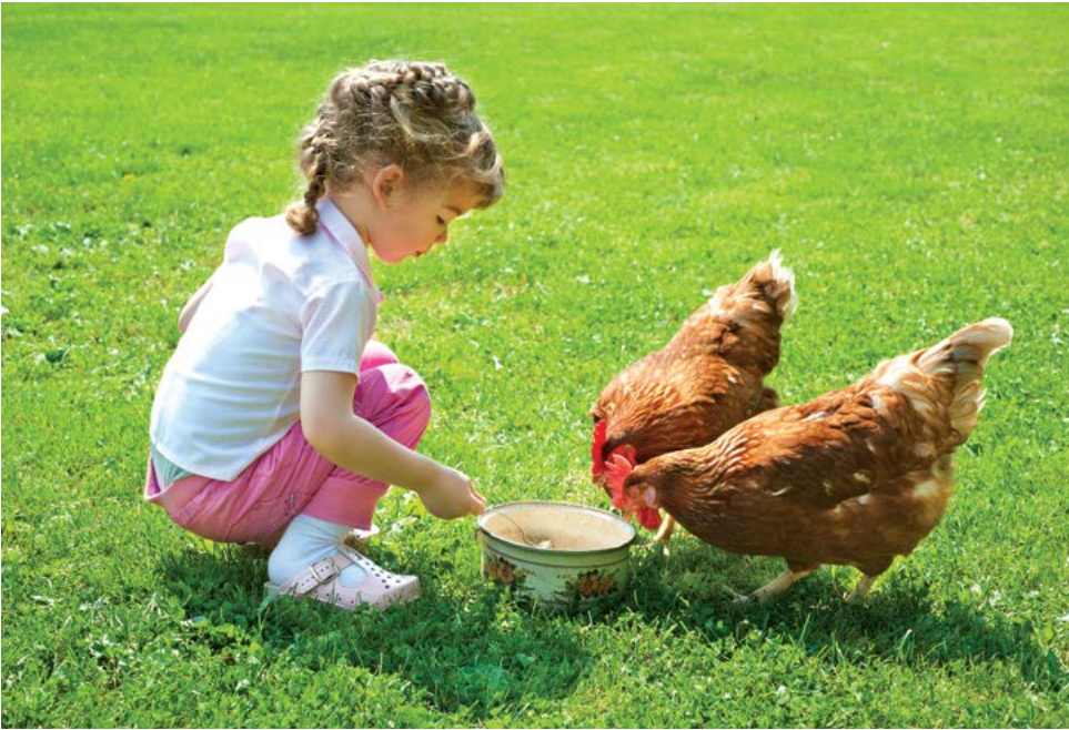
▲ Việc nuôi gà đã trở nên phổ biến hơn.

Trước tiên, bạn hãy nhớ xem các quy định về chăn nuôi gia súc của thành phố hoặc thị trấn để biết liệu bạn có thể nuôi gà trên mảnh đất của mình hay