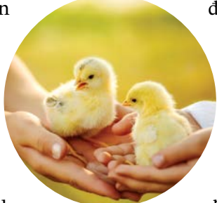
▲ Bạn nên mua gà con mới nở một ngày tuổi vì chúng sẽ gây ấn tượng với các con bạn.

Hãy nghĩ xem bạn thích những con gà con mới nở, gà mái sắp tới tuổi đẻ trứng, hay thậm chí là gà mái quá lứa còn khỏe mạnh được cứu từ các trại nuôi công nghiệp, nếu có. Gà con sẽ cần nhiều thời gian và công sức chăm sóc hơn một chút vì chúng cần được nhốt trong lồng ấp để giữ ấm cho đến khi đủ lông và có thể di chuyển ra chuồng gà mái. Ngoài ra, gà mái sắp tới tuổi đẻ trứng là gà mái tốt trong độ tuổi từ 18 đến 24 tuần, chúng sẽ sớm cho trứng. Tôi khuyên bạn nên mua gà con mới nở một ngày tuổi vì chúng sẽ gây ấn tượng với các con bạn.