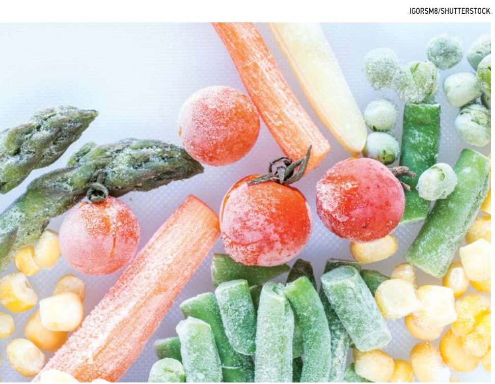
▲ Trái cây và rau củ tươi có ngon hơn đồ đông lạnh không?