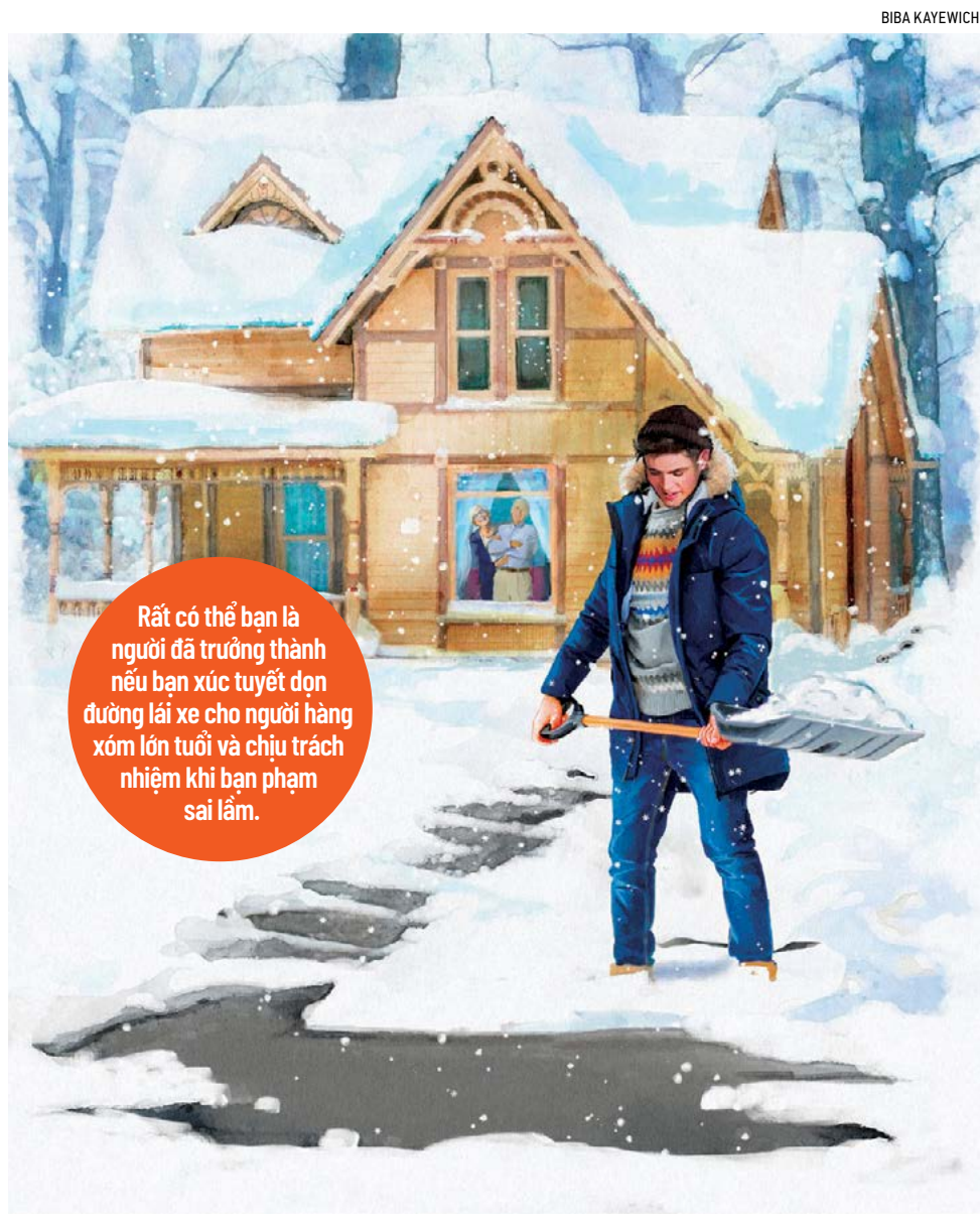
Rất có thể bạn là người đã trưởng thành nếu bạn xúc tuyết dọn đường lái xe cho người hàng xóm lớn tuổi và chịu trách nhiệm khi bạn phạm sai lầm.

Trong trường hợp đầu tiên, nền văn hóa của chúng ta đã coi thường tất cả các nghi thức và nghi lễ. Ví dụ, hãy nghĩ về các đám tang. Trong phần lớn lịch sử của quốc gia chúng ta, việc chôn cất người thân hoặc người quen là một sự kiện trang trọng. Bạn thuê like an adult yet, here’s why.” (Nếu bạn ở độ tuổi 20 và bạn chưa cảm thấy mình là người trưởng thành, thì