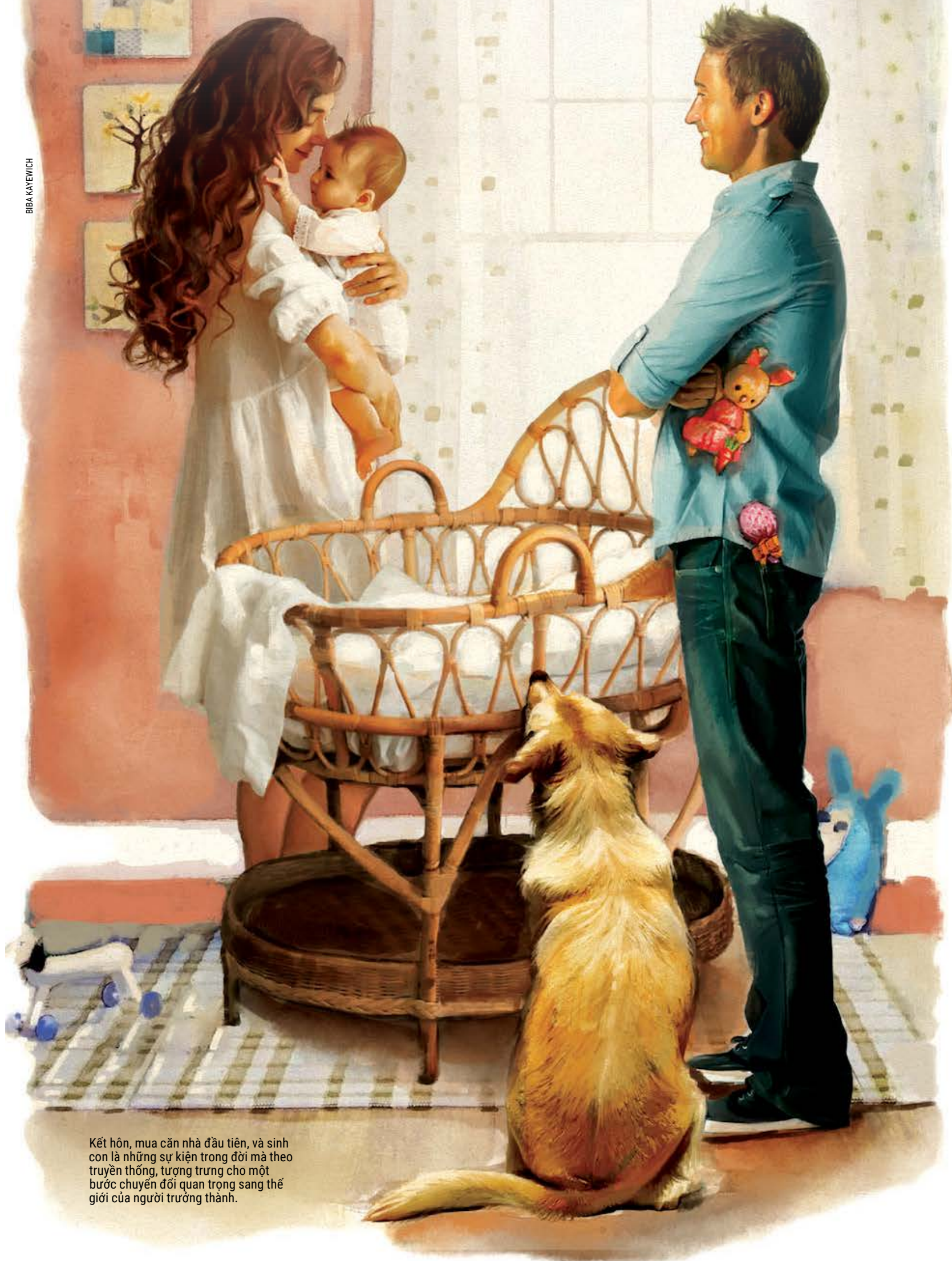
Kết hôn, mua căn nhà đầu tiên, và sinh con là những sự kiện trong đời mà theo truyền thống, tượng trưng cho một bước chuyển đổi quan trọng sang thế giới của người trưởng thành.