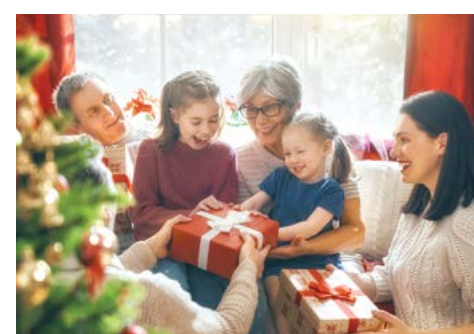
▲ Buổi sáng Giáng Sinh nên là khoảng thời gian vui vẻ cho cả gia đình.

Đêm Giáng Sinh có thể sẽ kéo theo một số lễ hội riêng. Bạn nên chuẩn bị một danh mục những việc cần làm trong đêm đó – những việc mà bạn muốn chắc chắn mình sẽ không quên – và cất chung với những món quà cho đến đúng thời điểm. Bạn sẽ chủ động hơn trong các hoạt động vào