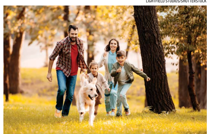
Trẻ em phát triển lành mạnh khi được sống trong các mối quan hệ khăng khít, bền chặt. Thiếu đi điều này, các em thường dễ bị các yếu tố bên ngoài tác động.

Có Shefali: Việc sống có lập gia tăng và giám kết nối xã hội thường là gốc rễ của những căn bệnh này. Trẻ em phát triển lành mạnh khi các em được sống trong