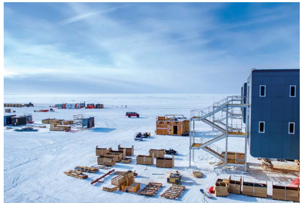
▲ Ảnh chụp từ trên không của Trạm Nam Cực Amundsen-Scott, trong bức ảnh tư liệu.

CHUYÊN BẢO HIỂM CHO: CƠ SỞ THƯƠNG MẠI - NHÂN THỌ XE - NHÀ - ĐẦU TƯ