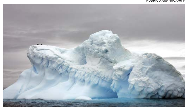
▲ Ảnh chụp một sông băng ở Nam Cực vào ngày 09/11/2007.