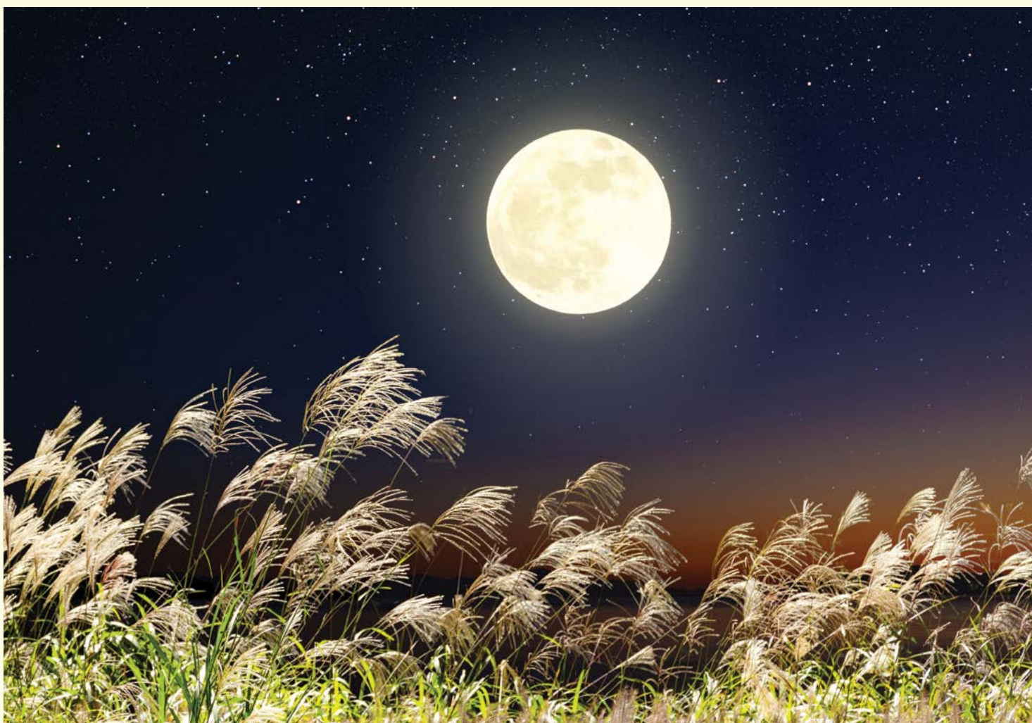
▲ Sau khi phân tích 380 kg mẫu đất mặt trắng do các phi hành gia mang về, các khoa học gia phát hiện ra rằng trong đó thực sự chứa sắt và titan nguyên chất, vốn là những khoáng chất kim loại tinh khiết không có trong tự nhiên.