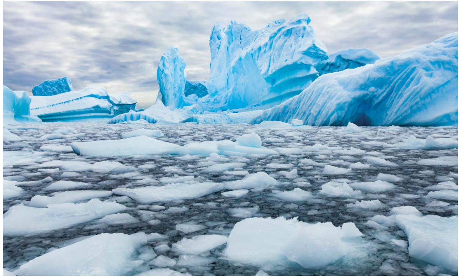
▲ Băng đá ở Nam Cực.

Công việc của cô Endo là sắp xếp lịch trình dọn dẹp để nhà hàng sạch sẽ, có thể cung cấp món ăn nhẹ và thức uống để mọi người làm việc thuận lợi. Cô cũng trông coi một cửa hàng nhỏ bán đồ lưu niệm, quần áo, đồ uống và