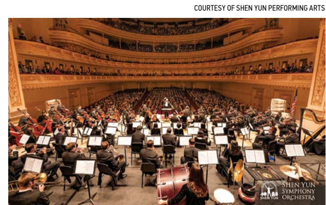
▲ Một buổi biểu diễn của Dàn nhạc Giao hưởng Shen Yun.