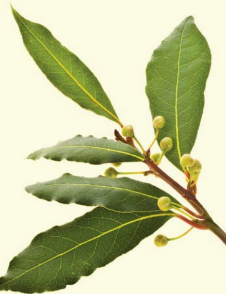
▲ Là nguyệt quế.