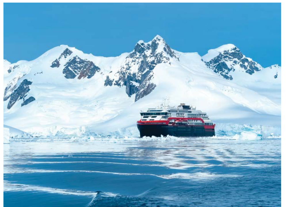
▲ Một con tàu đang di chuyển trên dòng sông băng ở Nam Cực.