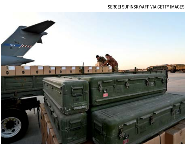
▲ Các quân nhân của Lực lượng Quân sự Ukraine vận chuyển các thùng chứa hóa tiễn FIM-92 Stinger do Mỹ sản xuất (Mặt trước), sau khi được chuyển đến phi trưởng Boryspil ở Kyiv vào ngày 13/02/2022.

Như bối cảnh hiện nay, ngoài Trung Quốc – những người chiến thắng lâu dài nhất trong cuộc chiến