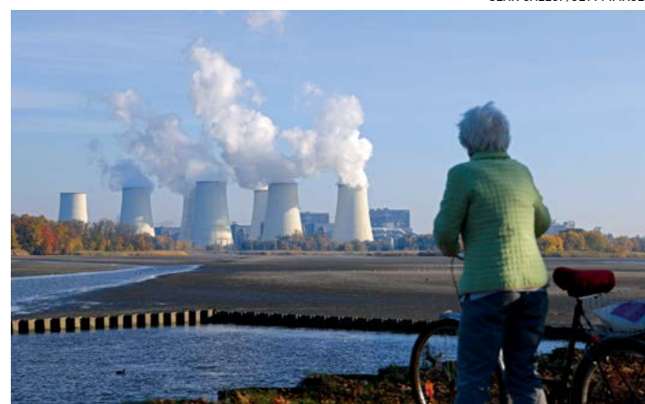
▲ Một người phụ nữ quan sát nhà máy nhiệt than Jaenschwalde, một trong những nơi phát thải CO2 lớn nhất châu Âu, tại Peitz, Đức vào ngày 29/10/2021.

các tác giả cho rằng cần phải loại bỏ dầu, than, và các nhiên liệu hóa thạch khác nhanh chóng hơn nữa. Nếu không thì có thể xảy ra tình trạng thiếu nước và lương thực, cộng với tình trạng nắng nóng cực độ, đối với một phần ba đến một nửa dân số thế giới.