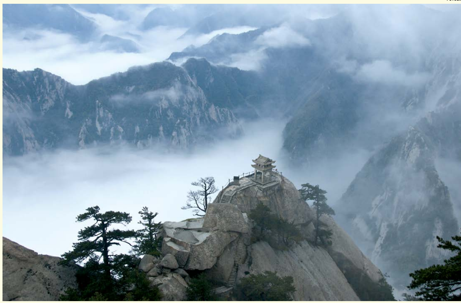
▲ Núi Hằng Sơn.