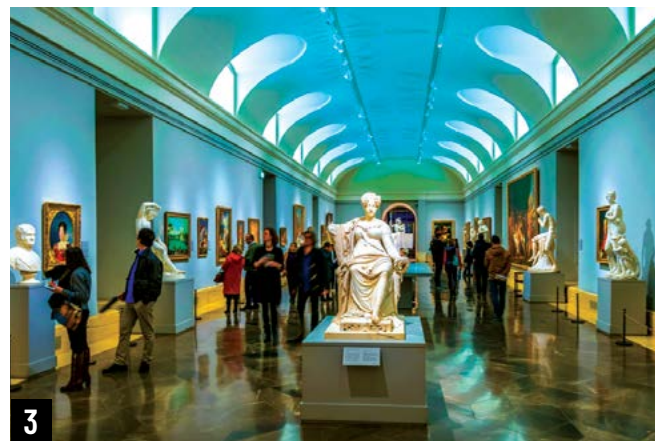
1. Cung điện Hoàng gia ở Madrid; 2. Nhà thờ chính tòa Almudena ở Madrid; 3. Bảo tàng Prado ở Madrid.