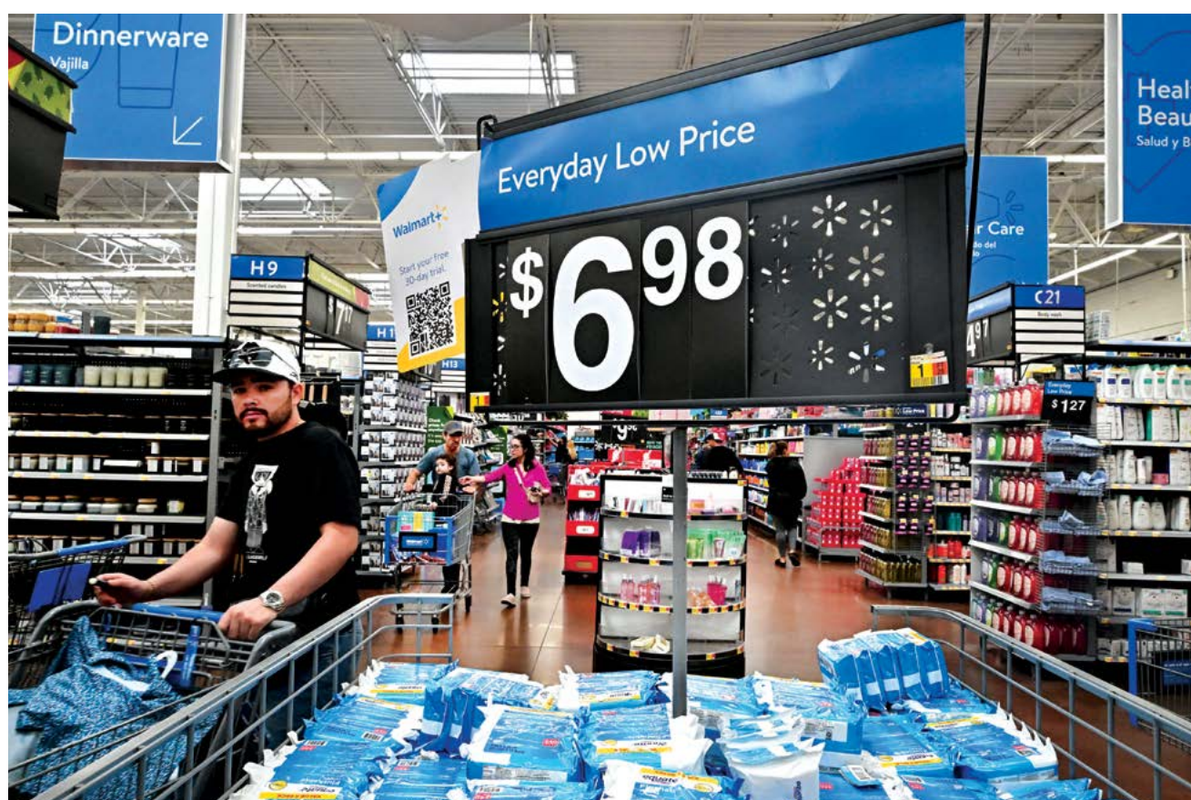
▲ Người mua hàng tại một chuỗi cửa hàng bán lẻ ở Rosemead, California hôm 12/12/2023.