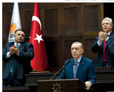
▲ Ông Recep Tayyip Erdogan, đương kim Tổng thống Thổ Nhĩ Kỳ và là lãnh đạo Đảng Công lý và Phát triển (AK), (giữa), có bài diễn văn trong buổi họp báo của ông tại Đại hội đồng Quốc hội Thổ Nhĩ Kỳ ở Ankara hôm 25/10/2023.

Thổ Nhĩ Kỳ là một trong những đồng minh quan trọng nhất và đồng thời cũng là tệ nhất của Hoa Kỳ và NATO. Mỗi đầynhất, họ đã từ chối cho hai tàu quét mìn của Anh vốn có thể vô hiệu hóa đạn được của Nga cũng như từ chối giúp vận chuyển ngũ cốc của Ukraine. Năm ngoái, Thổ Nhĩ Kỳ đã khiến phương Tây khó chịu khi phong tỏa tàu chở dầu qua eo biển của nước này.