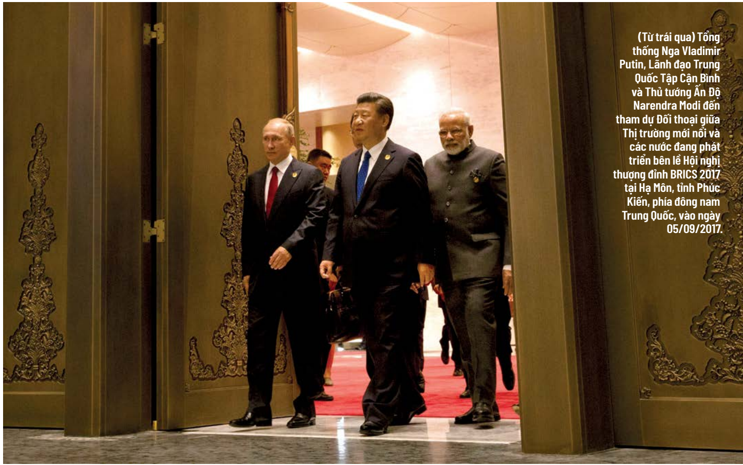
(Từ trái qua) Tổng thống Nga Vladimir Putin, Lãnh đạo Trung Quốc Tập Cận Bình và Thủ tướng Ấn Độ Narendra Modi đến tham dự Đối thoại giữa Thị trường mới nổi và các nước đang phát triển bản lề Hội nghị thượng đỉnh BRICS 2017 tại Hạ Môn, tỉnh Phúc Kiến, phía đông nam Trung Quốc, vào ngày 05/09/2017.