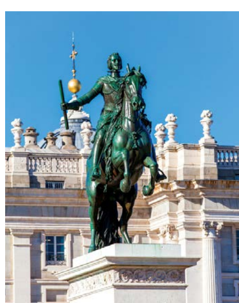
▲ Bức tượng Vua Felipe IV đặt ở trung tâm Quảng trường Plaza de Oriente, Madrid.

thờ chính tòa nào có thể sánh ngang với các nhà thờ ở thành phố Seville, Barcelona, hay Santiago de Compostela. Nhà thờ có thể xem là nổi bật nhất Madrid là Nhà thờ chính tòa Almudena (Catedral de Santa Maria la Real de la Almudena), tình cờ lại nằm ngay bên cạnh Cung điện Hoàng gia. Phải mất một thế kỷ để xây dựng nhà thờ này, chủ yếu là do những bất đồng chính trị và sự quan liêu, mãi cho đến năm 1992, trong một buổi lễ do hoàng John Paul II chủ trì thì nhà thờ mới chính thức được mở cửa.