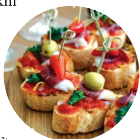
▲ Tapas – món khai vị của Tây Ban Nha.

Chúng tôi thích cảnh sắc. Chúng tôi thích mua sắm. Chúng tôi thích người dân Madrid sôi nổi, quyến rũ, và thân thiện. Chúng tôi thích ném thử món tapas, những món ăn nhẹ kiểu Tây Ban Nha mà bạn có thể thưởng thức như món khai vị hoặc bữa chính. Chúng tôi thích bắt đầu ngày mới với món bánh churros kèm sốt chocolate – bữa sáng nhẹ kiểu Tây Ban Nha gồm bột mì và chocolate nóng đậm đặc đó vị như bánh pudding chocolate tan chảy.