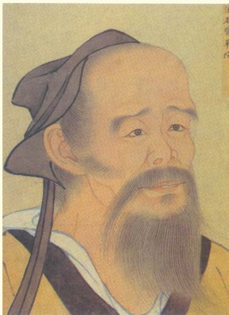
▲ Một bức vẽ chân dung Hoa Đà từ thời nhà Minh.