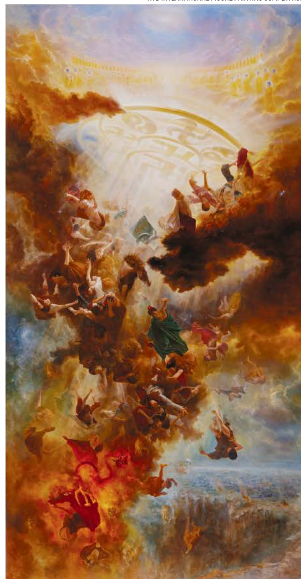
▲ Bộ ba bức tranh “The Infinite Grace of Buddha” (Phật Ân Hạo Đãng) do ba họa sĩ hợp tác thực hiện.