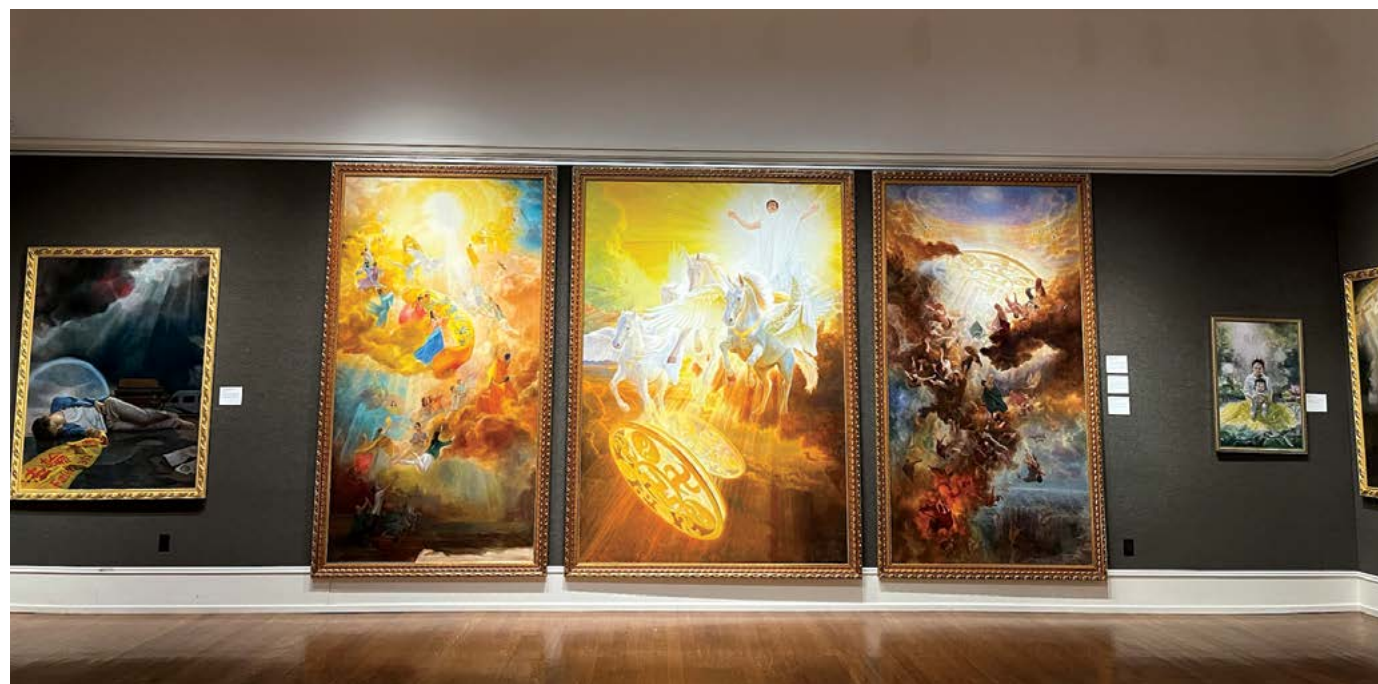
▲ Bộ ba bức tranh “The Infinite Grace of Buddha” (Phật Ân Hạo Đãng) do ba họa sĩ hợp tác thực hiện được trưng bày trong cuộc triển lãm các tác phẩm lọt vào vòng chung khảo Cuộc thi Vẽ tranh Nhân vật Quốc tế NIFPC, tại Câu lạc bộ nghệ thuật Salmagundi, Thành phố New York.