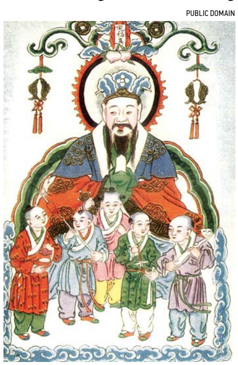
Hình tượng Táo Quân trong văn hóa Trung Hoa.

Ba năm nữa lại trôi qua, chồng nàng vẫn không về. Người chủ có ý thúc giục, người vợ đành chấp thuận lời khẩn cầu của người chủ đã cầu mang