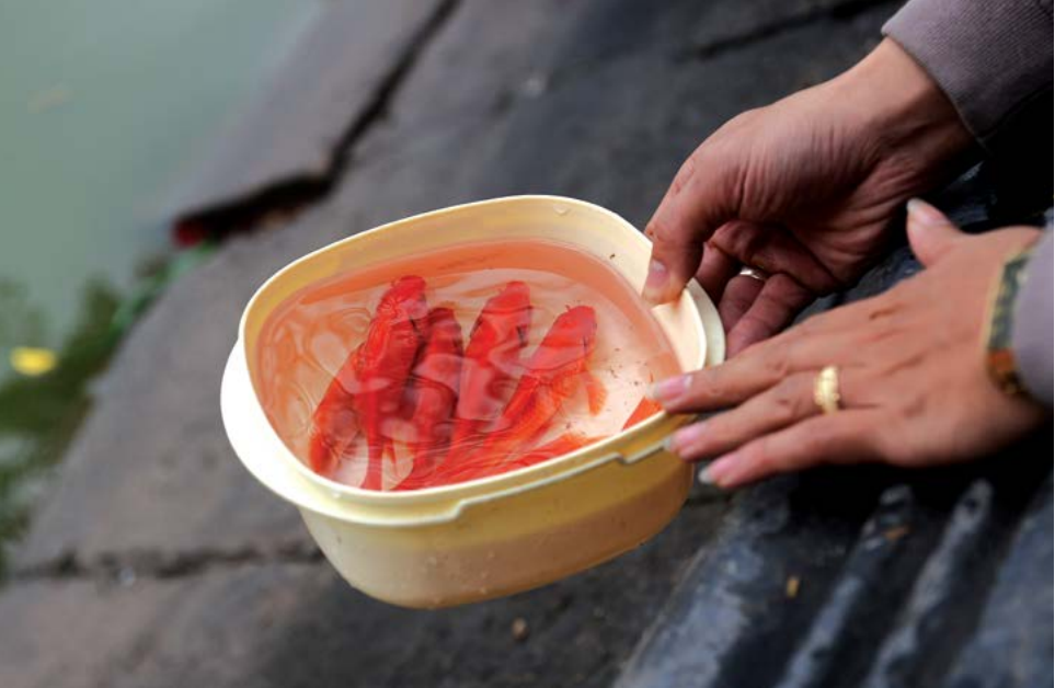
▲ Ngày 23 tháng Chạp hàng năm, người Việt thường có tục lễ cúng Táo Quân, và thả cá chép. Theo quan niệm dân gian, cá chép là loài có thể vượt Vũ Môn hóa rồng, vì thế mà có thể giúp đưa Ông Táo về trời.