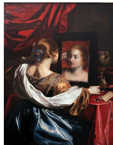
▲ Bức tranh "Vanity" (Tinh Tú phụ) của họa sĩ Nicolas Regnier, vẽ khoảng năm 1626. Son dầu trên vải canvas. Bảo tàng Mỹ thuật Lyon, nước Pháp.

Tuy nhiên, một luận điểm phụ có liên quan đến câu châm ngôn thứ hai của Thần Apollo, rằng: "đừng thái quá" hoặc tránh cực đoan. Khi chúng ta quan sát kỹ nhân vật Narcissus, chúng ta thấy rằng chàng hoàn toàn chú tâm vào bản thân (nhiều đến