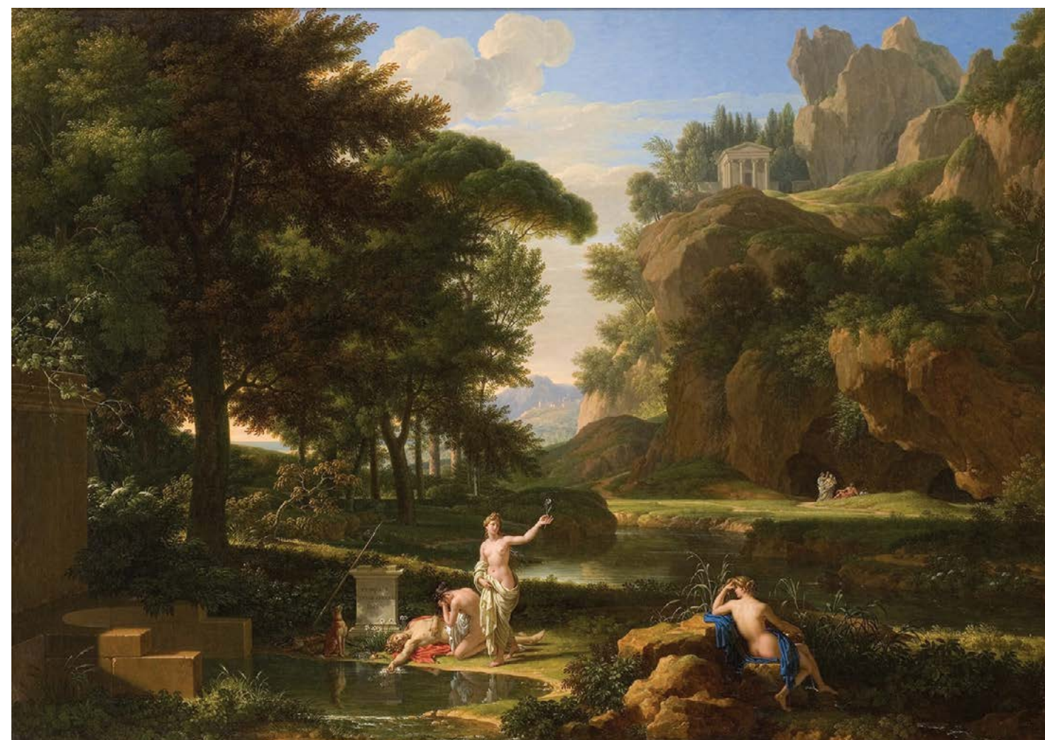
▲ Bức tranh "The Death of Narcissus" (Cái chết của chàng Narcissus) của họa sĩ François-Xavier Fabre vẽ năm 1814. Son dầu trên vải canvas. Phòng trưng bày Quốc gia Úc, Canberra.

Tuy nhiên, dù bằng cách nào đi nữa thì vẫn tồn tại một vấn đề không thể giải quyết. Dù chúng ta nhìn nhận Narcissus là người không hiểu rõ