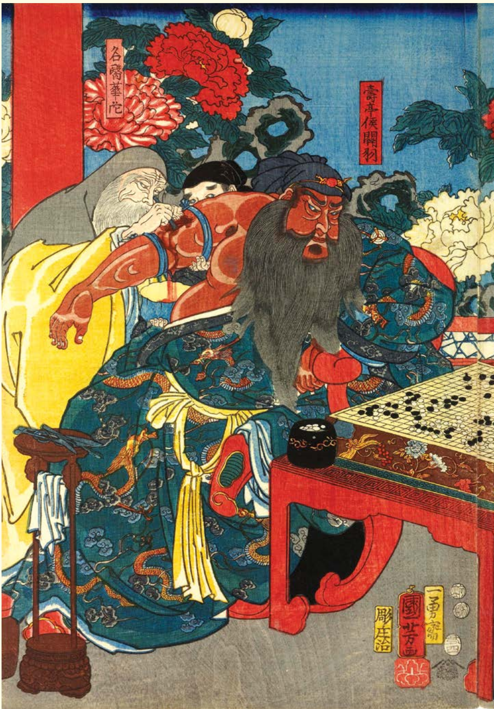
▲ Bản khắc gỗ của họa sĩ Utagawa Kuniyoshi mô tả cảnh Hoa Đà loại bỏ chất độc ra khỏi cánh tay của Quan Vũ.

Hoa Đà được biết đến là người tu luyện Đạo Giáo. Người ta cho rằng ông đã tìm đến các vị Thần để được hướng dẫn, từ đó thăng hoa bản thân cũng như các khả năng của mình theo