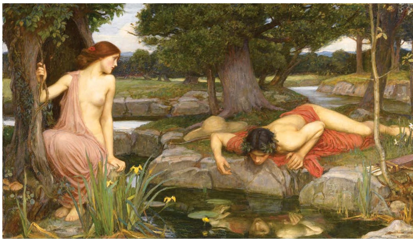
▲ Bức tranh "Echo and Narcissus" (Nàng Echo và chàng Narcissus) của họa sĩ John William Waterhouse vẽ năm 1903. Son dầu trên vải canvas. Phòng trưng bày Nghệ thuật Walker, Liverpool, Anh quốc.

Ngày lúc này, khi Narcissus đã khước từ rất nhiều người, nên chàng sẽ phải thấu hiểu cảm giác không bao giờ được người mình yêu chấp nhận là như thế nào. Kiệt sức sau một ngày săn bắn, chàng ngồi xuống bên cạnh bờ hồ để uống ngụm nước, và trở nên mê mẩn hình ảnh phản chiếu của chính mình trên mặt hồ. Khi