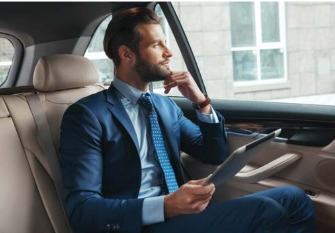
◀ Đừng xem nhẹ tác dụng của phụ kiện. Cảm giác tự tin bắt đầu bằng vẻ ngoài chỉnh chu.