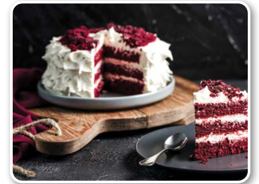
Bánh nhung đỏ (bánh Red Velvet - Hoa Kỳ)

Bánh Kyiv là một loại bánh cổ điển của Ukraine. Tại thủ đô Kyiv của Ukraine, người dân sẽ thường thức bánh này vào những dịp đặc biệt. Bánh Kyiv bắt nguồn từ thành phố Kyiv vào những năm 1950. Qua nhiều năm, món bánh Kyiv ngày càng được ưa chuộng. Rất nhiều du khách khi đến Ukraine du lịch, họ sẽ mua bánh Kyiv đem về quê nhà để biếu tặng bạn bè, thân quyến sau khi chuyến đi kết thúc. Bánh Kyiv là loại bánh bông lan lấy tiêu chuẩn mỏng nhẹ làm chủ đạo, được xếp bằng một lớp bánh mềm mịn (làm từ trứng và đường). Trong bánh có trộn hạt đậu, sau đó phủ thêm một lớp mút hoa quả, thường là mút dâu, mút đào hoặc mút mơ, rồi lại phết lên trên một lớp kem tươi vị socola thơm nồng.