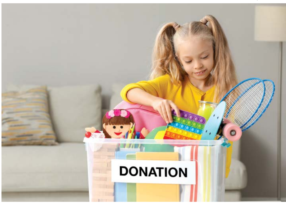
▲ Sự cho đi là thuốc giải cho lòng tham.

Thế nên, bạn phải sống đúng những gì bạn đã dạy.