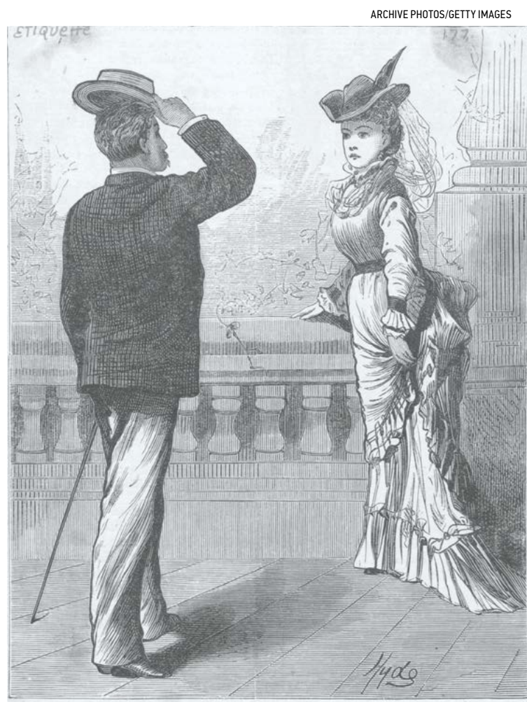
▲ Khi đang hộ tống một quý cô, bạn hãy ưu tiên quý cô ấy trước nhất.

họ, mà hãy cố gắng bảo vệ người bạn đồng hành của mình, càng nhiều càng tốt, và vui vẻ đợi đến lượt của mình.