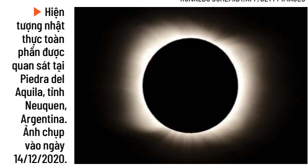
Hiện tượng nhật thực toàn phần được quan sát tại Piedra del Aquila, tỉnh Neuquen, Argentina. Ảnh chụp vào ngày 14/12/2020.