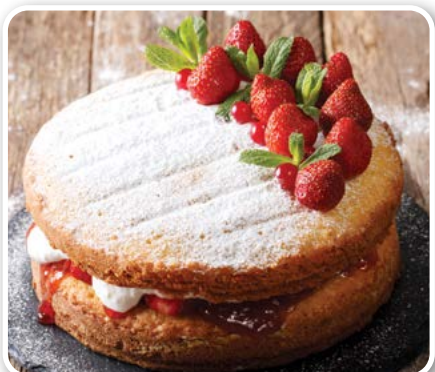
Bánh bông lan xốp Victoria (Victoria Sponge - Anh Quốc)

Có thể sử dụng màu thực phẩm để làm cho chiếc bánh hiện rõ màu đỏ. Quý vị cũng có thể không cần thêm chúng vào. Lúc này, bánh sẽ có màu nâu đỏ hơi sẫm, nhưng hương vị vẫn rất ngon. Nếu muốn hương vị socola đậm đà thì có thể thêm nhiều bột ca cao hơn một chút. Quý vị có thể lựa chọn bánh Red Velvet cho những dịp như Valentine, sinh nhật, hoặc Giáng Sinh.