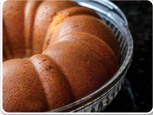
Bánh Rhum Dừa Caribe (Caribbean Coconut Rum Cake - Jamaica)

Bánh Rhum Dừa Caribe của Jamaica mang đầy hương vị nhiệt đới, đậm hương vị kem dừa. Chính điều đó đã làm cho những chiếc bánh Rhum Dừa tăng thêm mỹ vị đáng kinh ngạc. Loại bánh này sử dụng rượu Rhum vàng (amber Rum), nên bánh sẽ ấm và mềm. Thêm vào đó, thời gian ngâm rượu Rhum càng lâu, thì hương vị của bánh càng trở nên hòa quyện, tuyệt mỹ. Vì vậy, tốt nhất hãy để nó qua đêm. Bánh Rhum Dừa Caribe rất thích hợp dùng vào thời điểm chuyển giao giữa mùa hè và mùa thu. Vừa hay đó là thời điểm để tiếp tục "giữ nhiệt" bầu không khí sôi nổi của mùa hạ. Đồng thời, nó cũng là món ăn không thể thiếu trong lễ hội, đặc biệt trong tháng 11 và tháng 12. Rất nhiều người mua loại bánh này để làm quà trong dịp Giáng Sinh.