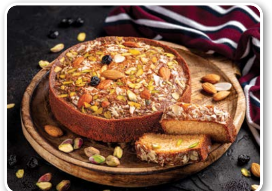
Bánh Mawa (Ấn Độ)

Theo cách làm truyền thống, bánh được nướng trong chảo nướng kim loại phẳng, sau đó bánh được cắt thành những khối vuông nhỏ hoặc hình thoi. Người Hồi giáo sẽ dùng loại bánh này trong tháng ăn chay hoặc tiết khai trai. Còn người Cơ đốc giáo sẽ ăn bánh Basbousa để chúc mừng kết thúc tháng ăn chay.