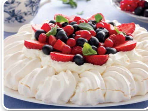
Bánh Pavlova (Australia)

Ricotta được làm bằng cách đun nóng phần sữa còn sót lại từ quá trình làm phô mai. Bánh có lượng calo thấp và nhiều protein. Chiếc bánh mềm xốp có vị ngọt nhẹ, cuộn với phô mai Ricotta nóng nần, hoặc trộn lẫn với phô mai mascarpone mềm mịn, ngọt dịu, cùng những mảnh vụn vỏ cam thanh mát, lẫn hương rượu có mùi vị của cà phê Kahlua. Hương vị cân bằng khiến cho chiếc bánh cuộn Ricotta vị cam kiểu Ý mềm ẩm, không quá ngọt và vô cùng thơm ngon. Bánh cuộn Ricotta vị cam đậm phong cách Sicily thích hợp cho những buổi tiệc chiều hè, những buổi dã ngoại cuối tuần, hoặc làm món tráng miệng sau bữa tối trong những dịp lễ đặc biệt. Nó càng thích hợp hơn cho buổi sáng khi trở thành "người bạn" tuyệt vời nhất của cà phê, mang lại nguồn năng lượng sáng khoái trong ngày hè nóng bức.