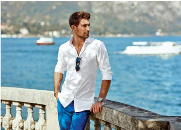
▶ Với một vẻ ngoài thoải mái vẫn có thể tạo nên ấn tượng tuyệt vời.

những năm trước trong buổi hòa nhạc của một nhạc công yêu thích, chọn lấy quần short kaki, và giày tập luyện (training shoes) sạch sẽ. Dẹp xô ngôn tục để mang, những chỉ vai loại có khả năng chống trượt, có đệm lót dày, hoặc bảo vệ chân bạn khỏi đá nhọn hoặc