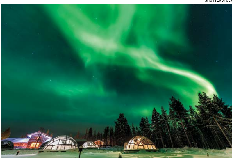
Hiện tượng cực quang tuyệt đẹp trên bầu trời Phần Lan.