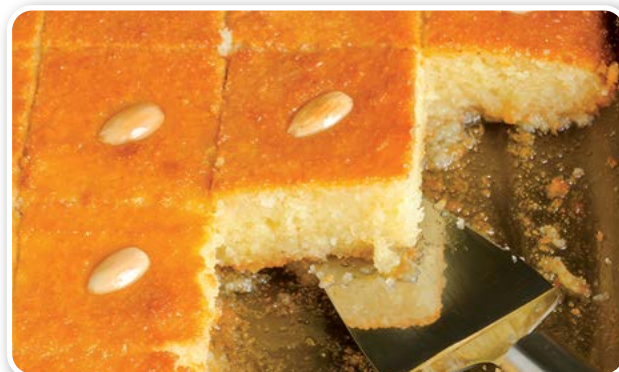
Bánh Basbousa (Ai Cập)

Ở bánh này trông vừa đẹp mắt vừa có hương vị thơm ngon. Ở Argentina, đây là loại bánh thường được dùng và thưởng thức như bánh sinh nhật. Tên bánh được lấy từ tên thành phần chính của nó, bánh quy socola cổ truyền của Argentina - "chocolina". "Chocotorta" là một từ mới được kết hợp bởi hai chữ chocolate và bánh ngọt trong tiếng Tây Ban Nha. Lý do bánh được ưa chuộng rộng rãi là vì không cần nướng, hơn nữa nguyên liệu làm bánh rất dễ tìm, cách làm lại vô cùng đơn giản. Bánh quy socola nhúng vào cà phê đã pha kem bơ; ở giữa bánh là lớp caramel sữa (dulce le leche) và ganache (socola trộn với kem tươi).