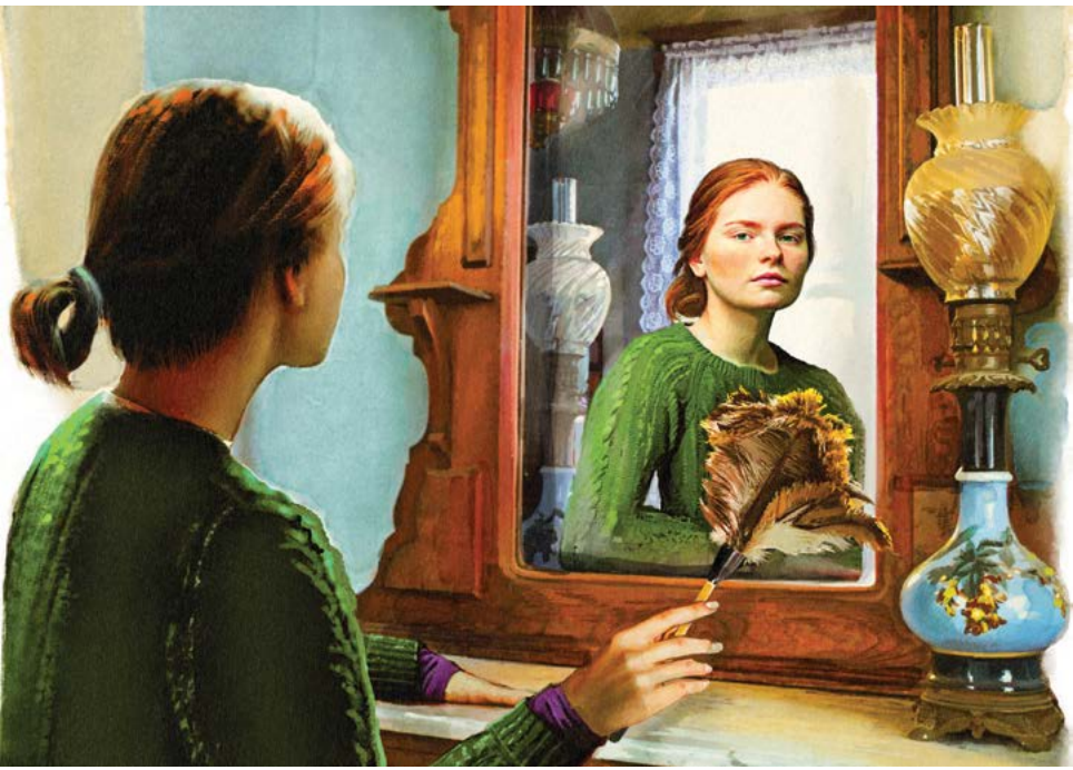
▲ Chúng ta có thể áp dụng ý nghĩa dọn dẹp vào mùa xuân vào việc tự xét mình.

thiện và vui vẻ. Có lẽ bạn chân thật và thẳng thắn, trung thực và đáng tin cậy. Có lẽ bạn mạnh mẽ và kiên cường, chăm chỉ và kiên nhẫn. Có lẽ bạn vui vẻ và luôn khích lệ mọi người, là nguồn cảm hứng cho mọi người quanh bạn.