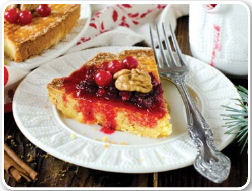
Bánh Breton Butter (còn gọi là Gâteau Breton hoặc Kouign-amann - Pháp)

Bánh mật ong ngày tết của Israel là biểu tượng tiêu biểu nhất trong năm mới của người Do Thái, cầu chúc mọi người có được một năm mới ngọt ngào. Bánh thường được nướng trong dịp lễ tết mừng năm mới của người Do Thái (lễ Rosh Hashanah), diễn ra trong khoảng thời gian từ tháng 9 đến tháng 10. Hương vị của bánh tựa như hơi thở mùa thu. Người ta nói rằng, loại bánh này vẫn giữ được hương vị thơm ngon và độ mềm xốp trong vài ngày. Nhưng nếu dùng bánh trong vòng một hoặc hai ngày thì hương vị sẽ ngon hơn. Bánh mật ong của người Do Thái thường sẽ được làm thành hình dải dây dài hoặc hình vòng tròn. Nó trở nên độc đáo cũng bởi vì sự đơn giản, chất phác, không có tầng tầng các lớp bánh, không có lớp đường phủ lên bánh, cũng không có bất kỳ trang trí nào, nhưng lại có hương vị ngon đến bất ngờ. Cũng có người sẽ quét lên bánh mật ong một lớp kem caramel. Bây giờ quý vị còn ngần ngại gì nữa mà không đưa món này vào danh sách bánh ngọt mới.