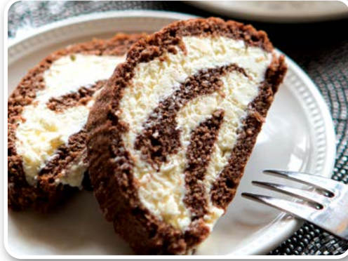
Bánh cuộn Ricotta vị cam (Orange Ricotta Cake Roll - Italia)

Bánh Rhum Dừa Caribe của Jamaica mang đầy hương vị nhiệt đới, đậm hương vị kem dừa. Chính điều đó đã làm cho những chiếc bánh Rhum Dừa tăng thêm mỹ vị đáng kinh ngạc. Loại bánh này sử dụng rượu Rhum vàng (amber Rum), nên bánh sẽ ấm và mềm. Thêm vào đó, thời gian ngâm rượu Rhum càng lâu, thì hương vị của bánh càng trở nên hòa quyện, tuyệt mỹ. Vì vậy, tốt nhất hãy để nó qua đêm. Bánh Rhum Dừa Caribe rất thích hợp dùng vào thời điểm chuyển giao giữa mùa hè và mùa thu. Vừa hay đó là thời điểm để tiếp tục "giữ nhiệt" bầu không khí sôi nổi của mùa hạ. Đồng thời, nó cũng là món ăn không thể thiếu trong lễ hội, đặc biệt trong tháng 11 và tháng 12. Rất nhiều người mua loại bánh này để làm quà trong dịp Giáng Sinh.