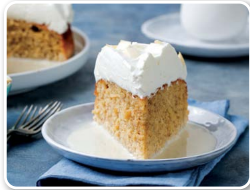
Bánh Classic Tres Leches (Mexico)

Nếu quý vị thực sự không thể đưa ra quyết định nên chọn loại bánh ngọt hay loại bánh quy nào để làm món tráng miệng trong buổi trà chiều, vậy thì món bánh Breton Butter vừa hay sẽ là sự lựa chọn tốt nhất. Bánh tỏa ra mùi thơm caramel đậm đà, kết cấu ngoài giòn trong mềm và có thêm chút vị mặn nhẹ. Nguyên liệu làm bánh bao gồm: bơ, đường, hương thảo (vanilla), bột nở và trứng. Một số công thức sẽ thêm mút trái cây để làm nhân bánh.