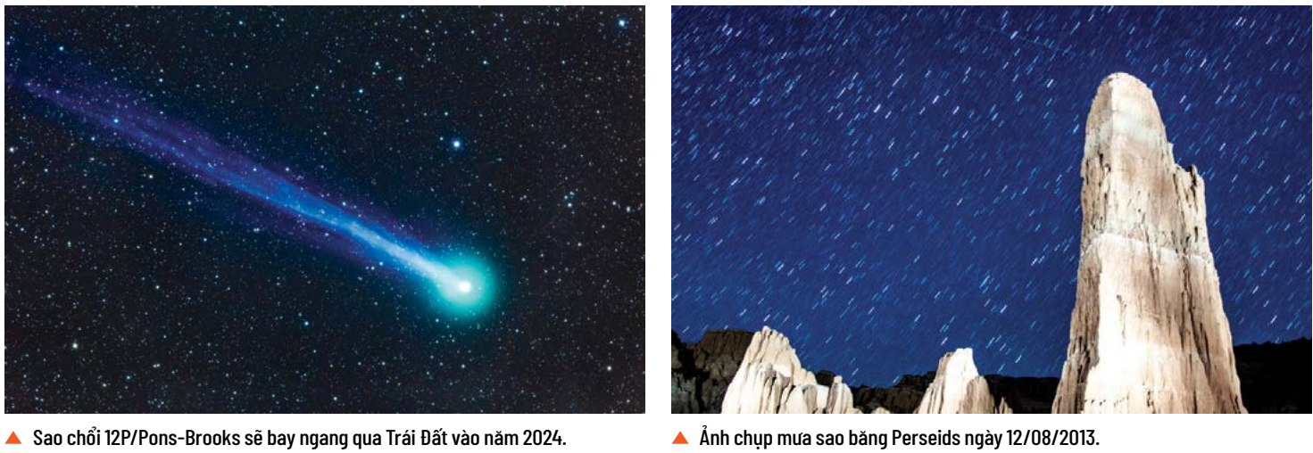
Sao chổi 12P/Pons-Brooks sẽ bay ngang qua Trái Đất vào năm 2024.