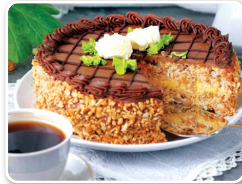
Bánh Kyiv (Ukraine)

Bánh Classic Tres Leches là món bánh ngọt truyền thống của Mexico. Nó còn có tên gọi là bánh ba loại sữa. Bánh được ngâm trong ba loại sữa: sữa tươi cô đặc, sữa đặc có đường và sữa tươi nguyên chất. Sau khi bột hút hết sữa trong vòng một giờ đồng hồ, thì hương vị của bánh được nâng lên một tầm cao mới. Bánh trở nên mềm mịn hơn. Chiếc bánh vốn dĩ đơn giản và chất phác, trong chốc lát lại trở thành một món ăn ngon với hương vị đậm đà mê hoặc lòng người. Bánh Tres Leches cũng là món bánh được yêu thích nhất của người Mỹ Latinh. Có một số đầu bếp thích cho thêm kem bông (kem được đánh bông bằng lòng trắng trứng và đường) lên bề mặt bánh, để bánh có vị ngọt hơn. Một số người còn cho thêm trái cây. Chỉ cần cần một miếng thôi, quý vị sẽ hiểu được tại sao bánh Tres Leches lại là món ngon kinh điển.