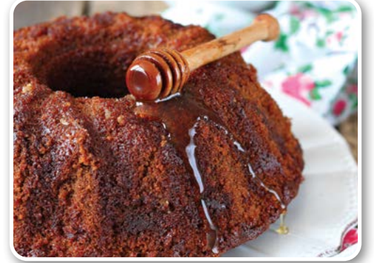
Bánh mật ong ngày tết (Israel)

Món tráng miệng mộng ảo ngon khó cưỡng vào ngày hè - Bánh Pavlova. Tên loại bánh ngọt lộng lẫy, hoa lệ này được đặt theo tên của một nữ nghệ sĩ múa ballet người Nga. Hai nước Australia và New Zealand đều tuyên bố rằng họ đã sáng tạo ra bánh Pavlova. Điều đặc biệt của bánh Pavlova nằm ở chỗ, phần đế bánh được làm từ lòng trắng trứng và bơ. Phần đế bánh có thể được chuẩn bị từ trước. Trước khi dùng, người ta rưới một ít giấm đen balsamic và tinh chất vani lên những trái dâu tây. Bằng cách này giúp bánh bộc lộ trọn vẹn hương vị của trái cây. Khi làm bánh cần chú ý để vỏ bánh bơ trứng không bị nứt vỡ. Như thế, từng lớp vỏ bơ trứng mềm mại sẽ chứa đầy trái cây tươi và kem ở bên trong.