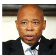
Thị trường Thành phố New York Eric Adams.

Hôm 03/04, National Review đưa tin, một năm trước, Thị trường thành phố New York Eric Adams đã nhận được thư cảnh cáo từ ông Hoàng Bình (Huang Ping) – tổng lãnh sự Trung Quốc tại New York – khuyên ông không nên tham dự bữa tiệc