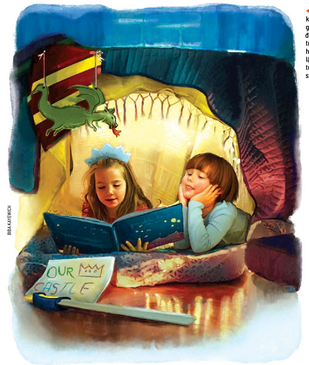
Vui chơi không có sự giám sát cho trẻ em [phát huy] tính độc lập, trí tưởng tượng, và sự sáng tạo.

Xe Lửa Nhỏ Có Thể Làm Được) thì quả tặng đến cho trẻ em ở bên kia ngọn núi, [trong suốt hành trình của mình] nó luôn dạy về lòng quyết tâm bằng cách hô vang, "Mình nghĩ mình làm được, mình nghĩ mình làm được." Những câu chuyện cổ điển này và nhiều câu chuyện khác, tuy đơn giản nhưng sâu sắc, là cách hoàn hảo để dạy cho trẻ em ở độ tuổi mầm non về những đức tính gắn liền với tự do.