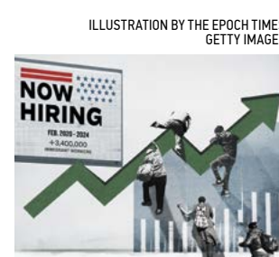
ILLUSTRATION BY THE EPOCH TIMES. GETTY IMAGES