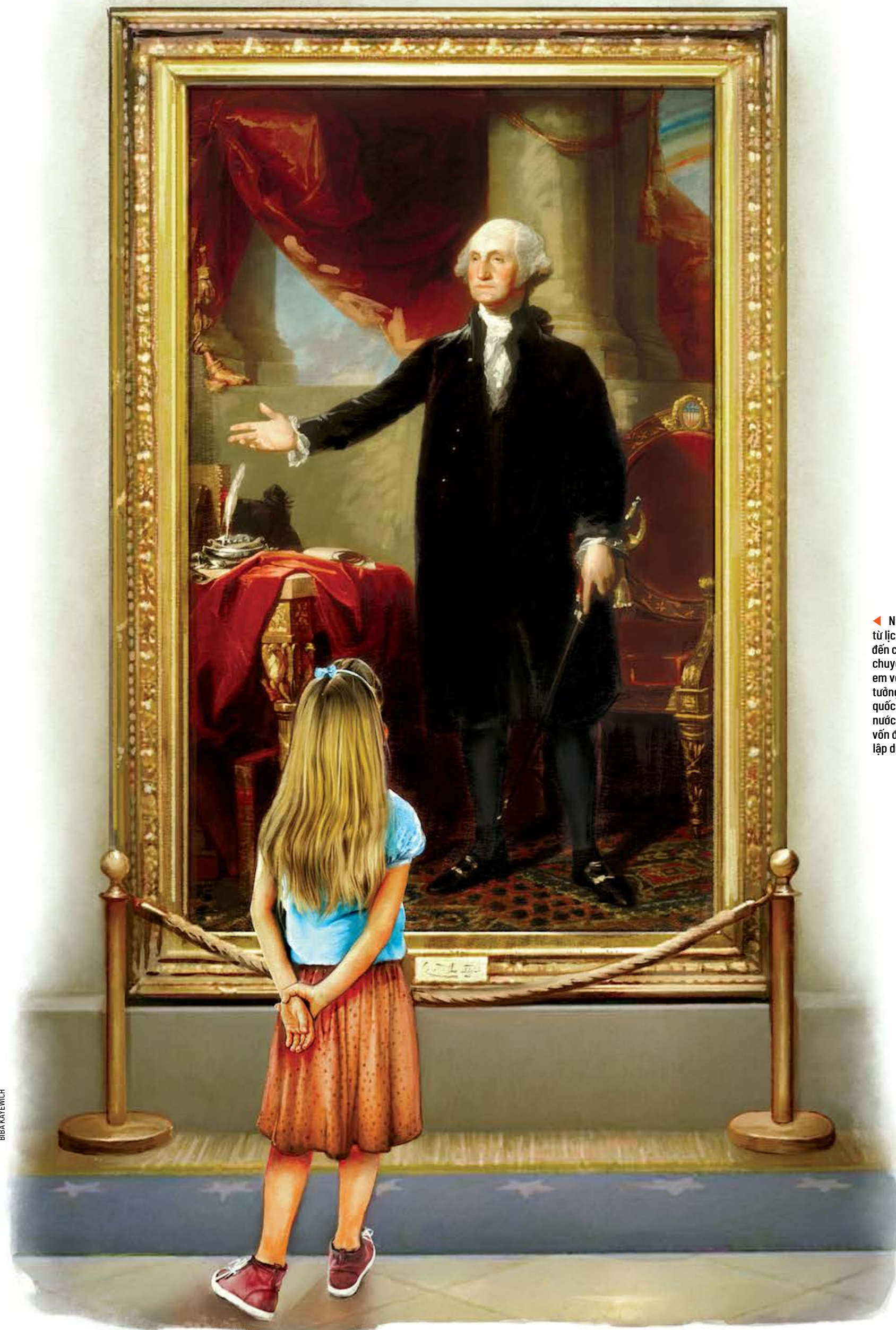
Những ví dụ từ lịch sử mang đến cơ hội để trẻ em về những lý tưởng của Mỹ quốc mà đất nước chúng ta vốn được thành lập trên đó.