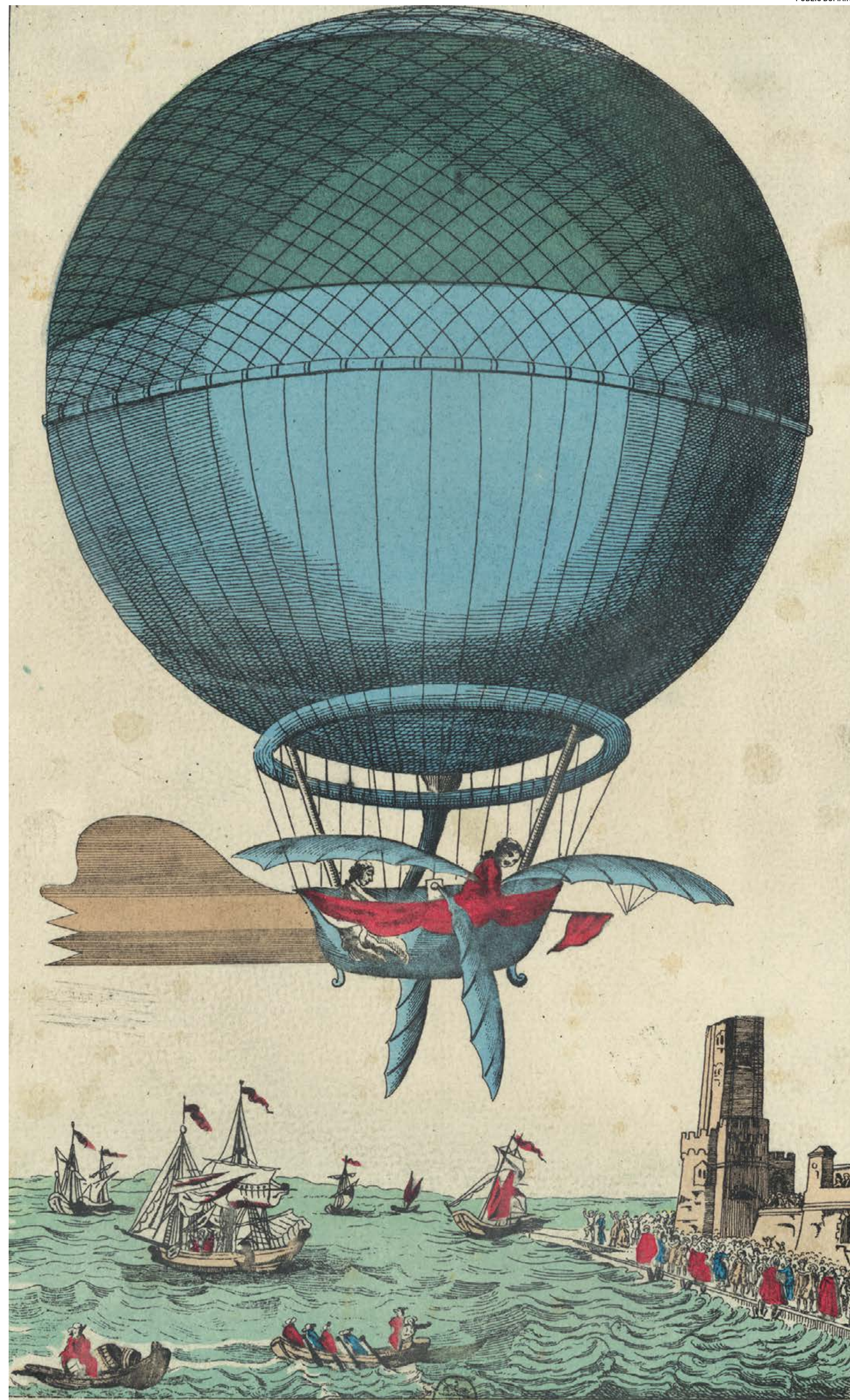
▲ Bức tranh khắc họa ông Jean Pierre Blanchard và John Jefferies đến Calais sau khi vượt qua eo biển Anh trên khinh khí cầu.