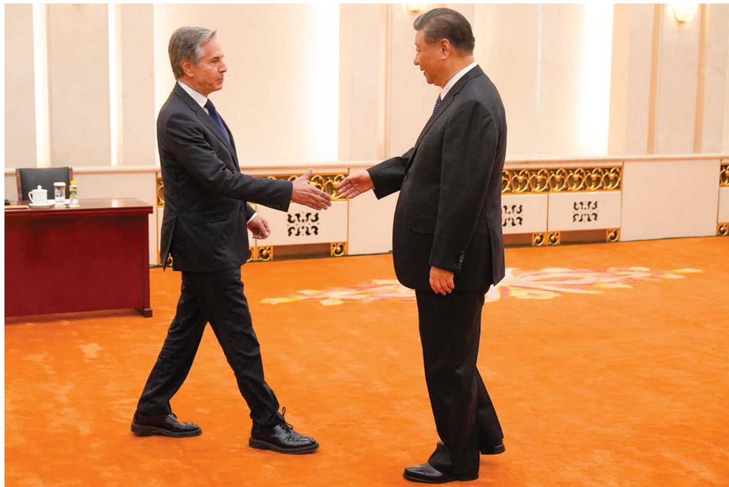
Ngoại trưởng Hoa Kỳ Antony Blinken (trái) bắt tay với lãnh đạo Trung Quốc Tập Cận Bình tại Đại lễ đương Nhân dân ở Bắc Kinh, hôm 26/04/2024.

Blinken. Trong các cuộc họp với các quan chức Trung Quốc, ông Blinken nhắc lại ông "lo ngại sâu sắc về việc PRC cung cấp các thành phần có vai trò tiếp sức cho cuộc chiến tranh xâm lược tàn khốc của Nga với Ukraine." Ông sử dụng nhóm từ PRC là viết tắt tên chính thức của Trung Quốc, Cộng hòa Nhân dân Trung Hoa.