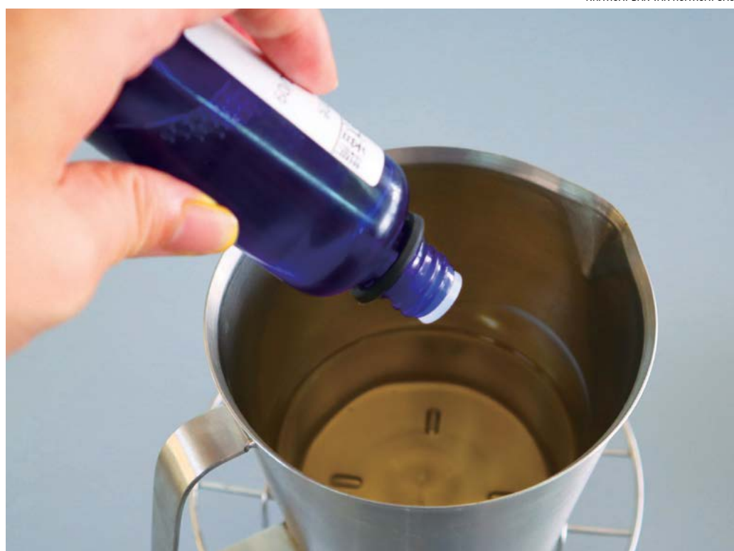
Thêm hương thơm vào sáp lỏng.