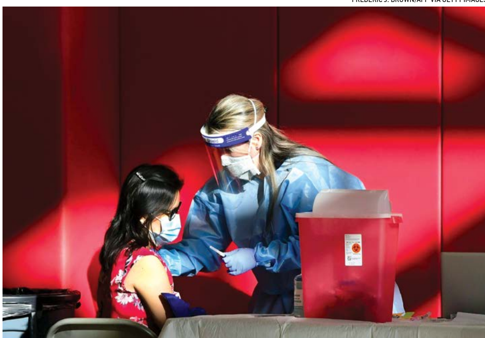
▲ Một y tá chích vaccine ngừa COVID-19 vào cánh tay của một phụ nữ tại một trường trung học ở California, vào ngày 15/01/2021.

Các tiểu bang kháng cự ‘chủ nghĩa độc tài y tế’ Hồi tháng Ba, Thượng viện Louisiana