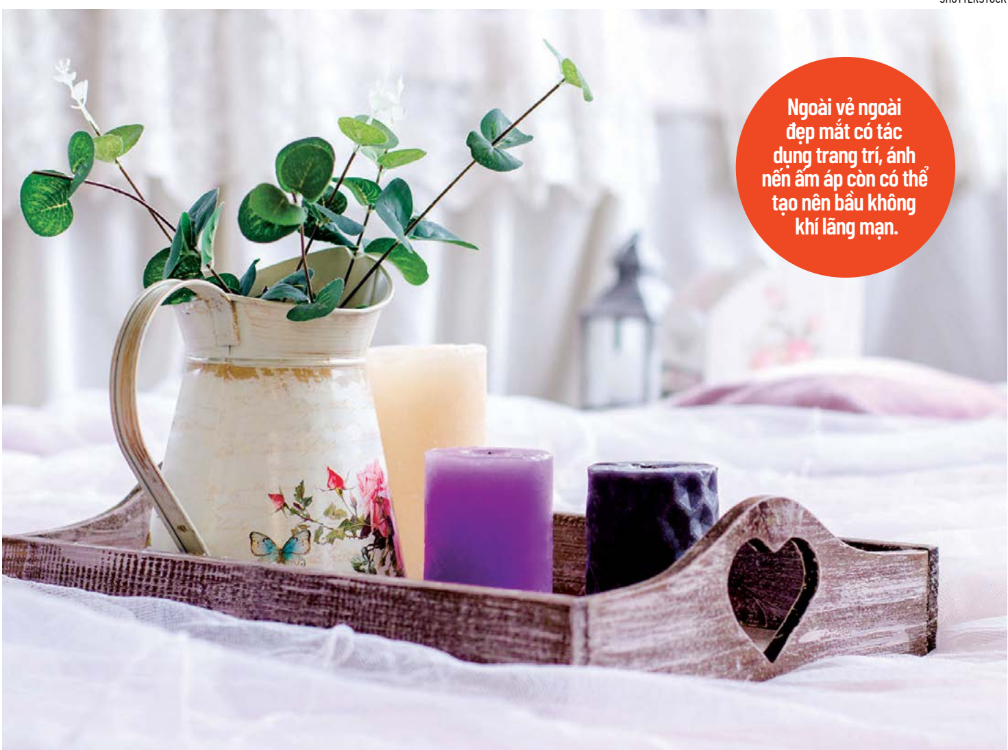
Ngoài vẻ ngoài đẹp mắt có tác dụng trang trí, ánh nến ấm áp còn có thể tạo nên bầu không khí lãng mạn.

Vì dầu thơm là sản phẩm hóa học nên khả năng chịu nhiệt và giữ mùi đều tốt hơn tinh dầu. Vì vậy, khi thêm dầu thơm