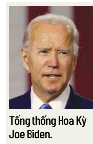
Tổng thống Hoa Kỳ Joe Biden.

Sinh viên cho rằng tổ chức Đại học Nhân dân vì Palestine được xây dựng bởi một liên minh gồm nhiều tổ chức khác nhau, trong đó Xem tiếp trang 4