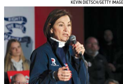
▲ Thống đốc Iowa Kim Reynolds nói tại một sự kiện ở Council Bluffs, Iowa, hôm 13/01/2024.

Dự luật 4156 nêu rõ: “Một người được xem là cư trú trái phép nếu người đó là người ngoại quốc, cố ý, và không được phép đến cũng như lưu trú tại Tiểu bang Oklahoma Xem tiếp trang 8