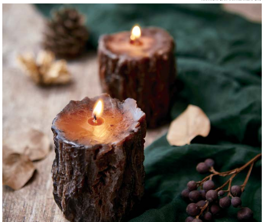
Thêm hương thơm vào bề sáp.