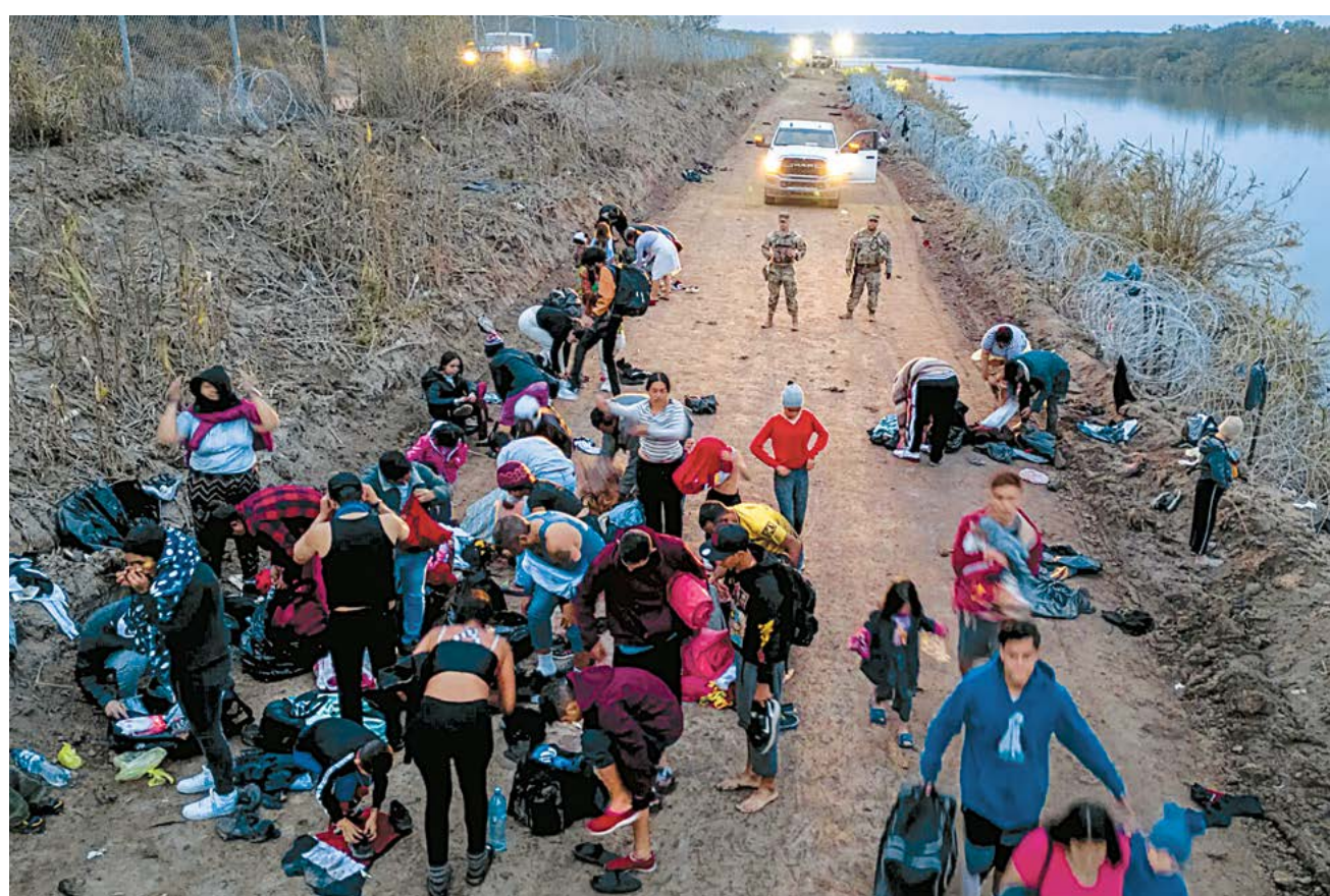
▲ Những người nhập cư bất hợp pháp thay quần áo khô sau khi lội qua Rio Grande từ Mexico, trong khi Lực lượng Vệ binh Quốc gia Texas túc trực ở Eagle Pass, Texas, vào ngày 20/12/2023.